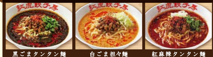
黒ごまタンタン麺