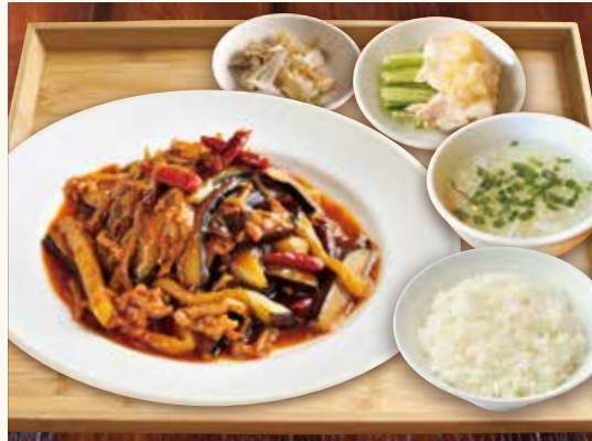
今天套餐 日替わり定食