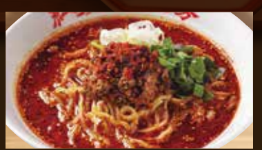
紅麻辣タンタン麺