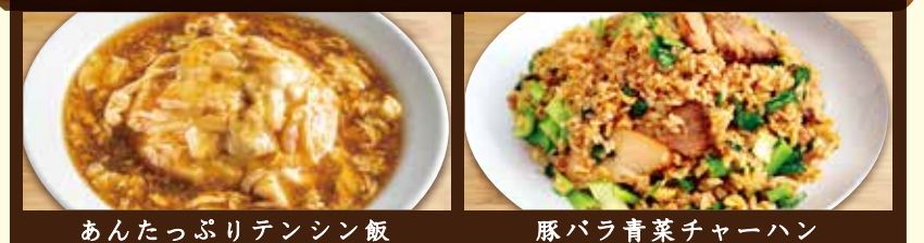
あんたっぷりテンシン飯