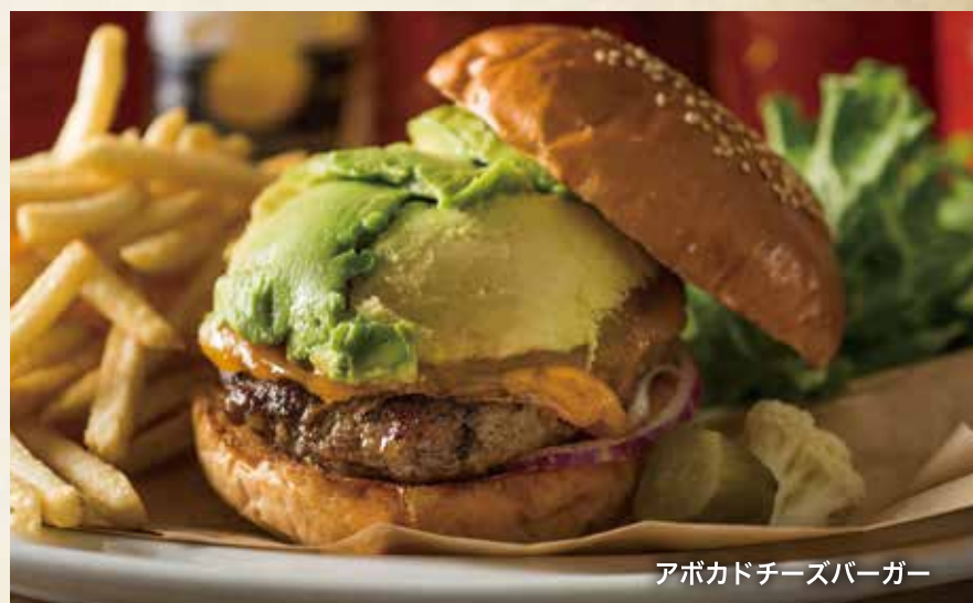
アボカドチーズバーガー