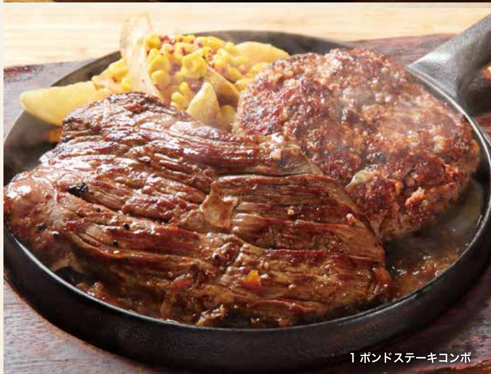
1ポンドステーキコンボ