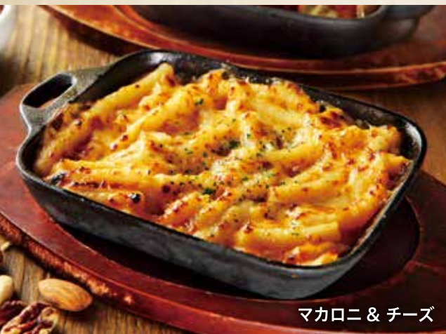
マカロニ & チーズ