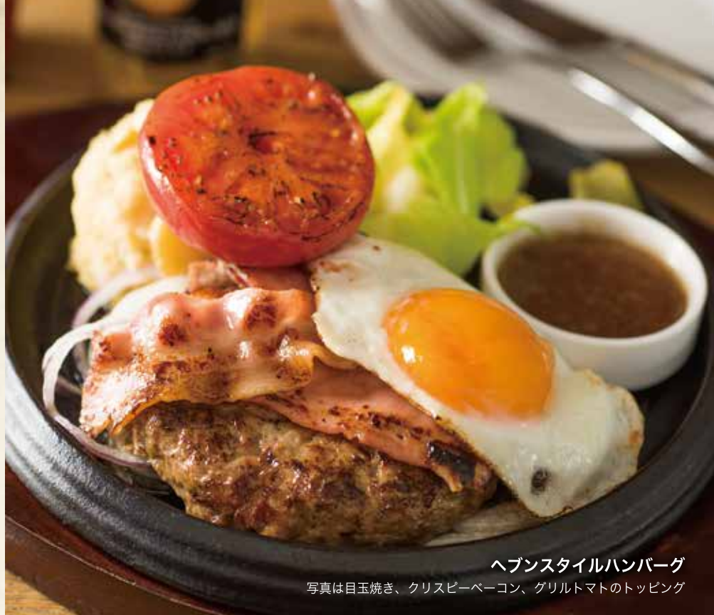
ヘブンスタイルハンバーグ