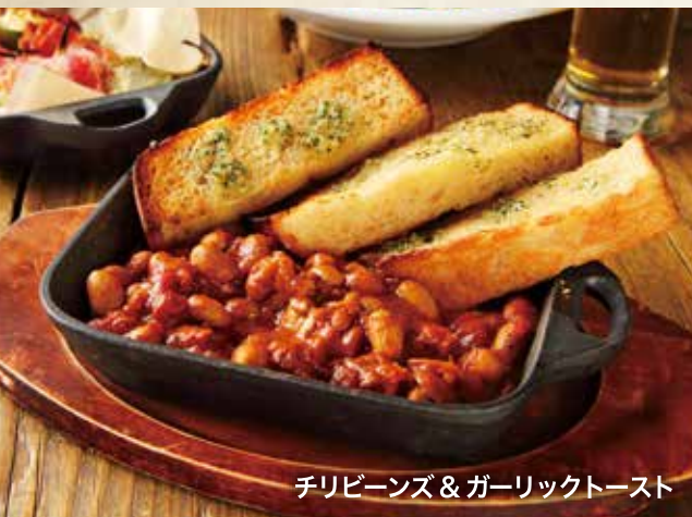
チリビーンズ & ガーリックトースト