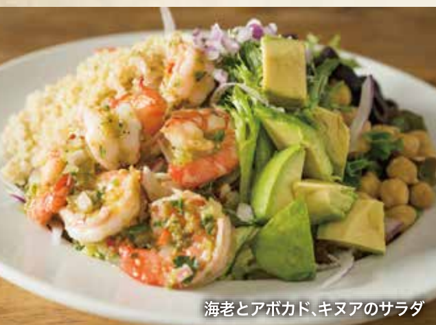
海老とアボカド、キヌアのサラダ