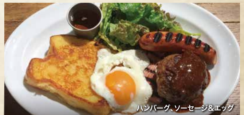
ハンバーグ、ソーセージ&エッグ

グリルチキン、厚切りベーコン&エッグ 1,500 GRILLED CHICKEN & BACON & EGG (1650)