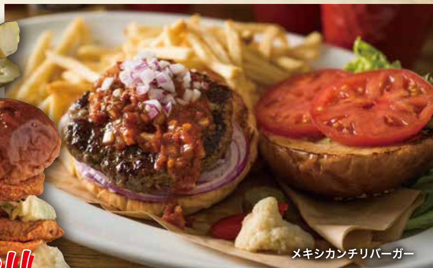
メキシカンチリバーガー