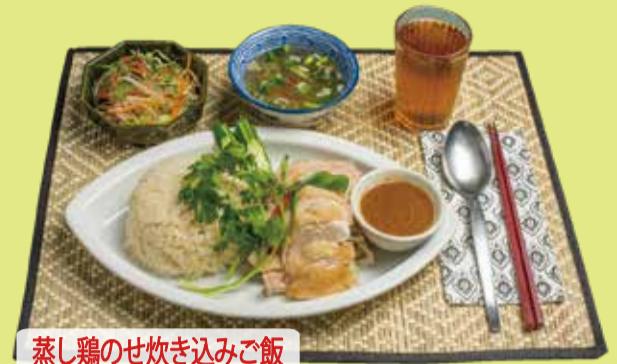
蒸し鶏のせ炊き込みご飯

カオマンガイ 990 Steamed sliced chicken on chicken rice