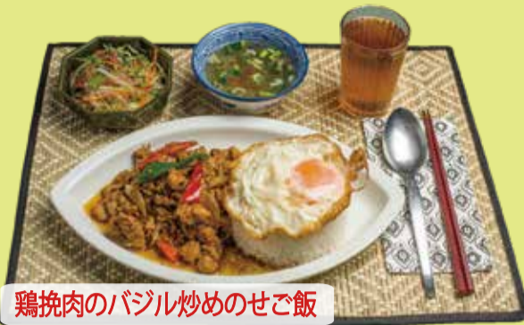
鶏挽肉のバジル炒めのせご飯

ガパオ 990 Stir-fried spicy minced chicken & herb on rice