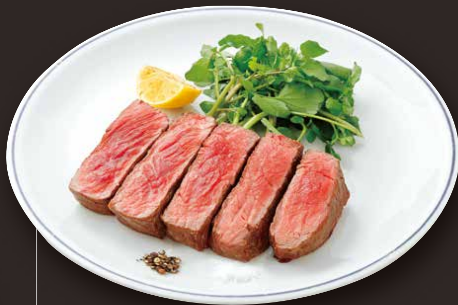
Kuroge Wagyu beef steak 黒毛和牛のステーキ