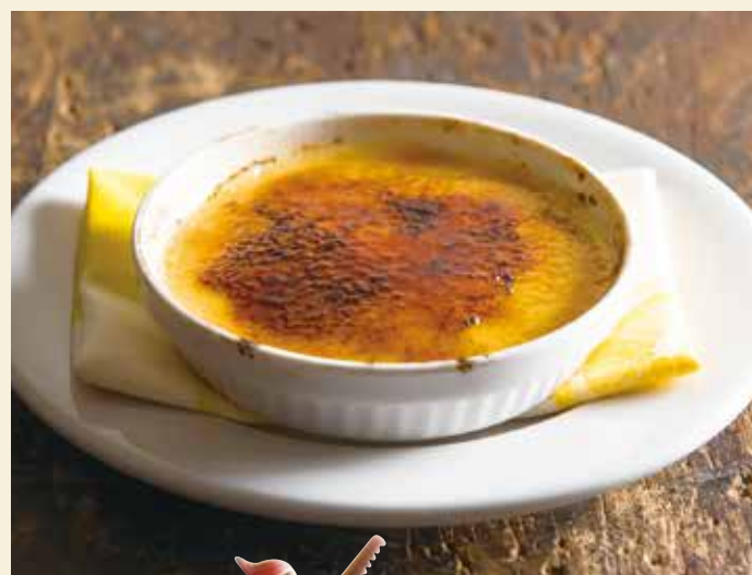
Catalana / カタラーナ