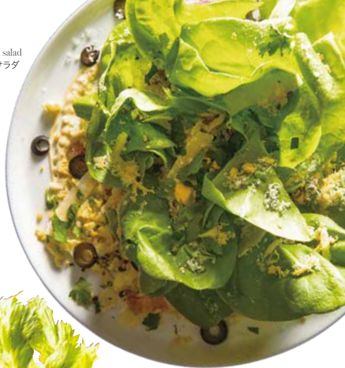
Mimosa bouquet salad / ミモザブーケサラダ