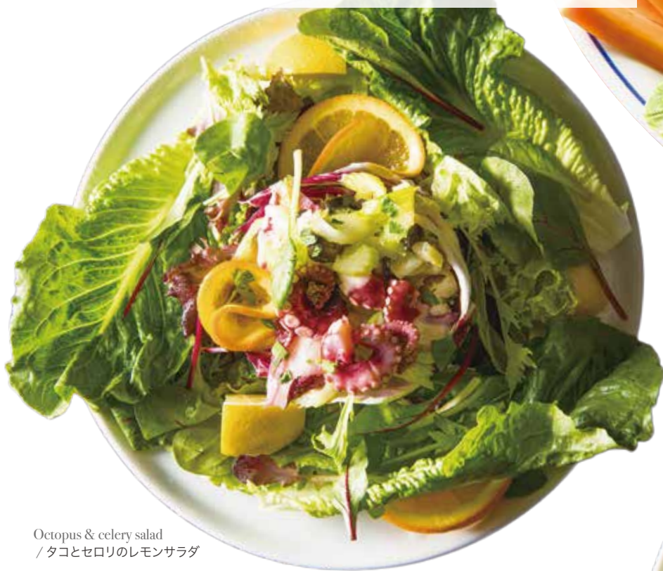
Octopus & celery salad / タコとセロリのレモンサラダ