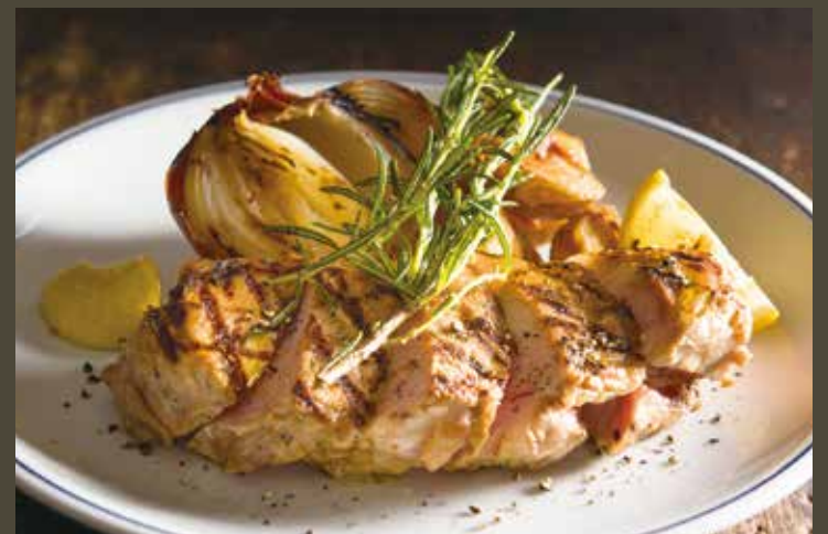
Grilled herbal pork / 豚肉の香草グリル