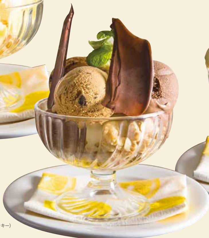
Gelato parfet (chocolate & espresso cookie) / ジェラートパフェ (チョコレート、エスプレッソクッキー)