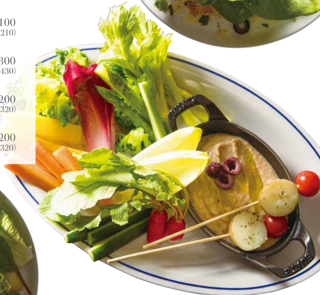
Seasonal vegetable bagna cauda / 旬の野菜のバーニャカウダ