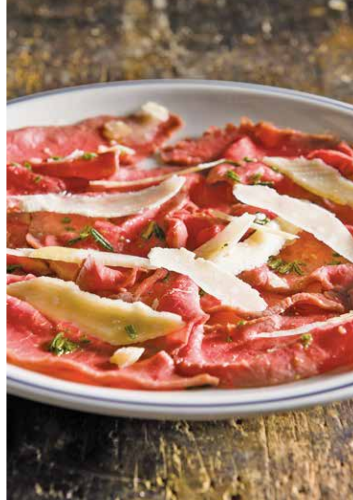
Roast beef carpaccio / ローストビーフのカルパッチョ