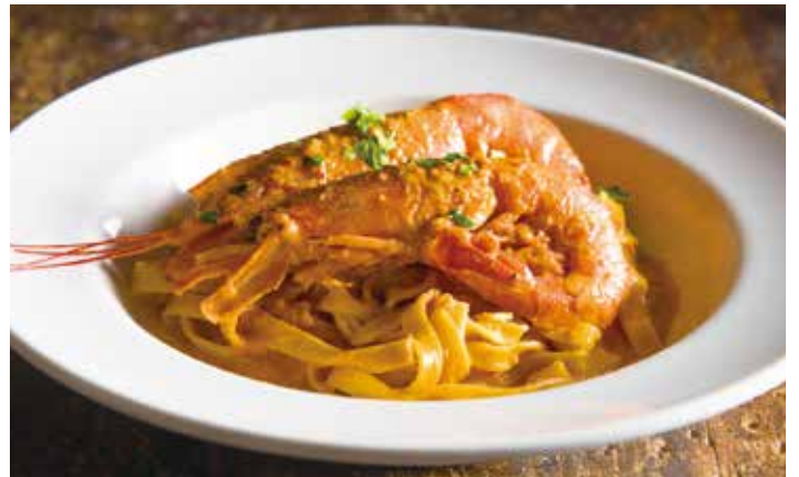
Homemade pasta with king prawn Americaine sauce / 大海老のアメリカヌソース 手打ちパスタ