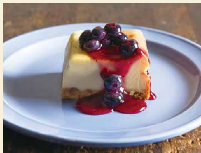
Italian cheese cake / イタリアンチーズケーキ