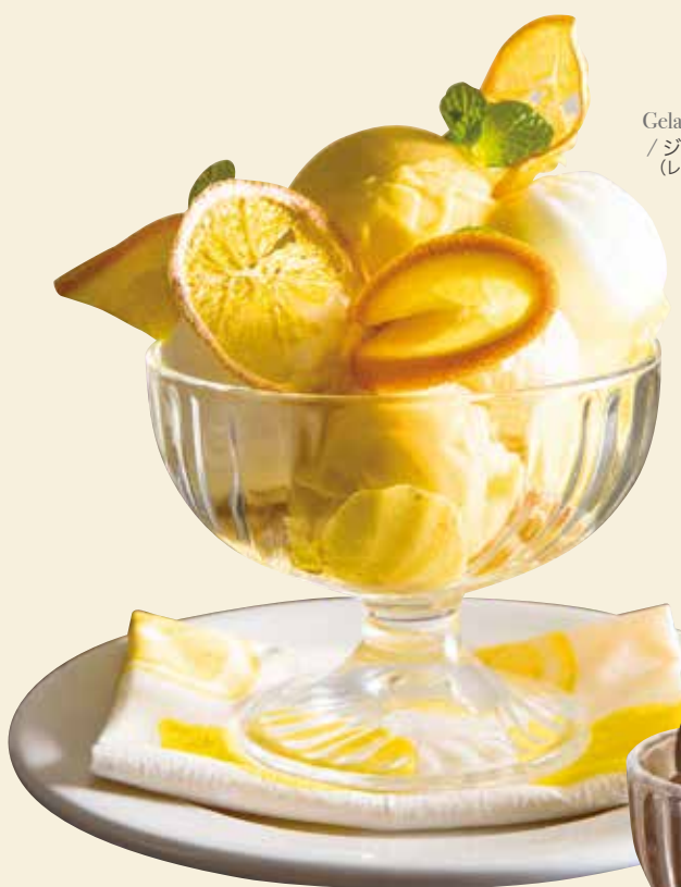
Gelato parfet (lemon & mango) / ジェラートパフェ (レモン、マンゴー)