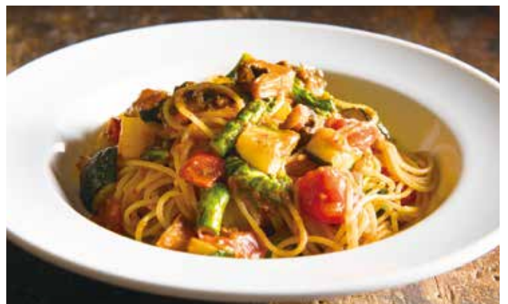
Seasonal vegetable ortolana / 旬の野菜のオルトラーナ