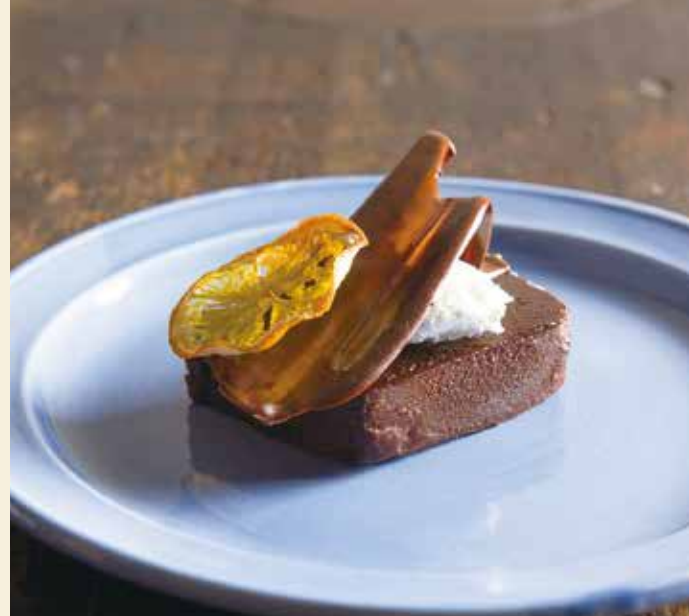
Chocolate terrine / チョコレートのテリーヌ

ジェラートパフェ (カシス、ストロベリー、マシュマロ) ..... 950 (税込 1,045)