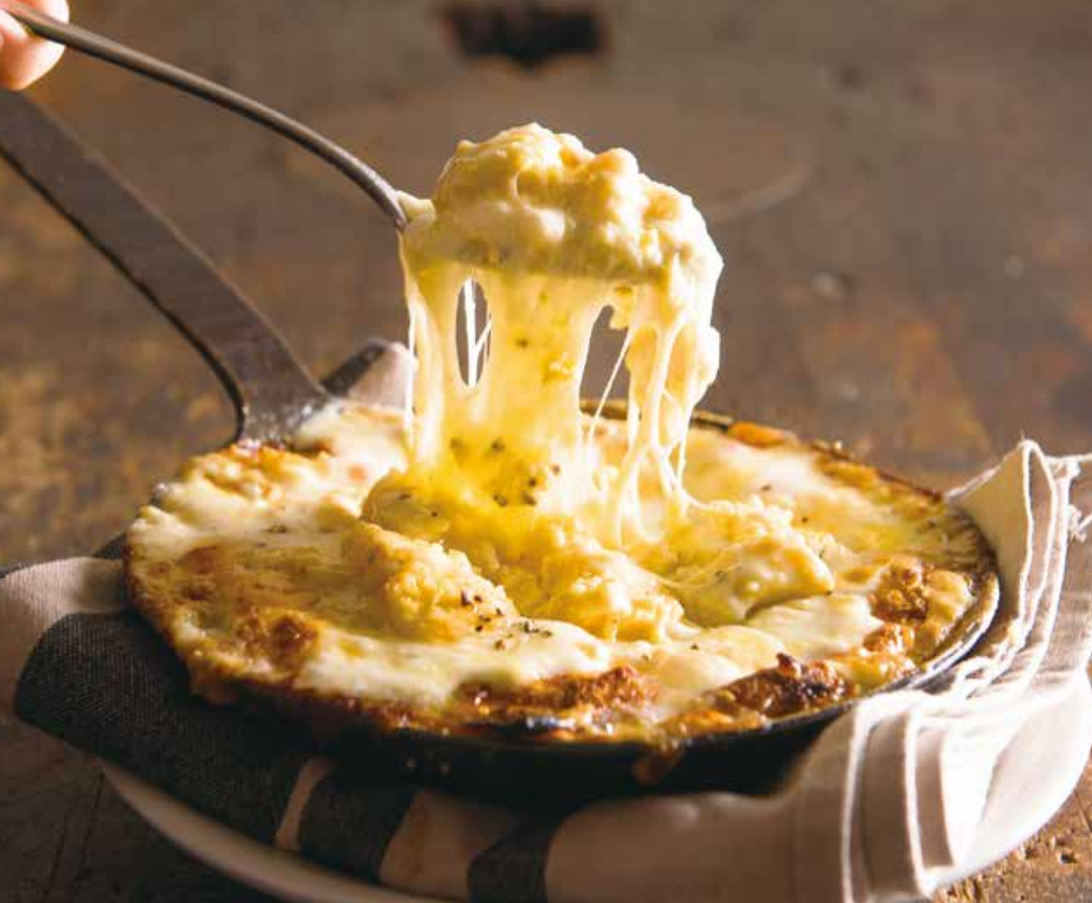
3 kinds of cheese omelette / 3種チーズオムレツ