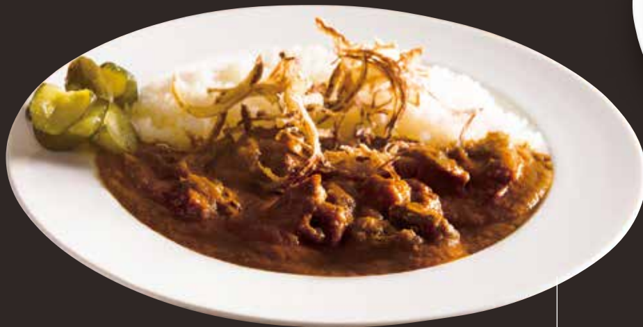
Kuroge Wagyu beef curry 黒毛和牛のビーフカレー