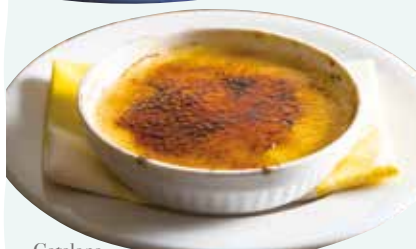
Catalana / カタラーナ