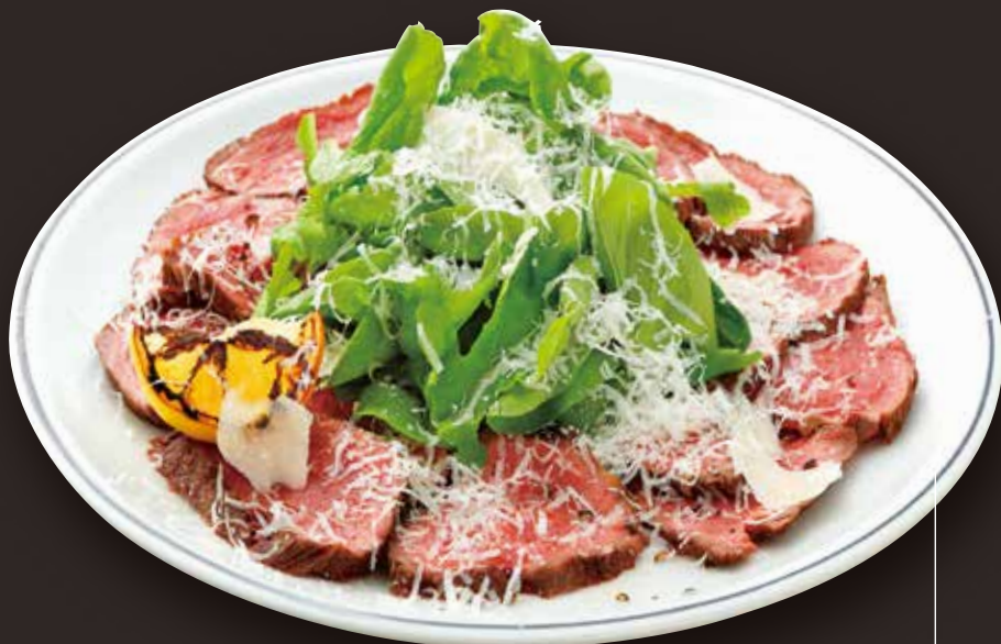
Kuroge Wagyu beef "Tagliata" 黒毛和牛のイタリアンステーキ "タリアータ"