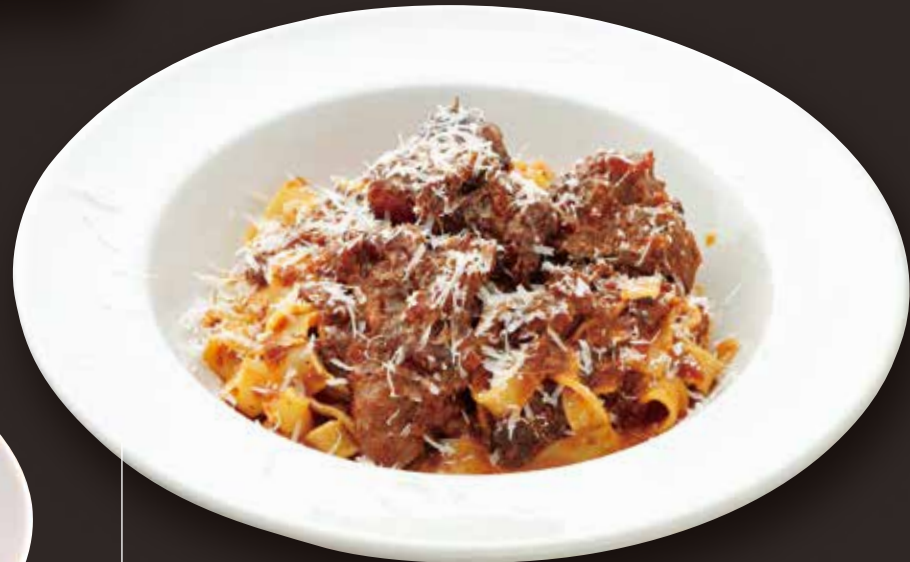
Kuroge Wagyu beef ragout pasta 黒毛和牛のラグーソース 手打ちパスタ