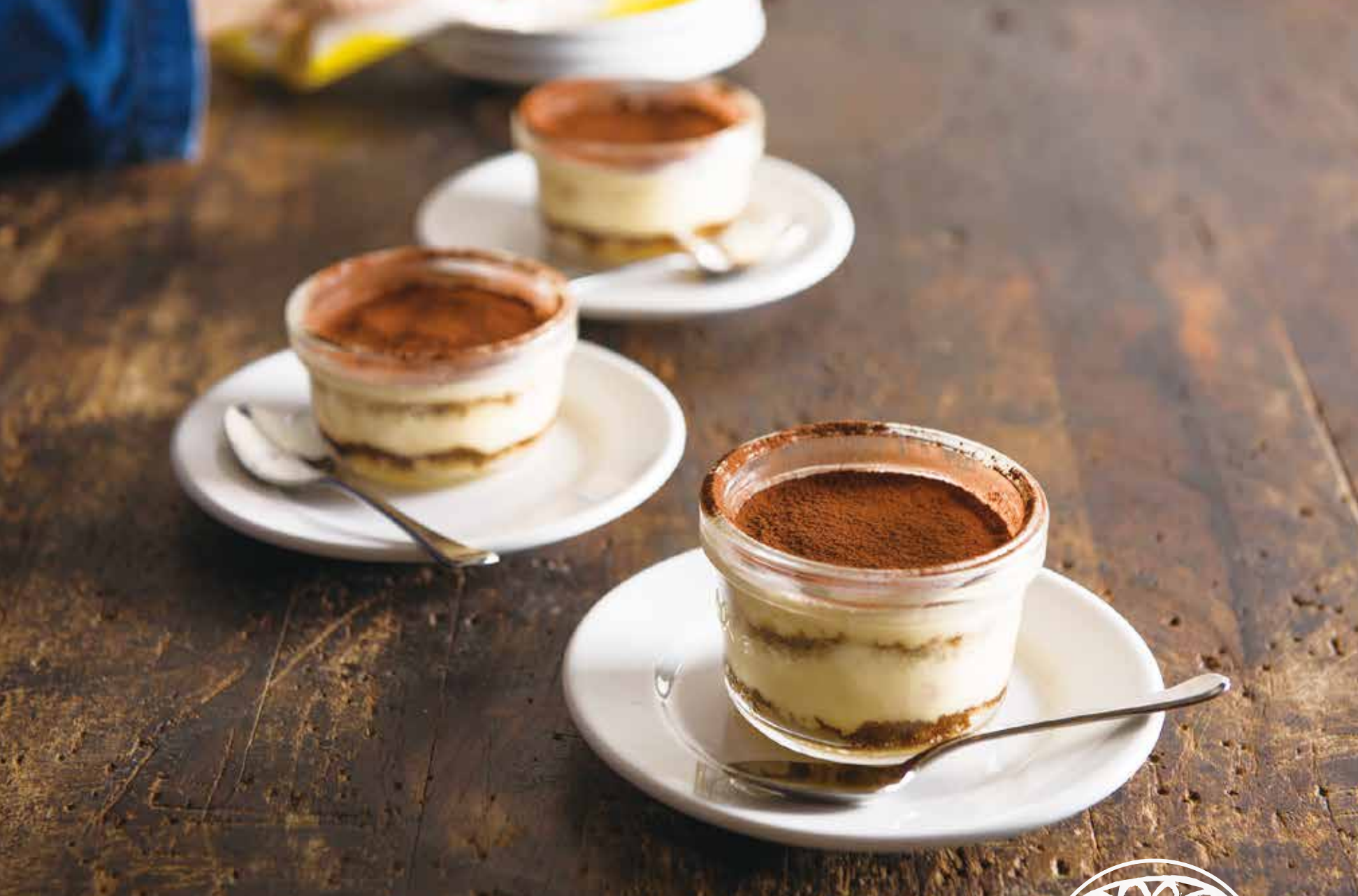
Tiramisu / ティラミス