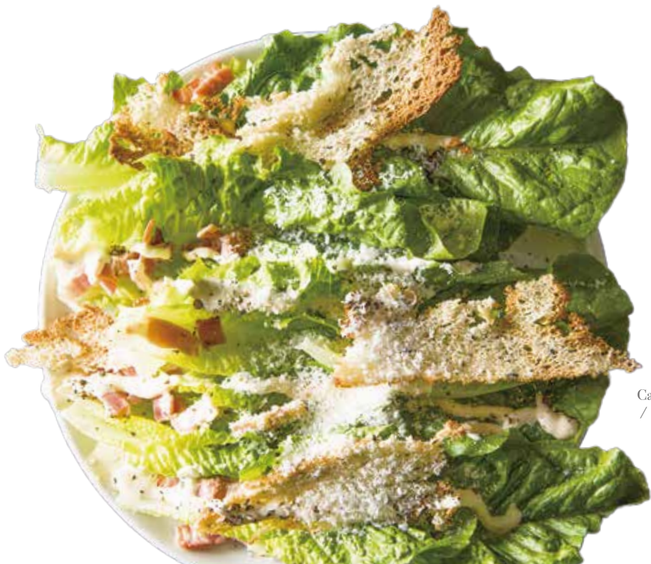
Caesar salad / シーザーサラダ