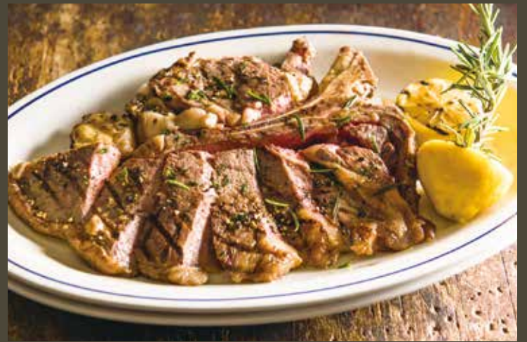
T-bone steak / T ボーンステーキ