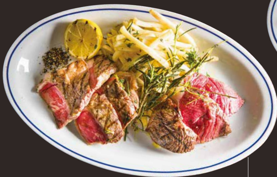
Kuroge Wagyu lean beef & Angus sirloin beef combo 黒毛和牛赤身とアンガス牛サーロインの2種肉コンボ