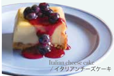
Italian cheese cake / イタリアンチーズケーキ