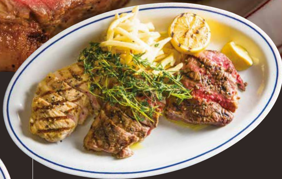
Kuroge Wagyu lean beef, Angus sirloin beef & pork combo 黒毛和牛赤身とアンガス牛サーロイン、豚肉のグリル