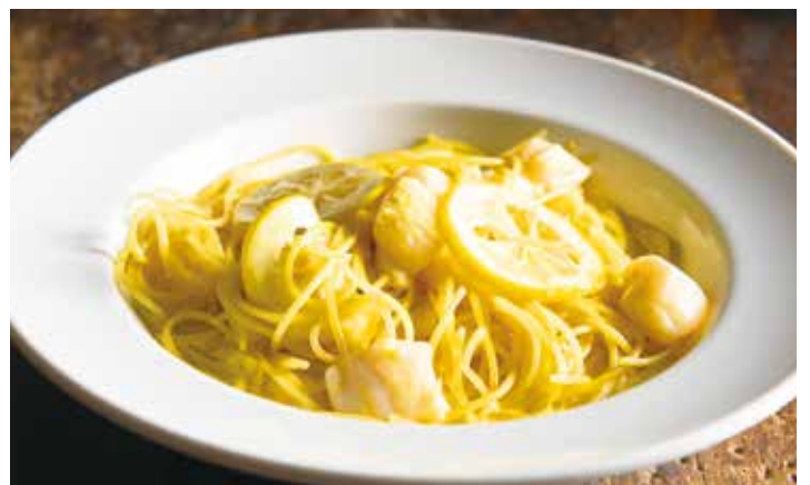
Scallop & lemon cream sauce / ホタテのレモンクリームソース