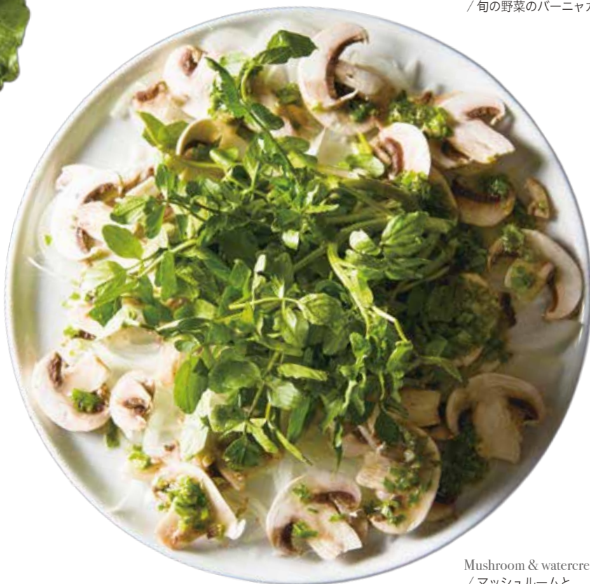
Mushroom & watercress salad / マッシュルームと クレソンのサラダ