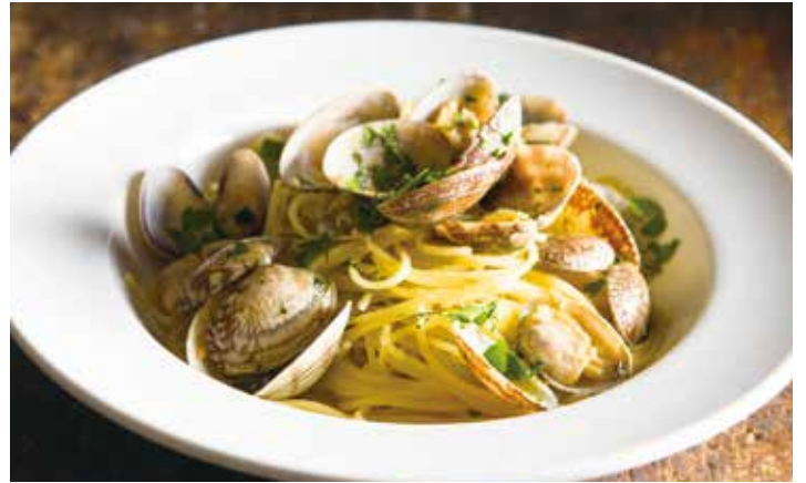
Asari clam bongole bianco / アサリのボンゴレビアンコ