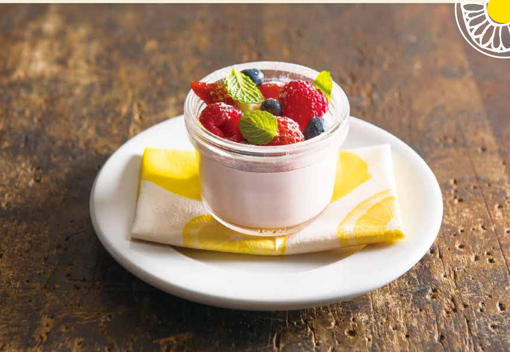
Fruit panna cotta / フルーツのパナコッタ