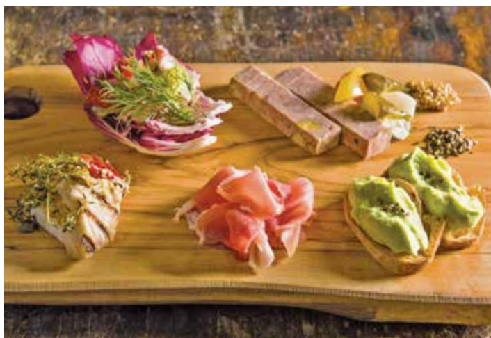
Assorted appetizer / アンティパストミスト