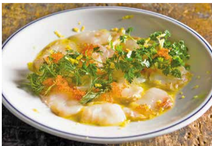
Today's fish carpaccio / 本日の魚のカルパッチョ