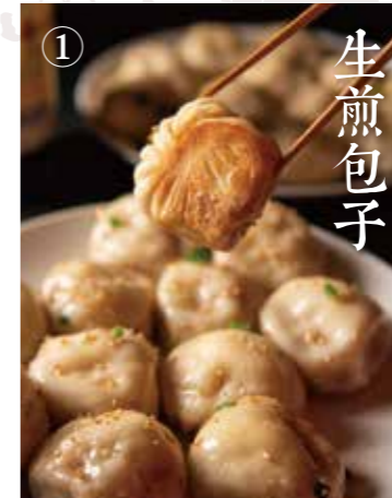
⑧ 焼きパオズ Sizzling buns 3個 480~ (税込528) 追加1個 160(税込176)