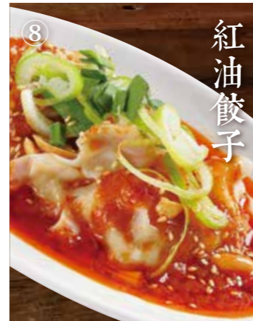
⑥ 四川ごま辛味だれ餃子 Boiled pork dumplings w/ chili oil sauce 6個 600(税込660)