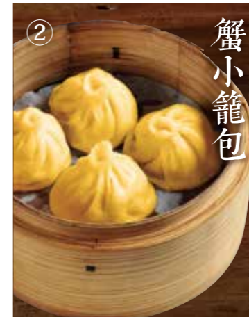
① 蟹味噌ショウロンポウ Crab meat Xiaolongbao 4個 800(税込880)