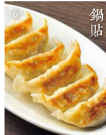
③ こぶりなやみつき餃子 Pan-fried small dumplings 6個 500(税込550)