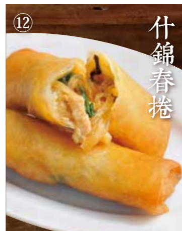
② 五目はるまき Mixed ingredients spring rolls 2本 580(税込638)