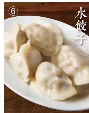
⑥ すいぎょうぎ Boiled pork dumplings 5個 500(税込550)