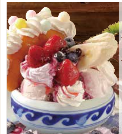
盆栽莓果パフェ 盆栽ベリーベリーパフェ 800(税込880)