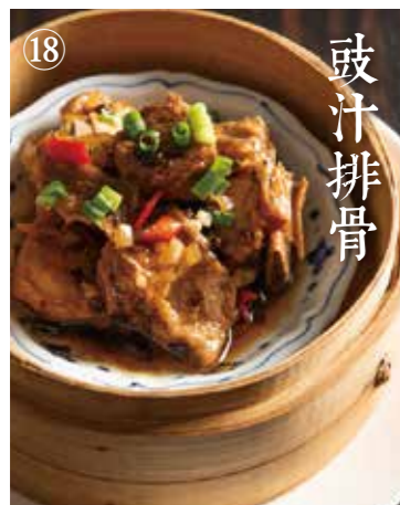
⑧ スペアリブの豆豉蒸し Steamed sparerib w/ fermented beans 580(税込638)