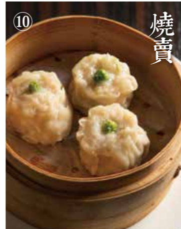
⑦ 黒豚しゅうまい Steamed KUROBUTA dumplings 3個 580(税込638)