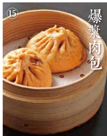
⑤ しみだれ豚まん Steamed pork dumplings 2個 480(税込528)