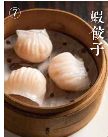
④ 海老蒸し餃子 Shrimp steamed dumplings 3個 580(税込638)