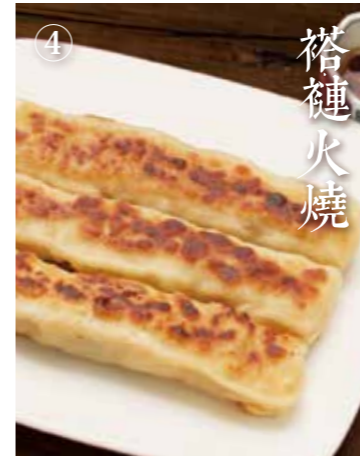
① 北京の棒焼き餃子 Pan-fried stick dumplings 3本 500(税込550)