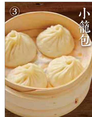
③ 上海ショウロンポウ Shanghai steamed Xiaolongbao 4個 600(税込660)