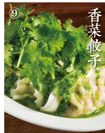
⑨ パクチーダレ餃子 Coriander on boiled pork dumplings 6個 600(税込660)