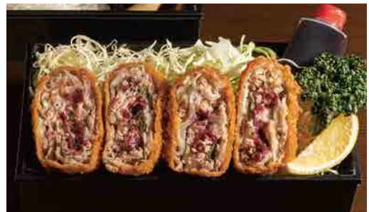
梅しそバラとんかつ弁当 Pork belly mille-feuille cutlet w/ plum lunch box 炸五花肉紫苏梅便当 1,580円