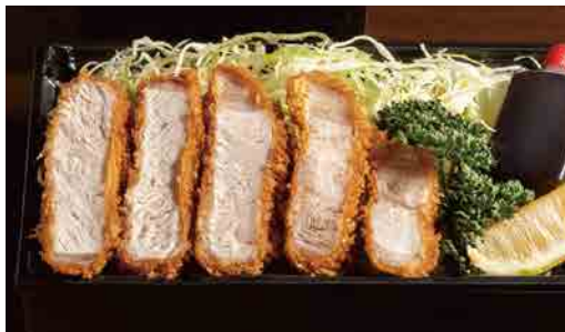
並厚切り ロースとんかつ弁当 Thick-cut loin cutlet lunch box 炸並厚切里脊猪排便当 1,580円