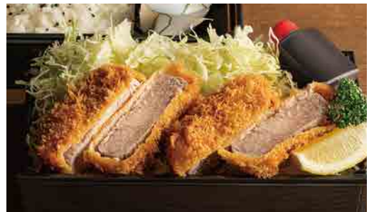
ヒレとんかつ弁当 Fillet cutlet lunch box 腰内猪排便当 1,580円