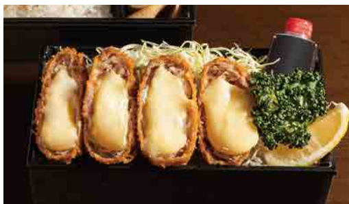
チーズバラとんかつ弁当 Pork belly mille-feuille cutlet w/ cheese lunch box 炸五花肉芝士便当 1,580円