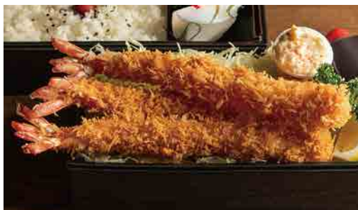
大海老フライ弁当 Deep-fried prawn lunch box 炸大虾便当 2,480円