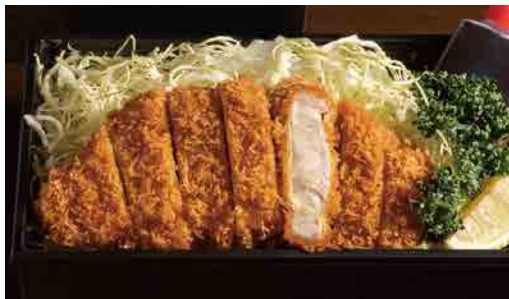
ロースとんかつ弁当 Loin cutlet lunch box 炸里脊肉便当 1,380円