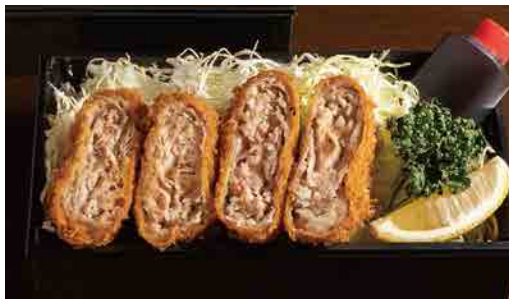
バラとんかつ弁当 Pork belly mille-feuille cutlet lunch box 炸五花肉便当 1,400円