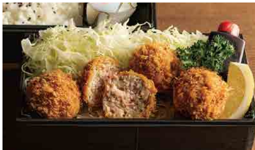
メンチとんかつ弁当 Minced pork meat cutlet lunch box 炸肉餅便当 1,380円