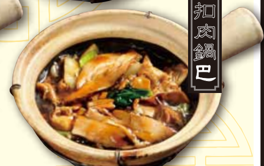
豚バラ五目おこげ Pork thick sauce on crispy rice 1280 税別