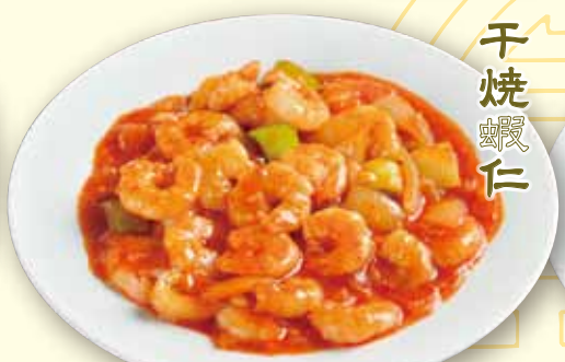
エビチリソース 1280 税別 Stir-fried shrimp with chili sauce