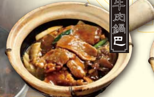
牛肉五目おこげ Beef thick sauce on crispy rice 1480 税別