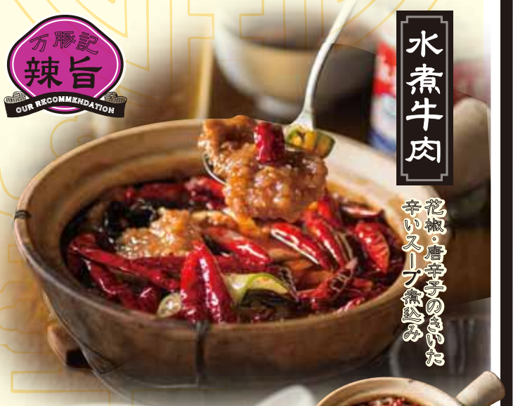
牛肉のうま辛煮込み Stewed sliced beef w/ hot chili oil 1280 税別