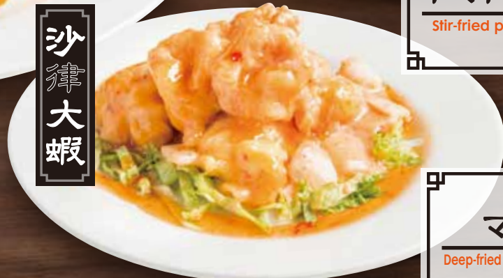
大海老 マヨネーズ Deep-fried prawns w/ mayonnaise sauce 1480 税別