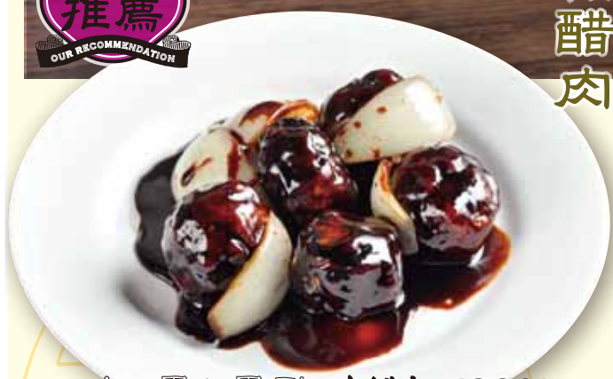
まっ黒! 黒酢すぶた 1280 税別 Sweet & sour pork