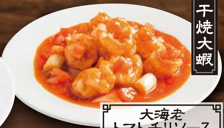
大海老 トマトチリソース Stir-fried prawns w/ chilli sauce 1480 税別