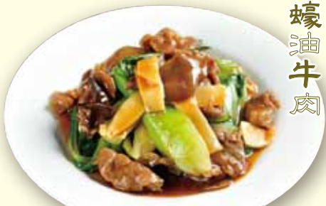
牛肉青菜オイスターソース炒め Stir-fried beef w/ oyster sauce 1280 税別