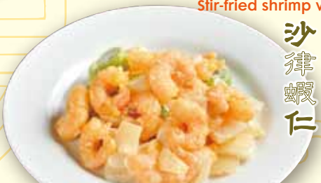
エビマヨネーズ Deep-fried shrimp w/mayonnaise sauce 1280 税別