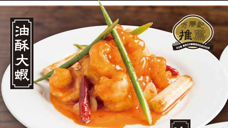
大エビにんにく唐辛子炒め Stir-fried prawns w/ garlic sweet & chilli sauce 1480 税別