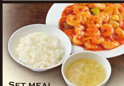
SET MEAL 定食セット 200 税別 ライス・スープ Rice & soup