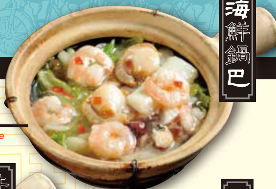
海鮮五目おこげ Seafood thick sauce on crispy rice 1380 税別