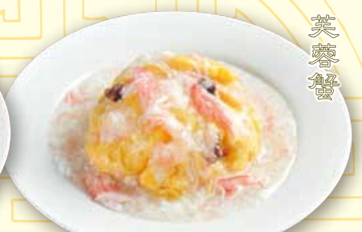
かに玉 1280 税別 Crab omelet