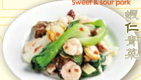
エビ海鮮青菜炒め Stir-fried shrimp & chinese leaves 1280 税別