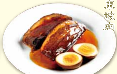
豚角煮 トンポーロウ Braised Pork Belly 1180 税別