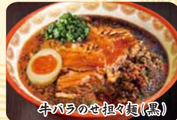
牛バラのせ担々麺(黒)