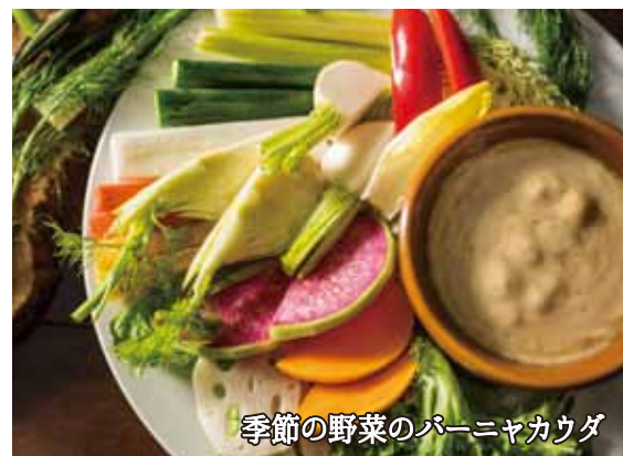
季節の野菜のパーニャカウダ

当店では、【アレルギー特定原材料7品目】及び【アレルギー特定原材料に準ずる20品目】を同一の厨房で調理をしております。調理機器、洗浄機器についても、共通のものを使用するため調理過程においてアレルギー物質が混入する可能性があります。使用している麺類は一部そば粉を使用した製品と同一の環境で製造しております。そのため、提供する料理はアレルギーに完全に対応できる商品ではございませんので予めご了承くださいませようようお願い申し上げます。また、重篤な症状が懸念されるお客様に関しては安全第一を考え、やむをえず食事の提供をお断りさせて頂く場合がございます。ご注文に際して上記内容をご確認のうえ、お客様による最終的なご判断をお願い致します。