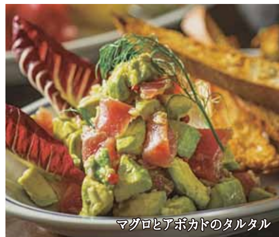
マグロとアボカドのタルタル