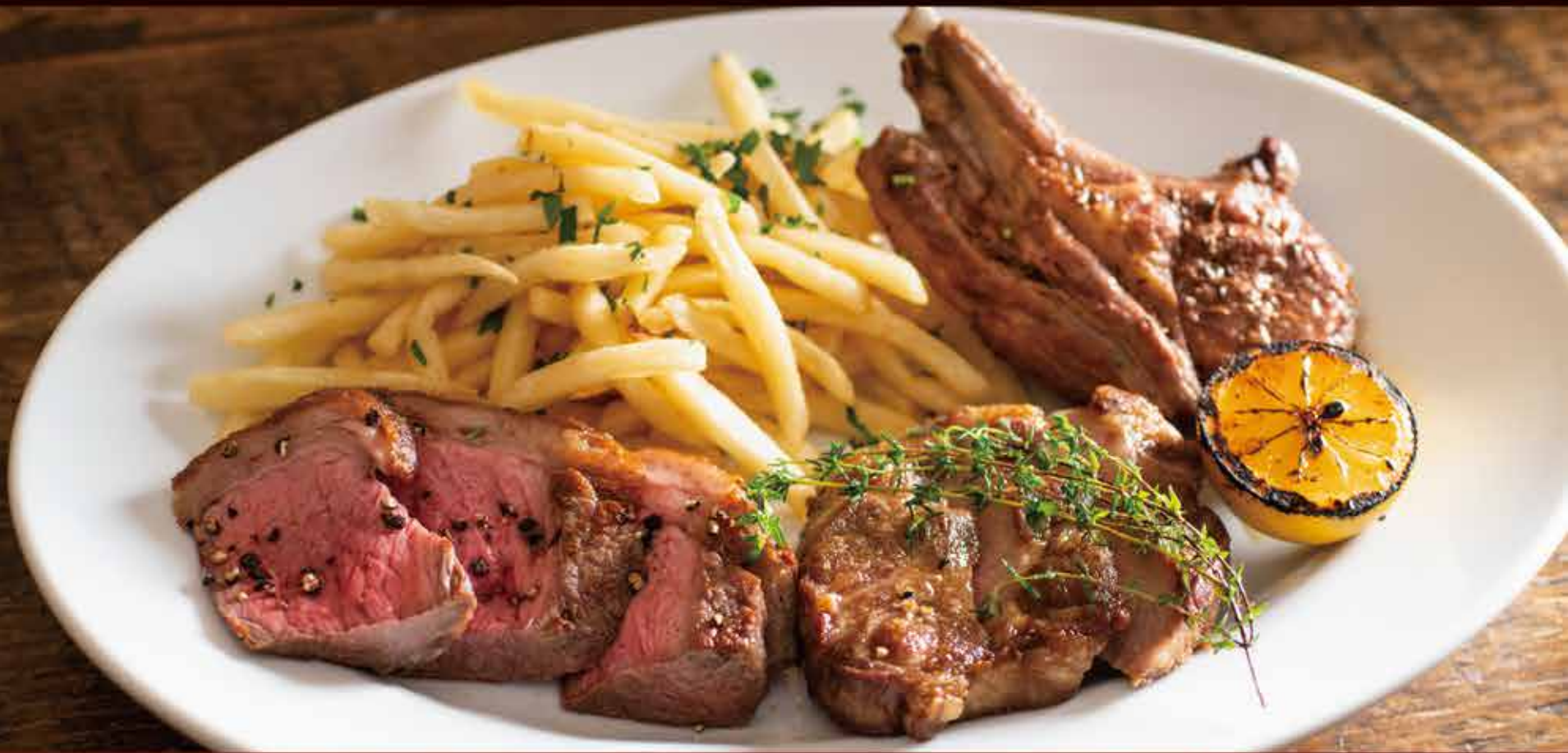
Tokachi-wakaushi beef, sirloin & Iberian pork / 十勝若牛、サーロイン、イベリコ豚