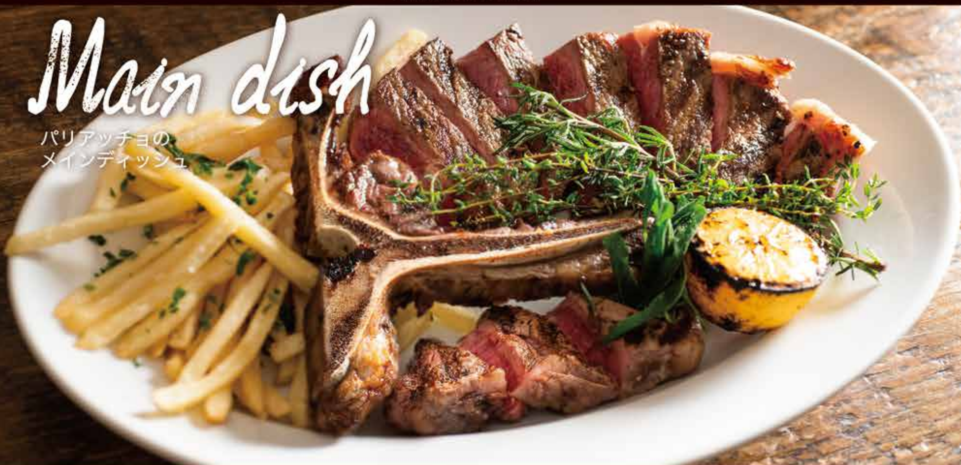
T-bone steak / Tボーンステーキ