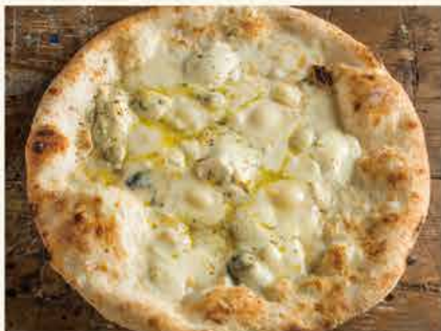
"Quattro formaggi" (4kinds of cheese) / 4種のチーズピッツァ クワトロフォルマッジ