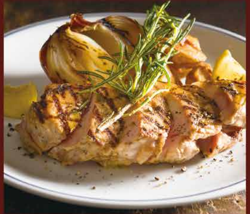
Herb grilled Iberian pork / イベリコ豚の香草グリル