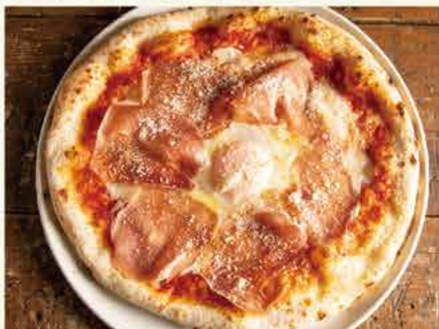
"Bismarck" w/ uncured ham & egg / 生ハムと半熟卵のビスマルク