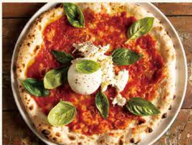
Margherita w/ Burrata cheese / ブラータチーズのマルゲリータ