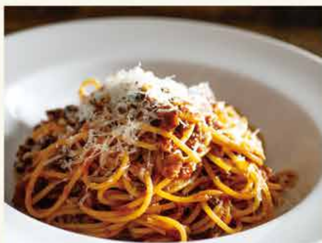
Spaghetti bolognese / ボロネーゼスパゲティ