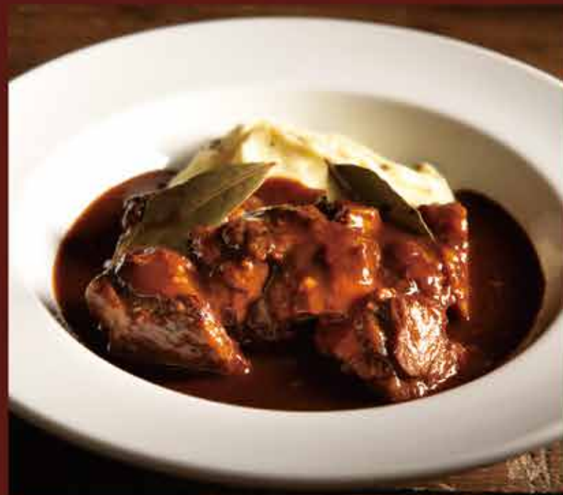
Beef stew / 柔らかビーフシチュー