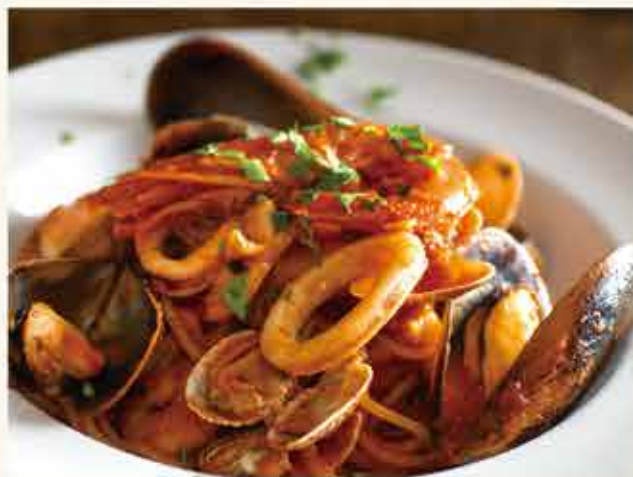
Homemade pasta with Uni cream sauce / 魚介のペスカトーレスパゲッティ