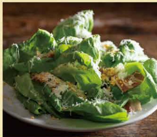
Mimosa bouquet salad / ミモザブーケサラダ