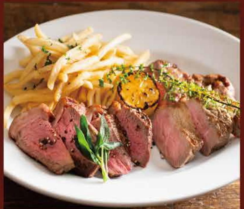
Beef lean, Sirloin / 十勝若牛とサーロイン