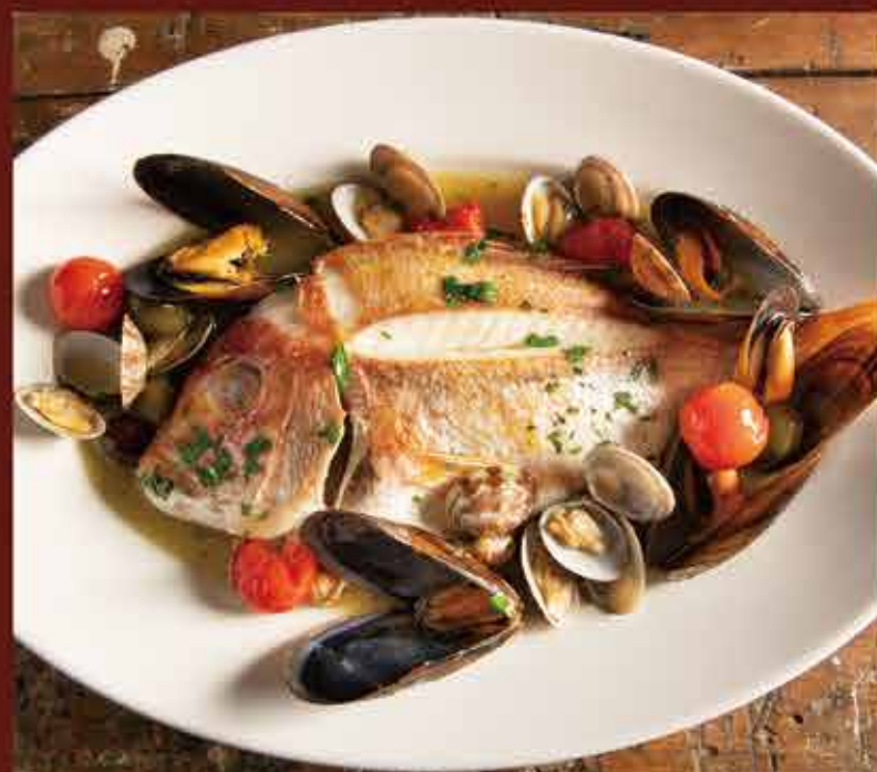
Aquapazza / アクアパッツァ