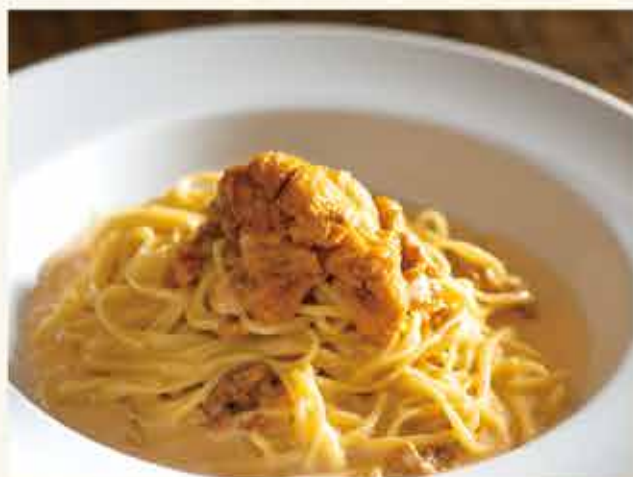
Tagliolini w/ fresh sea urchin cream sauce / 生ウニのクリームソース タリオリーニ