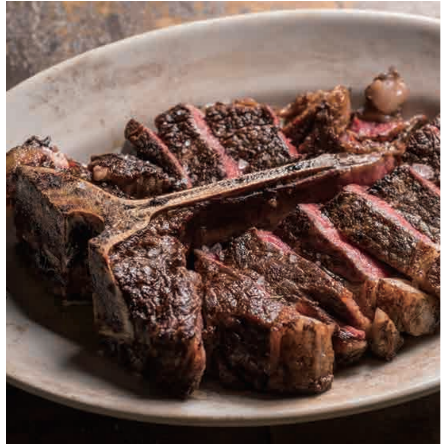
Tボーンステーキ フィオレンティーナ Bistecca alla fiorentina