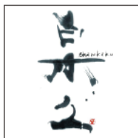
1 白木久 BASARA 白杉酒造 / 峰山