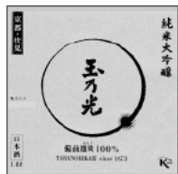
32 玉乃光 備前雄町 玉乃光酒造 / 伏見