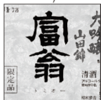
23 富翁 北川本家 / 伏見