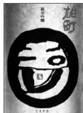
5 玉川雄町 木下酒造 / 峰山