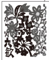
12 六飲はな 東和酒造 / 福知山