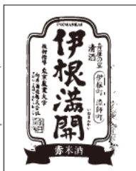
8 伊根満開 向井酒造 / 宮津