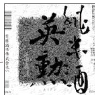
28 英勲 斎藤酒造 / 伏見