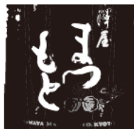
38 澤屋まつもと 松本酒造 / 伏見