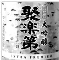
18 聚楽第 大吟醸 佐々木酒造 / 京都