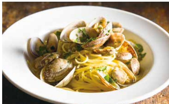
Asari clam bongole bianco / アサリのボンゴレビアンコ