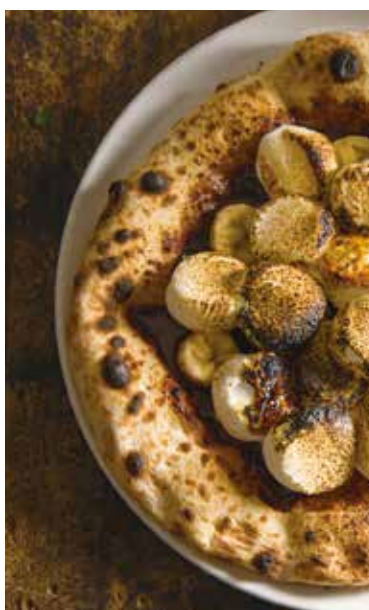
Marshmallow & cacao nutella pizza / マシュマロ、カカオのヌテラピッツァ