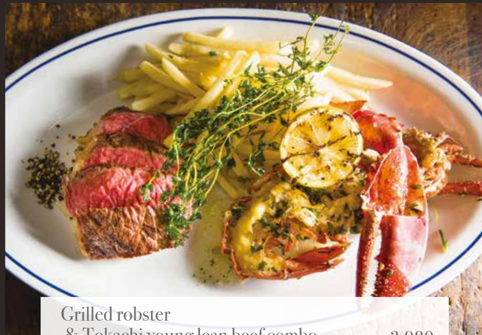
Grilled lobster & Tokachi young lean beef combo 3,980 ロブスターグリルと十勝若牛赤身コンボ