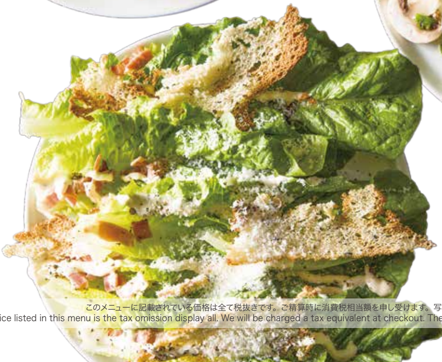
Caesar salad / シーザーサラダ

このメニューに記載されている価格は全て税抜きです。ご精算時に消費税相当額を申し受けます。写真はイメージです。 Price listed in this menu is the tax omission display all. We will be charged a tax equivalent at checkout. The photo is for illustrative purposes only.