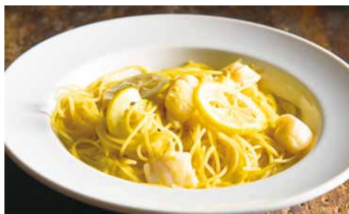
Scallop & lemon cream sauce / ホタテのレモンクリームソース