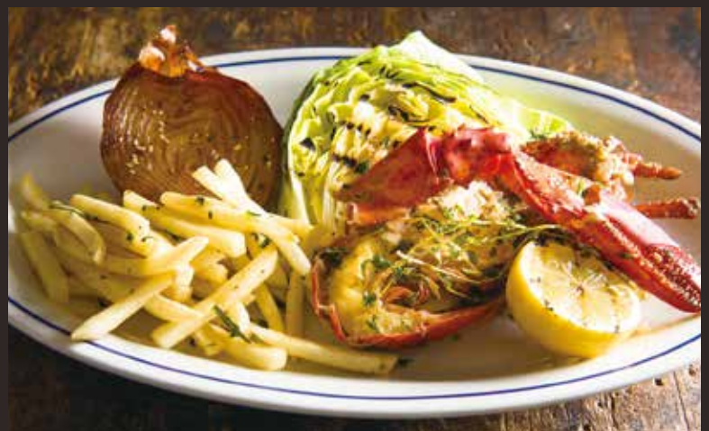
Grilled lobster with herbal butter / ロブスター香草バター