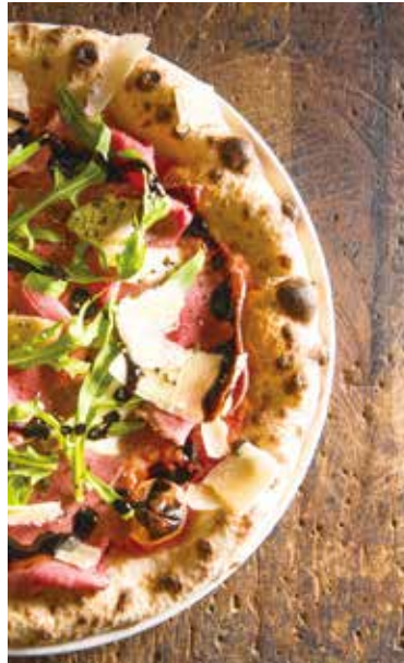
Roast beef pizza / ローストビーフのピッツァ