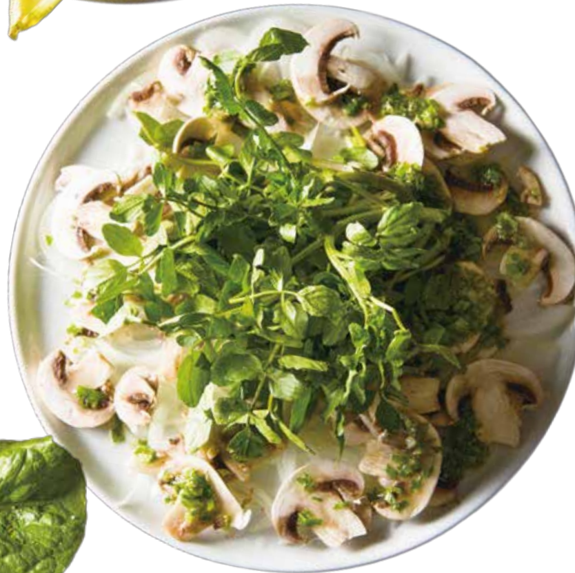
Mushroom & watercress salad / マッシュルームと クレソンのサラダ