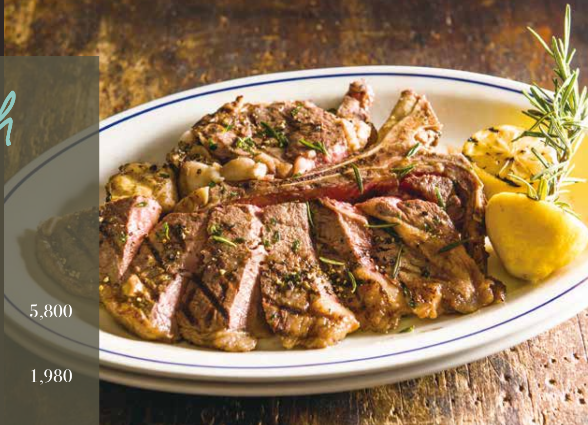
T-bone steak / T ボーンステーキ