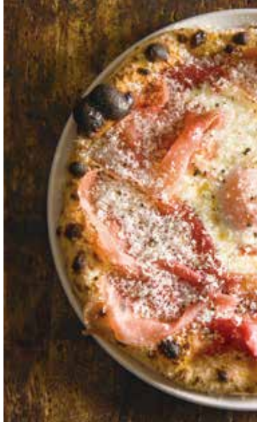
Egg & prosciutto bismarck pizza / 卵と生ハムのビスマルクピッツァ