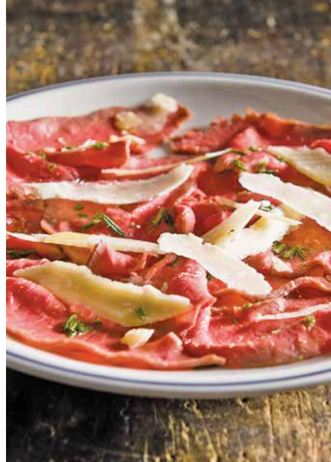
Roast beef carpaccio / ローストビーフのカルパッチョ