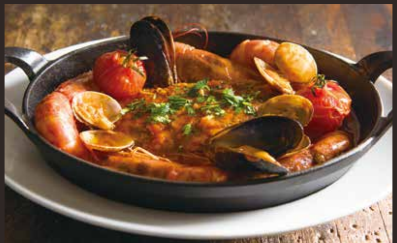
Stewed seafood with tomato “caciucco” / イタリアン漁師のトマト煮込み “カチュッコ”