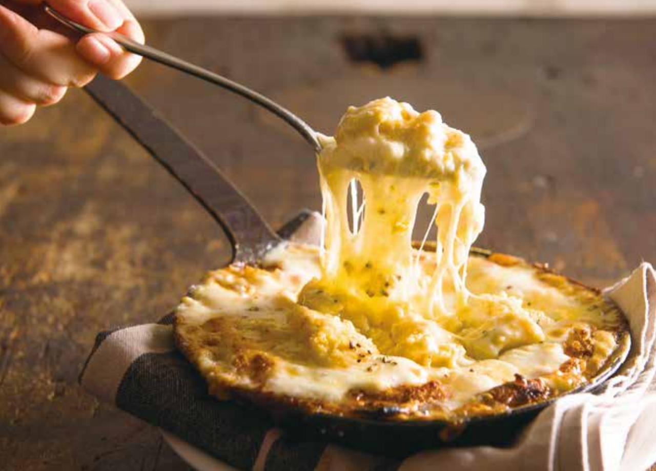
3 kinds of cheese omelette / 3種チーズオムレツ