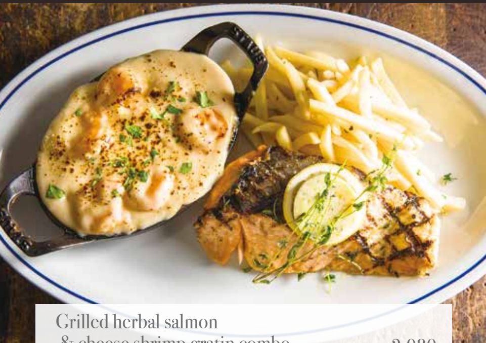
Grilled herbal salmon & cheese shrimp gratin combo 2,980 サーモン香草グリルと海老チーズグラタンコンボ