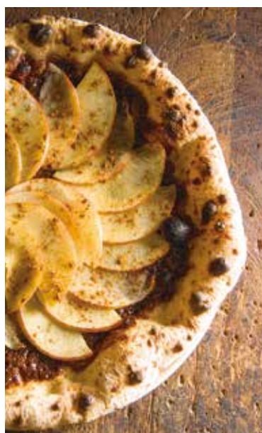
Apple & cinnamon nutella pizza / アップル、シナモンのヌテラピッツァ

Egg & prosciutto bismarck pizza 1,580 卵と生ハムのビスマルクピッツァ