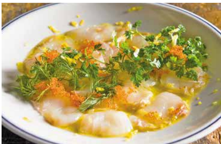
Today's fish carpaccio / 本日の魚のカルパッチョ