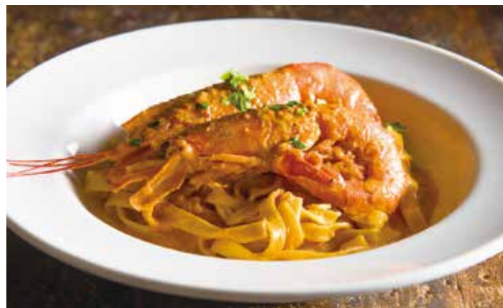
Homemade pasta with king prawn Americaine sauce / 大海老のアメリカヌソース 手打ちパスタ