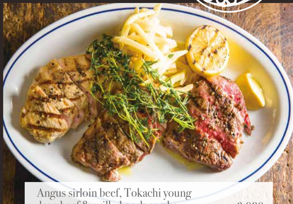
Angus sirloin beef, Tokachi young lean beef & grilled pork combo 3,980 アンガス牛サーロインと十勝若牛赤身、豚肉のグリル