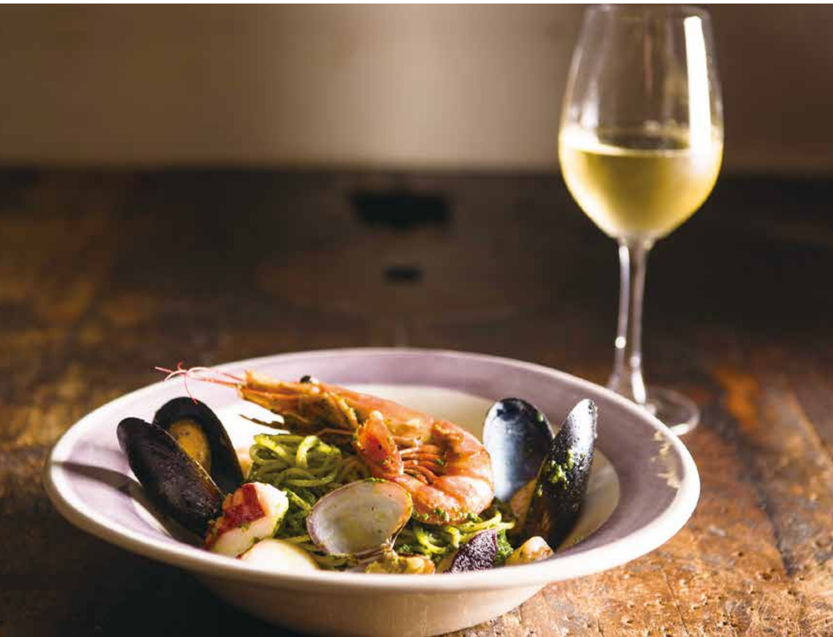
Shrimp & seafood genovese / 海老と魚介のジェノベーゼ