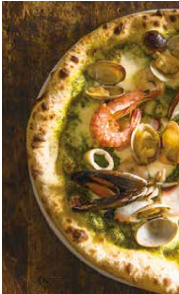
Seafood genovese pizza / 魚介のジェノベーゼピッツァ