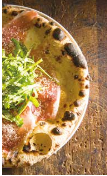
Prosciutto & rocket pizza / 生ハムとルーコラのピッツァ