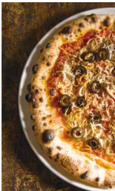
Whitebait & olive marinara / シラスとオリーブのマリナーラ