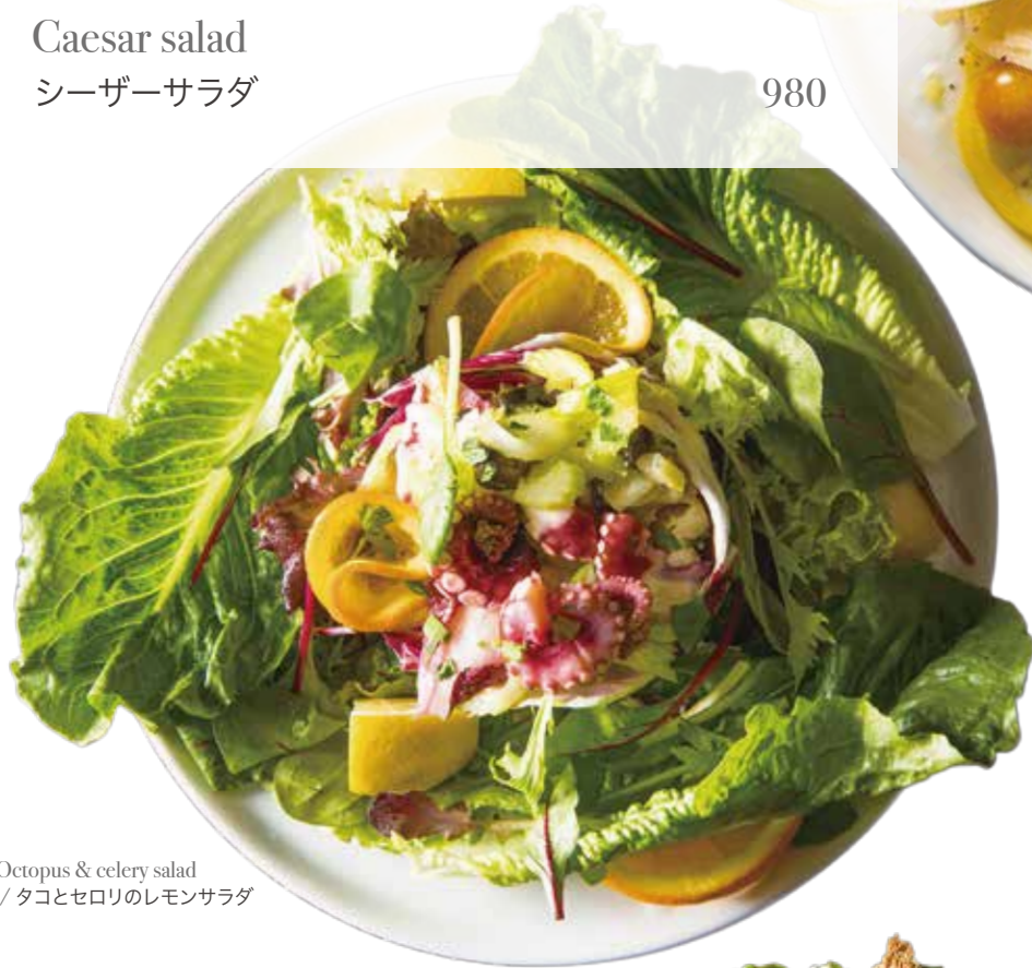
Octopus & celery salad / タコとセロリのレモンサラダ