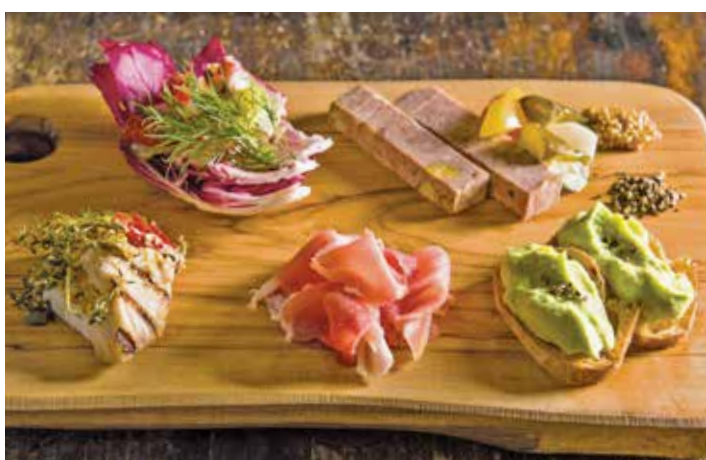
Assorted appetizer / アンティパストミスト

Assorted appetizer アンティパストミスト 2名様より承ります 1p. 680