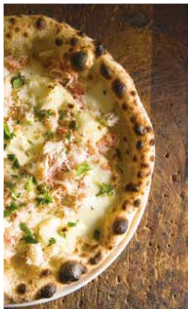
Crab & mascarpone pizza / 蟹とマスカルポーネのピッツァ