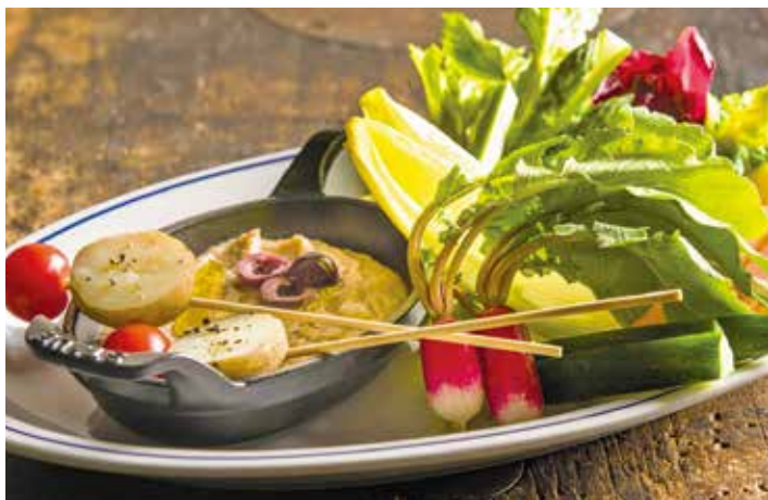
Seasonal vegetable bagna cauda / 旬の野菜のバーニャカウダ