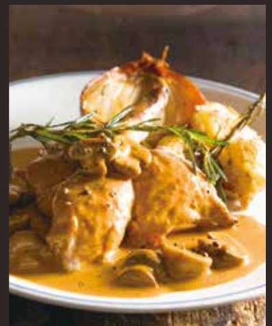
Sauteed chicken & mushroom / 鶏肉マッシュルームブラウンソースソテー