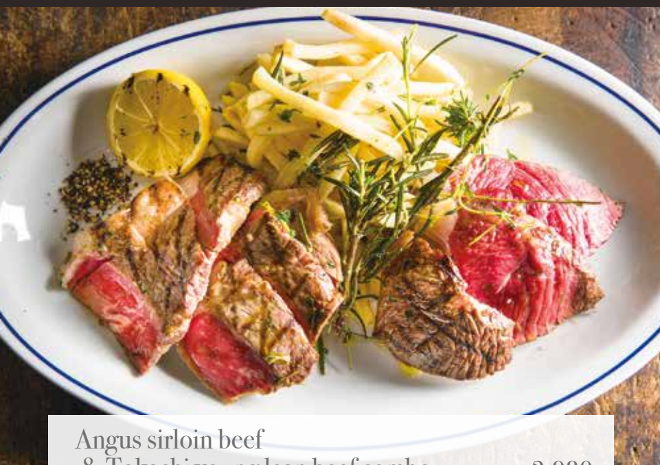
Angus sirloin beef & Tokachi young lean beef combo 2,980 アンガス牛サーロインと十勝若牛赤身の2種肉コンボ