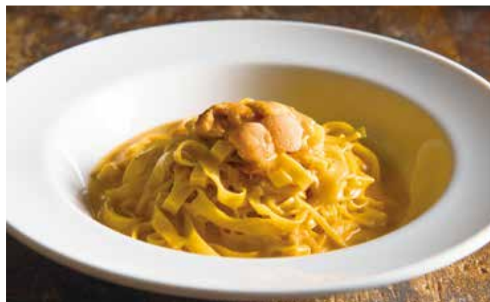
Homemade pasta with Uni cream sauce / 雲丹のクリームソース 手打ちパスタ

Sicilian bianco with tuna, anchovy & raisin 1,080 マグロ、アンチョビ、レーズンのシチリア風ビアンコ