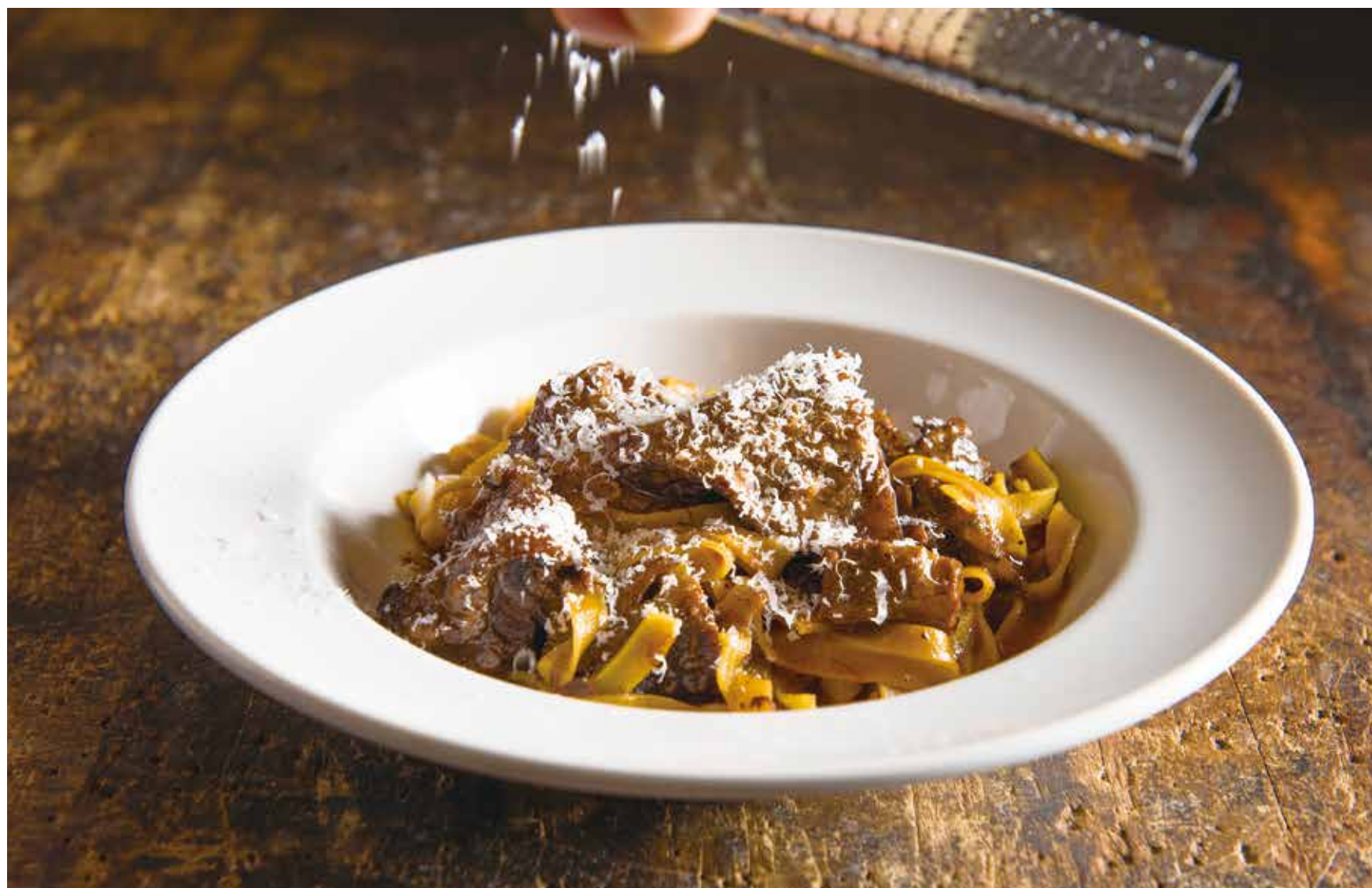
Homemade pasta with beef shank ragout sauce / 牛スネ肉のラグーソース 手打ちパスタ