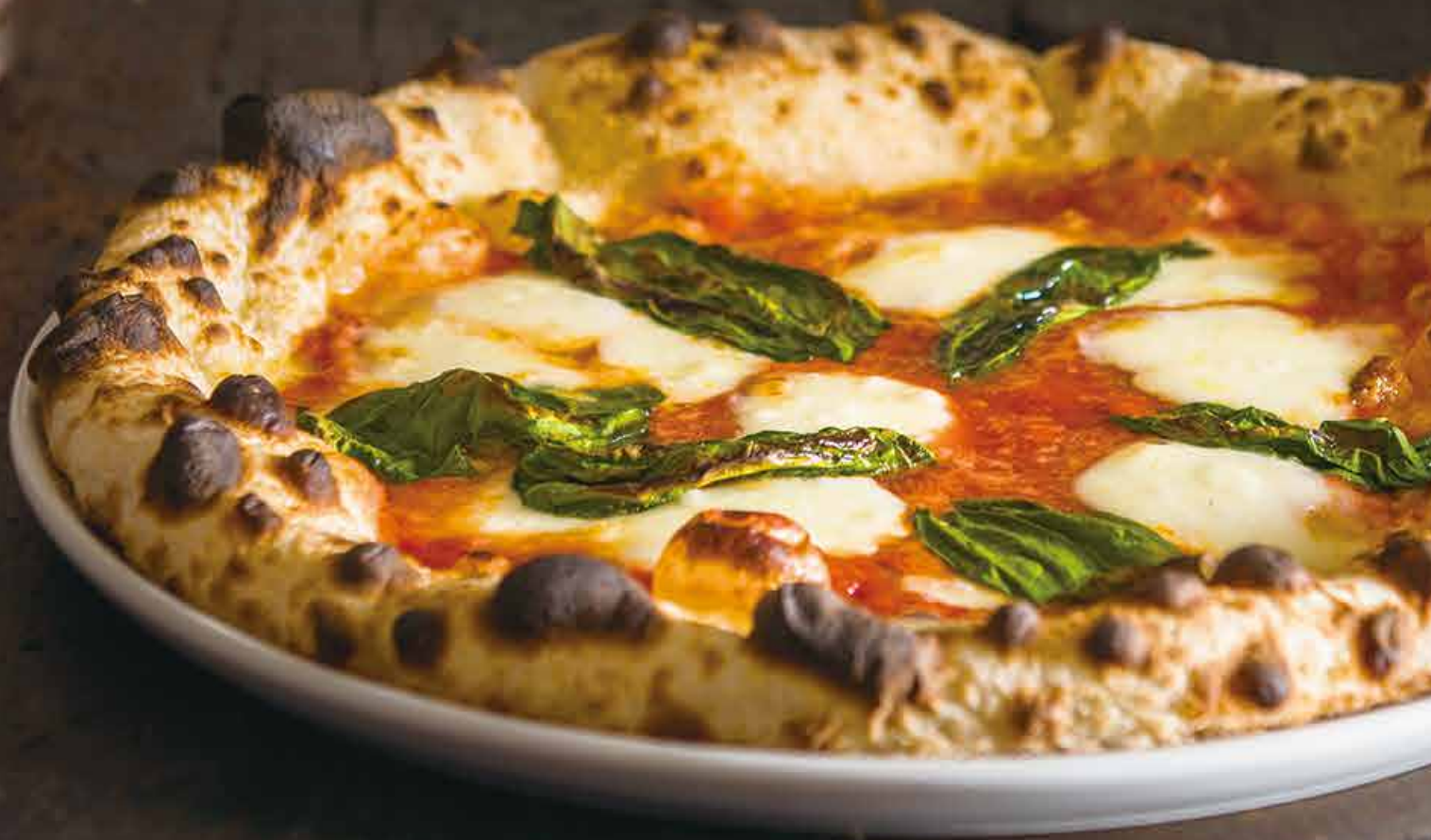
Margherita / マルゲリータ

Pizza is one of the few foods that almost everyone knows and loves around the world. It's cheesy, delicious, and just about everywhere.