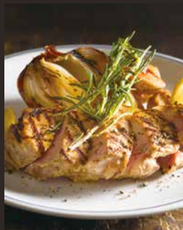
Grilled herbal pork / 豚肉の香草グリル