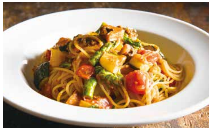
Seasonal vegetable ortolana / 旬の野菜のオルトラーナ