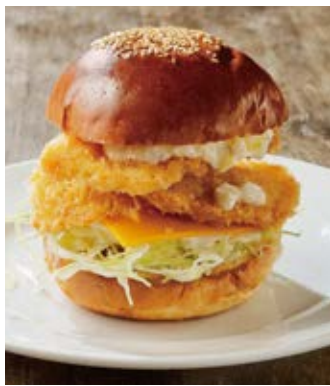
タルタルフィッシュバーガー Fish burger w/ tartar sauce