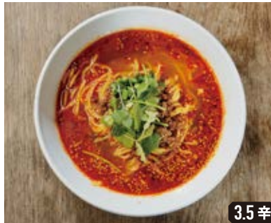
くれないマラー 紅麻辣担々麺 Red ma-la spicy dan dan soup noodles