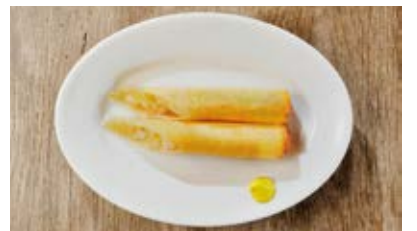
春巻 Spring rolls 390