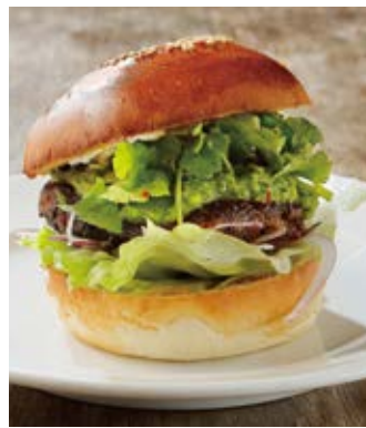
チャイニーズパクチーバーガー (+200) Chinese coriander burger