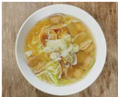
あさり葱塩麺 Clam & scallion soup noodles