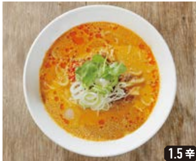
白ゴマ担々麺 White sesame dan dan soup noodles