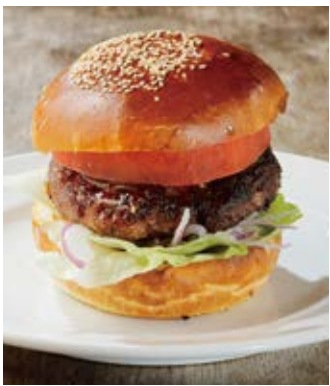
スタンダードバーガー Standard burger