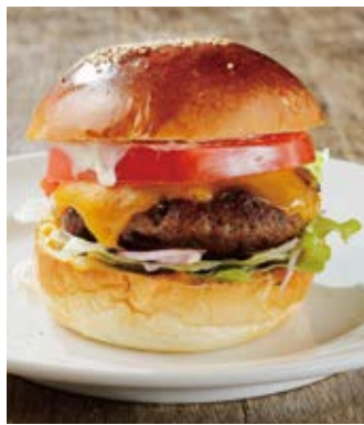
チーズバーガー (+200) Cheese burger