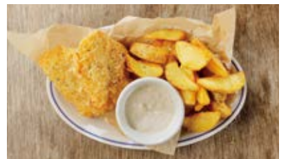
フィッシュ&チップス Fish & chips 800