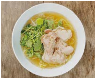
鶏パクチー麺 Chicken & coriander soup noodles