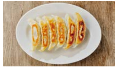
焼餃子 Pan-fried dumplings 390