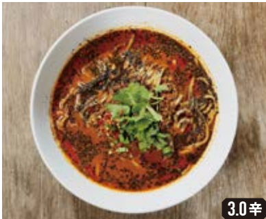
黒ゴマ担々麺 Black sesame dan dan soup noodles