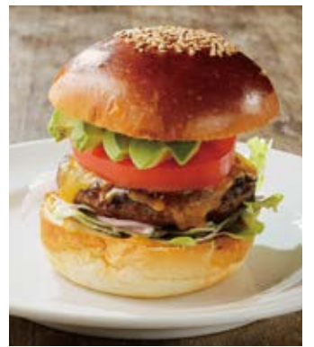
アボカドチーズバーガー (+300) Avocado cheese burger