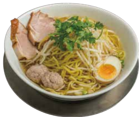
46. クエッティオナーム 790 タイの醤油ラーメン Thai style soy sauce noodle