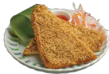
02. カノムパンナークン 580 エビトースト Deep-fried shrimp toast