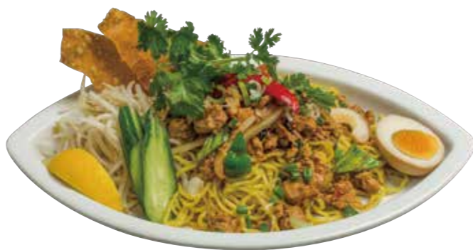
49. ガパオヘン 920 ガイガパオのせ油そば Soup-less noodle with minced chicken