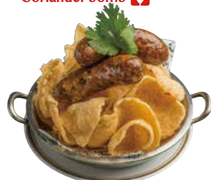
05. サイウア 880 チェンマイソーセージ Chang mai style herb sausages