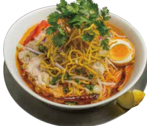
47. カオソイ 920 チェンマイのカレーラーメン Chang mai style curry noodle