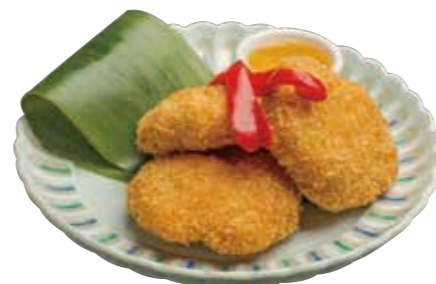
04. トードマンクン 680 エビのすり身揚げ Deep-fried shrimp cake (3p.)