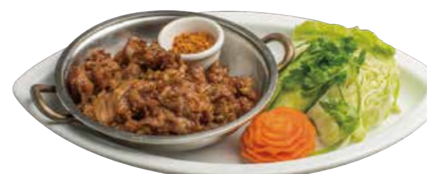
13. ラープムー 690 豚挽肉辛口ハーブあえ Spicy minced pork & herb