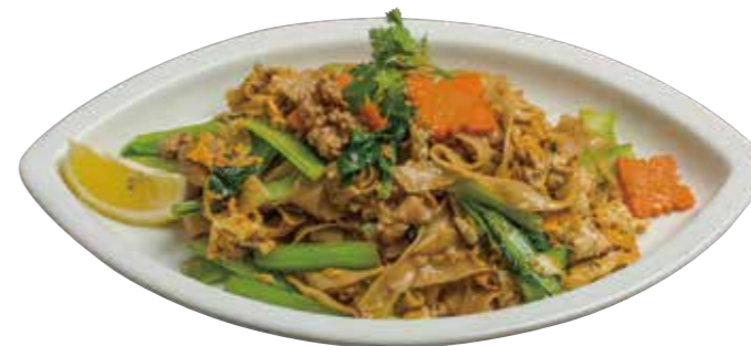
52. パッキーマオ 890 辛口太麺焼きビーフン Spicy fried thick rice noodles