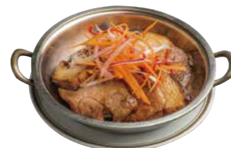
09. ムーデー 580 タイ焼豚の炙り焼き Grilled taste pork