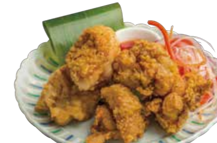
16. ガイトード 780 鶏モモから揚げ Deep-fried chicken