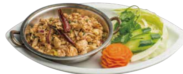
11. ラープガイ 690 鶏挽肉辛口ハーブあえ Spicy minced chicken & herb