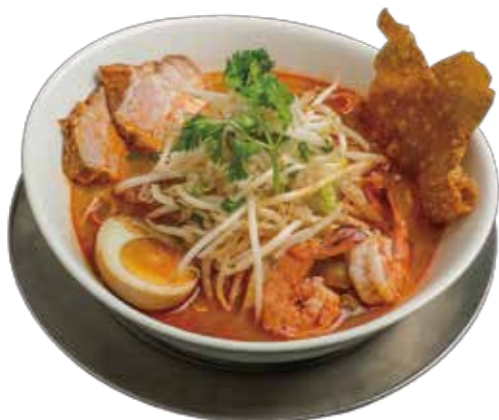
44. クエッティオトムヤムクン 980 トムヤムクンラーメン Tomyam noodle with shrimp