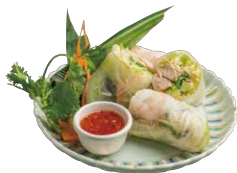
01. ポピアソツ 390 生春巻き Fresh spring roll (1p.)