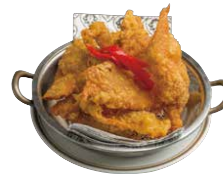
10. ナンガイトード 580 鶏皮揚げ Deep-fried chicken skin