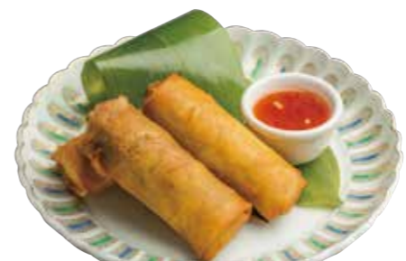
15. ポピアトード 590 タイの揚げ春巻き Deep-fried spring roll