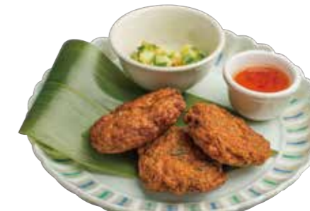
14. トードマンプラー 690 タイ風さつま揚げ Deep-fried fish cake (3p.)