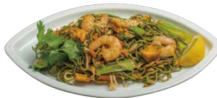
50. グリーンパッタイ 980 中華翡翠麵のパッタイ Fried chinese green noodles Thai style 店名と同じ名前のメニューです。米麺とは違ったパッタイが味わえます。