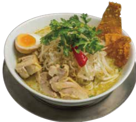
45. クエッティオゲンキョウ 920 グリーンカレーラーメン Green curry noodle