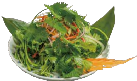
03. パクチークルックガディアム 450 パクチー爆弾 Coriander bomb