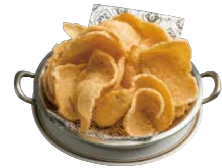
06. カオキャップクン 480 タイのエビせん Shrimp chips