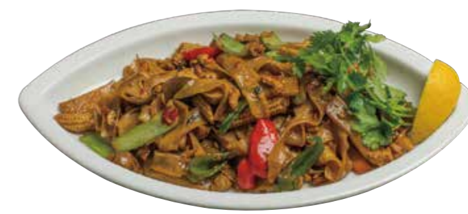
53. パッシーユー 890 太麺醤油の焼きビーフン Fried thick rice noodles with Thai soy sauce