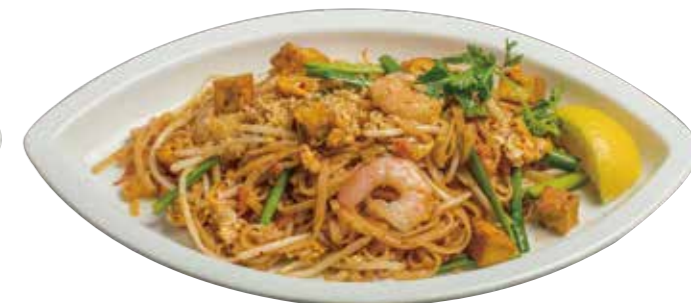
51. パッタイ 890 タイの焼きビーフン Fried rice noodles Thai style