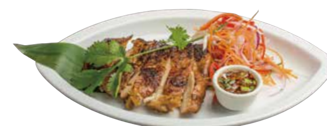
12. ガイヤーン 880 イサーン地方の鶏オープン香味焼き Grilled chicken Thai style