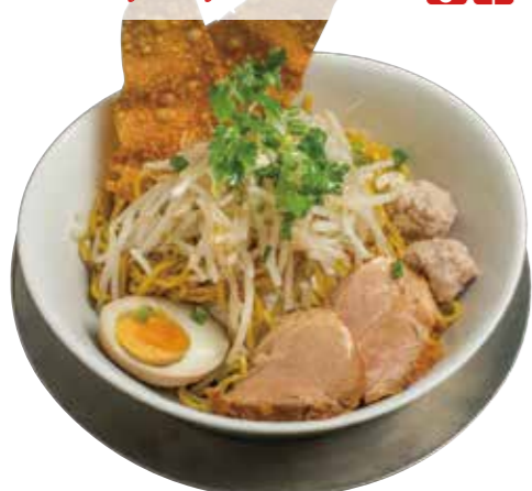
48. クエッティオヘン 920 タイの汁なし油そば Soup-less noodles with grilled pork