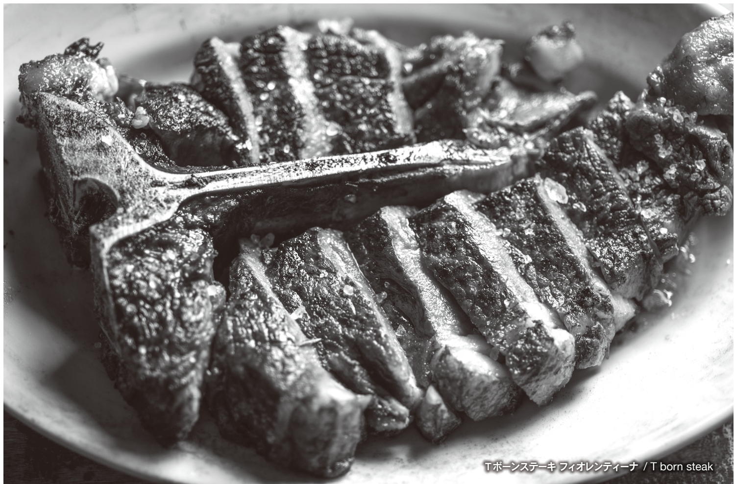
Tボーンステーキ フィオレンティーナ / T born steak