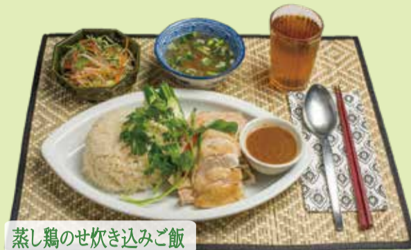
蒸し鶏のせ炊き込みご飯