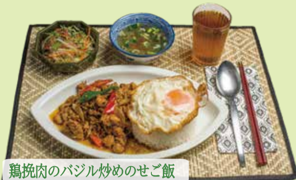
鶏挽肉のバジル炒めのせご飯