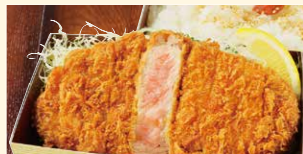
厚切りロースとんかつ弁当 Thick-cut loin cutlet Bento 厚切り脊猪排套餐便当 1,180円 (税込)