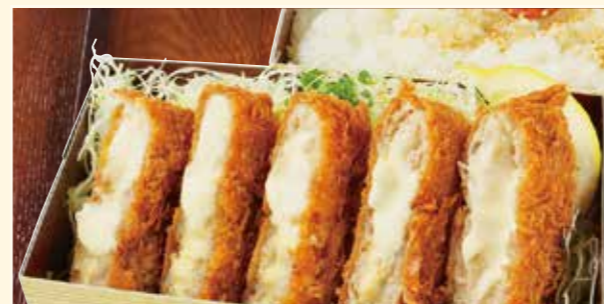
チーズバラとんかつ弁当 Pork belly mille-feuille cutlet Bento w/ cheese Bento / 炸五花肉芝士便当 1,080円 (税込)