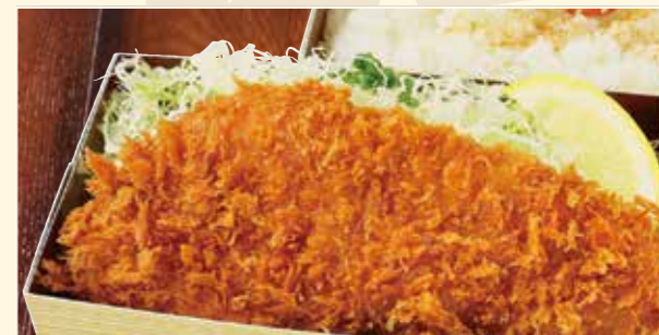
ロースとんかつ弁当 Loin cutlet Bento 炸里脊肉便当 950円 (税込)