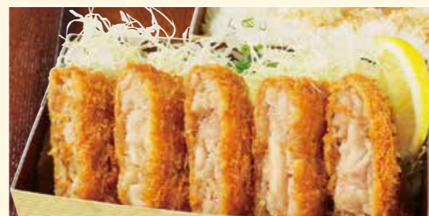
重ねバラとんかつ弁当 Pork belly mille-feuille cutlet Bento 炸五花肉便当 980円 (税込)