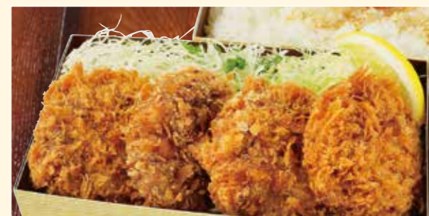
メンチカツ弁当 Minced pork meat cutlet Bento 炸肉饼便当 950円 (税込)