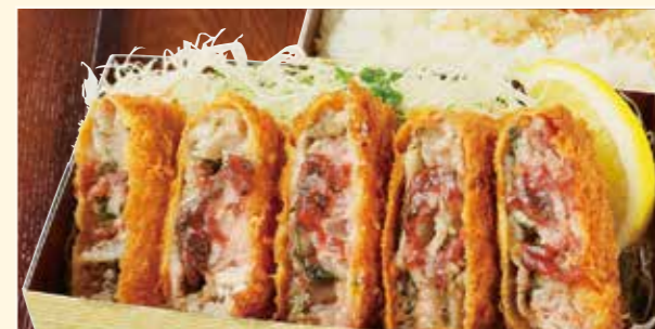
梅しそバラとんかつ弁当 Pork belly mille-feuille cutlet Bento w/ plum Bento / 炸五花肉紫苏梅便当 1,080円 (税込)