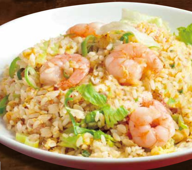
Seafood lettuce fried rice 蝦仁炒飯