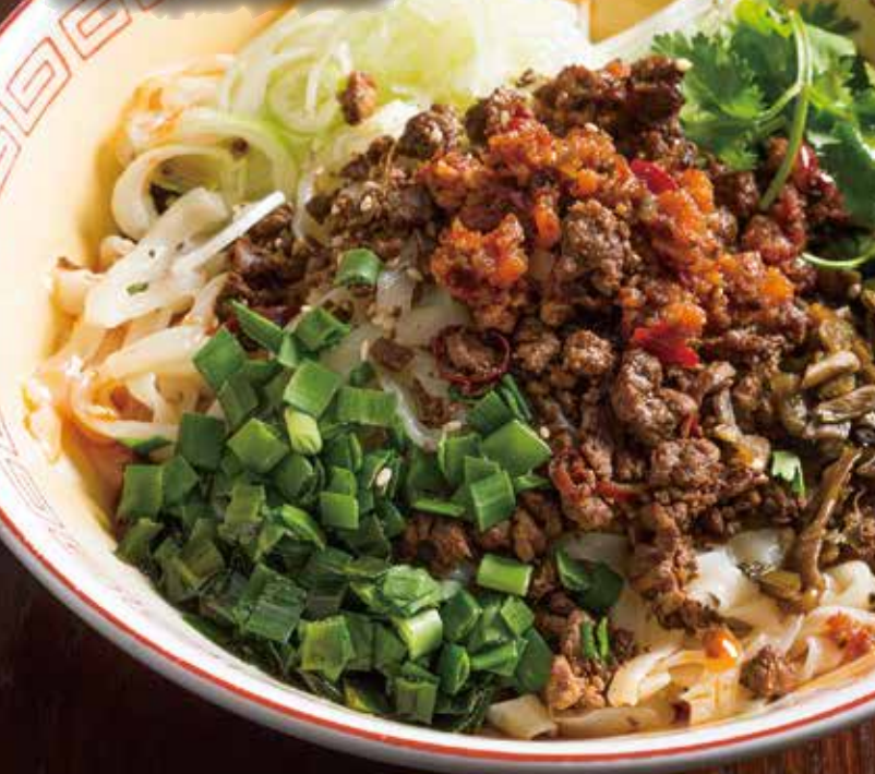
Sichuan style dan dan tossed noodles 四川成都担担面