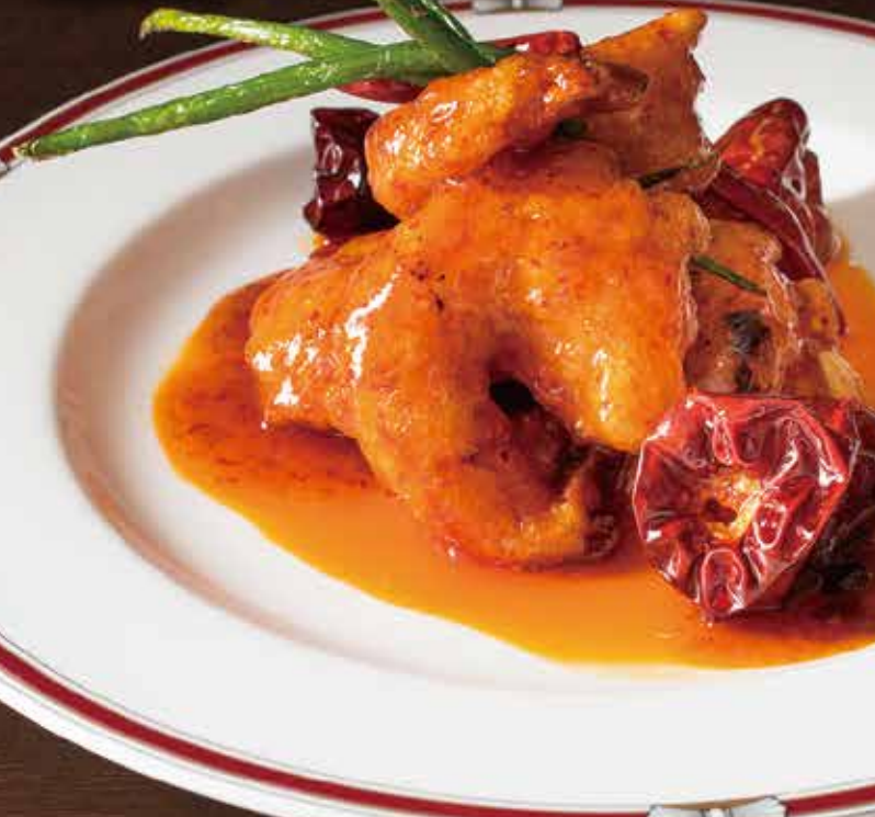
Sweet & sour pork