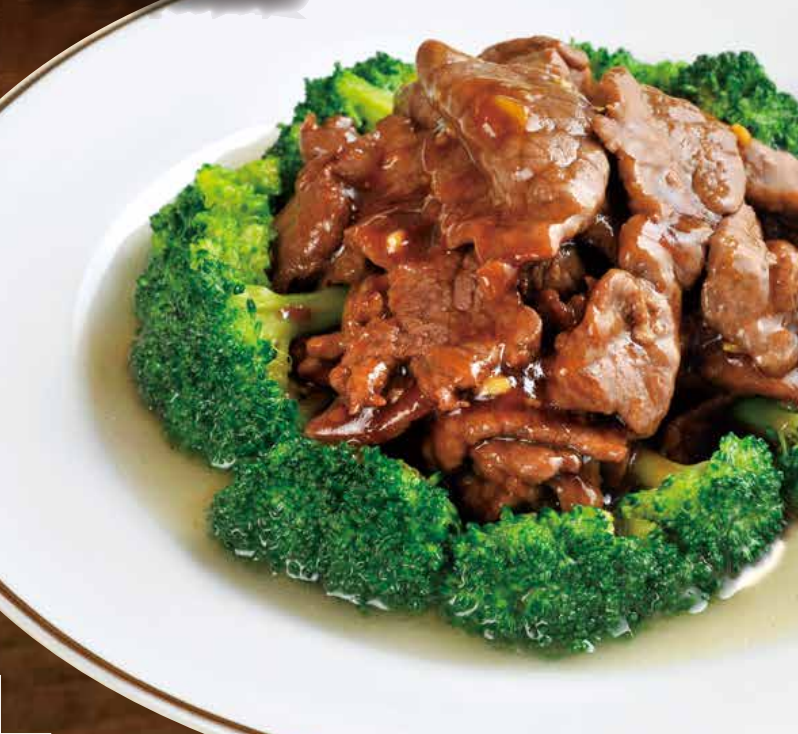
Chili oil beef