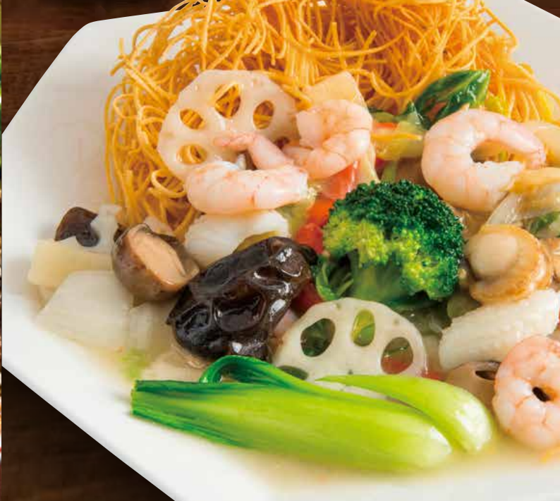
Seafood thick sauce on crispy fried noodles 海鮮燴面