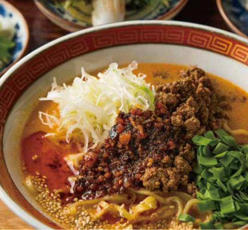
White sesame dandan noodles 白芝麻担担面