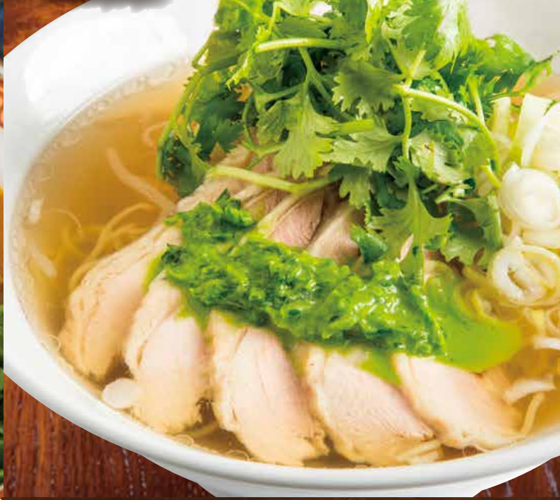
Chicken & coriander soup noodles 香菜雞麵