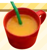
お子様ジュース (オレンジ) 100円+税