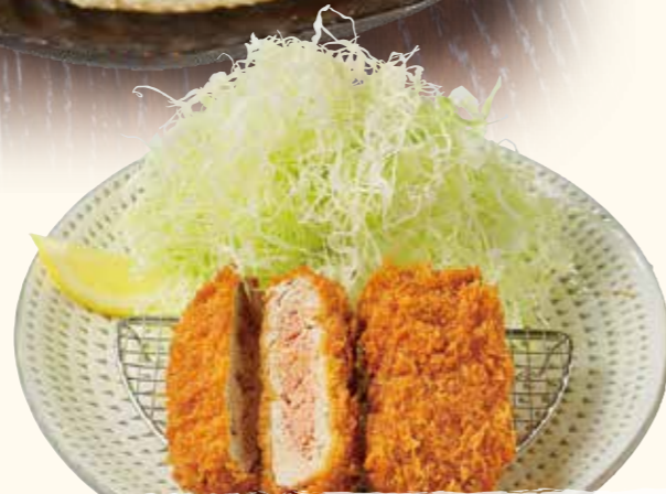
瑞穂のいも豚 ヒしとんかつ