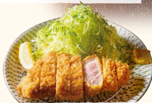
瑞穂のいも豚 厚切りロースとんかつ