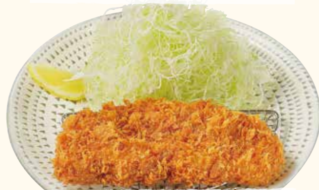
瑞穂のいも豚 ロースとんかつ