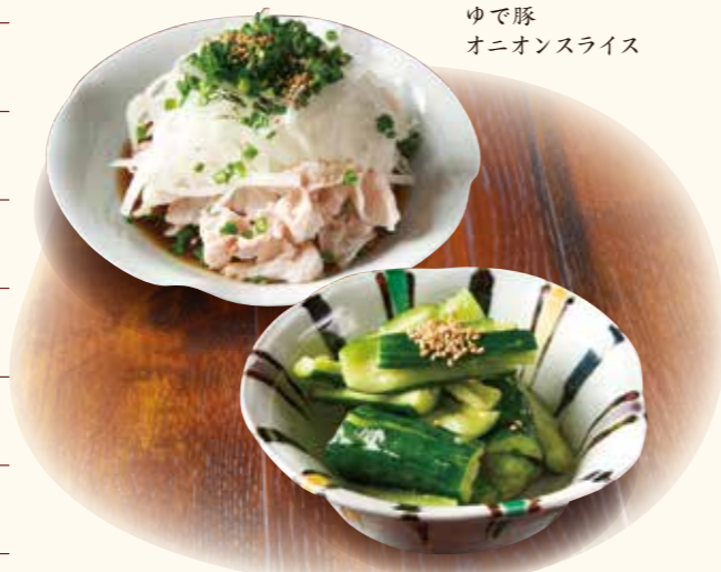
ゆで豚 オニオンライス