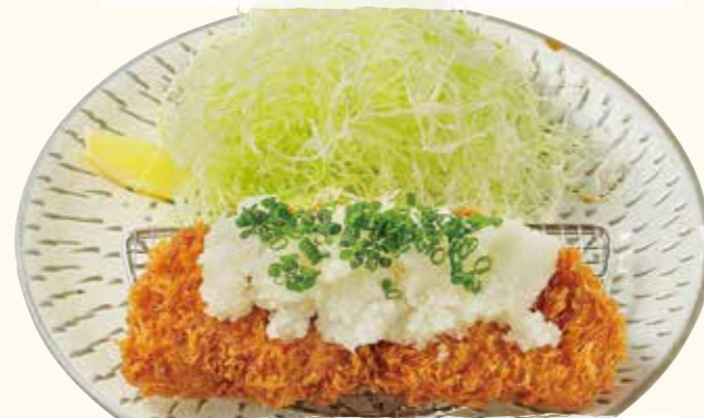
瑞穂のいも豚 おろしロースとんかつ

Mizuho imo-pork loin cutlet w/ grated radish