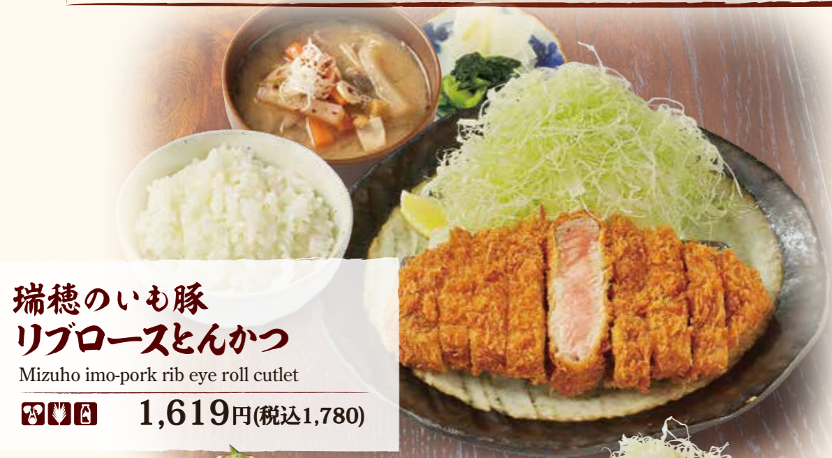
瑞穂のいも豚 リブローズとんかつ