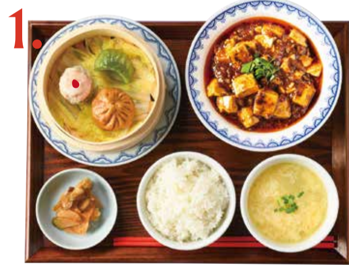
1. 麻婆豆腐点心定食 880 (税込 968) Stewed spicy tofu & minced pork & dimsum set 麻婆豆腐點心套餐 사천마파두부 만두 세트