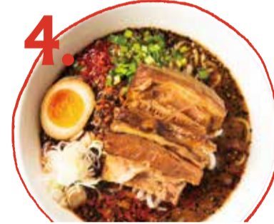
4. 牛バラ担々麺 1180 (税込 1298) Beef rib dan dan soup noodles 牛肋骨擔擔麵 소 삼겹살 担担麵