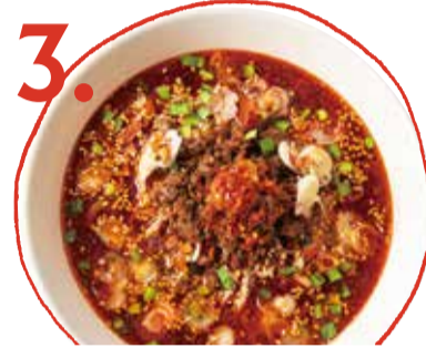
3. 紅麻辣担々麺 800 (税込 880) Hot & spicy dan dan soup noodles 紅麻辣擔擔麵 매운맛担担麵