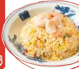
エビ五目炒飯 880 (税込 968) Shrimp fried rice 鮮蝦炒飯 새우 볶음밥