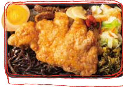
豚ロースのせ弁当 980 (税込 1078) Pork Loin Bento box 猪里脊便當 돼지 등심 도시락