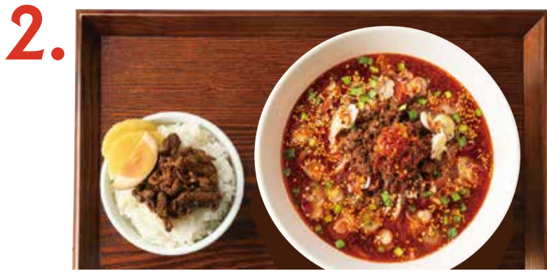
2. 選べる担々麺と魯肉飯セット Dan dan soup noodles & minced pork rice set 擔擔麵魯肉飯套餐 担担麵 魯肉飯 세트 ○○○○○○○○ お好きな担々麺 +280 (税込 308)