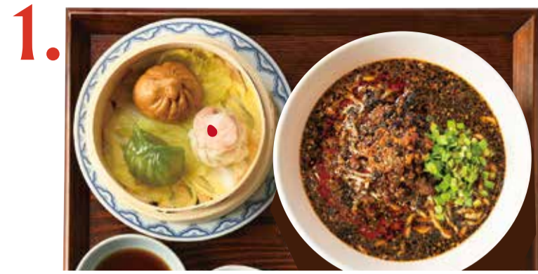
1. 選べる担々麺と点心セット Dan dan soup noodles & dimsum set 擔擔麵點心套餐 担担麵 만두 세트 ○○○○○○○○ お好きな担々麺 +300 (税込 330)