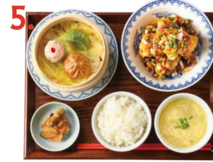
5. 油淋鶏点心定食 980 (税込 1078) Deep-fried chicken with condiment sauce & dimsum set 油淋雞點心套餐 중국식 닭튀김 만두 세트