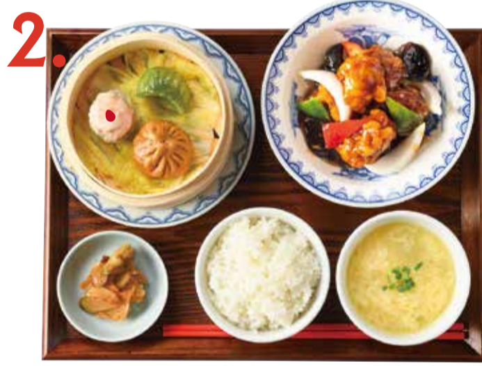
2. 鶏甘酢炒め点心定食 980 (税込 1078) Stir-fried sweet & sour chicken & dimsum set 糖醋炒雞肉點心套餐 닭고기 감식초 볶음 만두 세트