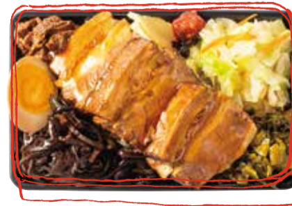
牛バラ煮込みのせ弁当 1180 (税込 1298) Rib Bento box 牛肋骨便當 소 삼겹살 도시락