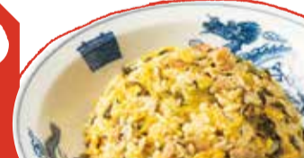
高菜ザーサイ炒飯 700 (税込 770) Leaf mustard & pork fried rice 芥菜豬肉炒飯 갓 돼지고기 볶음밥