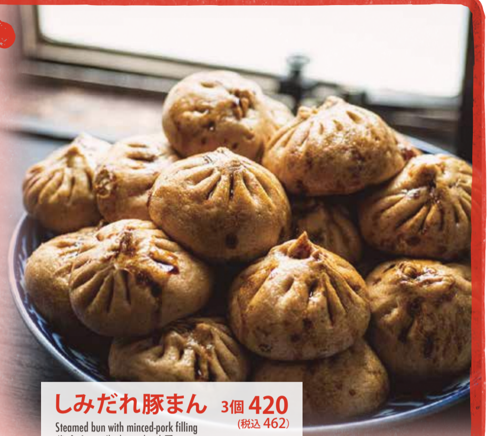
しみだれ豚まん 3個 420 (税込 462) Steamed bun with minced-pork filling 猪肉包 돼지고기 만두