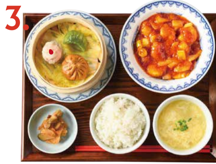
3. エビチリ点心定食 1180 (税込 1298) Stir-fried shrimp with chili sauce & dimsum set 干燒蝦仁點心套餐 새우칠리소스 만두 세트