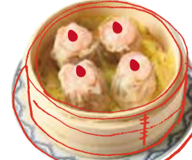
海老焼売 4個 490 (税込 539) Steamed shrimp shumai dumplings 蝦燒賣 새우슈마이