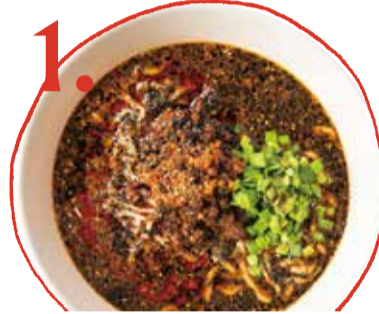
1. 黒ごま担々麺 700 (税込 770) Black sesame dan dan soup noodles 黑芝麻擔擔麵 鹹鮮担担麵