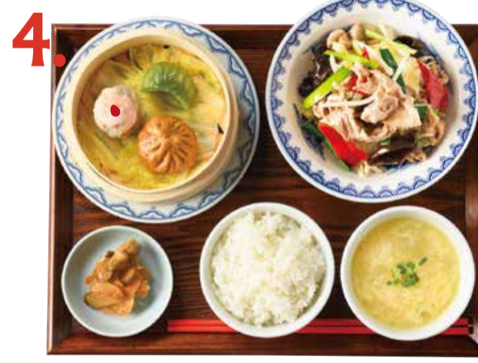
4. 豚野菜炒め点心定食 980 (税込 1078) Stir-fried pork with vegetable & dimsum set 蔬菜炒豬肉點心套餐 돼지고기 야채 볶음 만두 세트