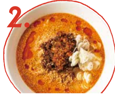
2. 白ごま担々麺 700 (税込 770) White sesame dan dan soup noodles 白芝麻擔擔麵 鹹鮮担担麵