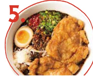
5. 豚ロースのせ担々麺 1180 (税込 1298) Pork loin dan dan soup noodles 猪里脊擔擔麵 돼지 등심 担担麵