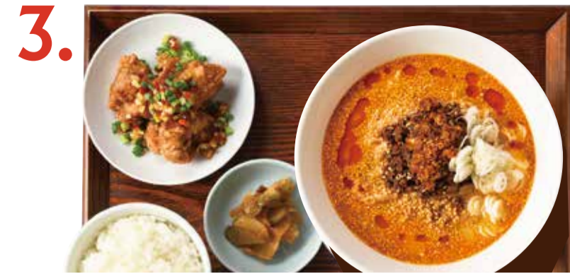
3. 選べる担々麺と油淋鶏セット Dan dan soup noodles & deep-fried chicken with condiment sauce set 擔擔麵油淋雞套餐 担担麵 油淋雞 세트 ○○○○○○○○ お好きな担々麺 +380 (税込 418)