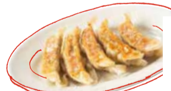
やみつぎ餃子 5個 400 (税込 440) Pan-fried yamitsuki dumplings 鍋貼 군만두