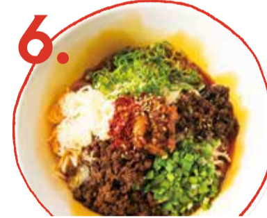
6. 汁無し担々麺 800 (税込 880) Soup-less dan dan noodles 乾拌擔擔麵 시루나시 担担麵