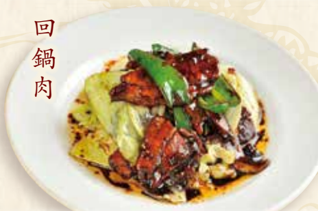
豚肉キャベツ味噌炒め