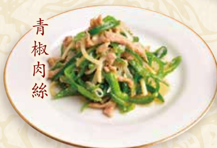
ピーマン豚肉細切り炒め