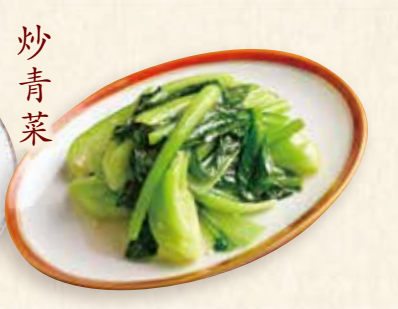
青菜にんにく塩炒め