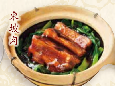
豚角煮トンポーロウ