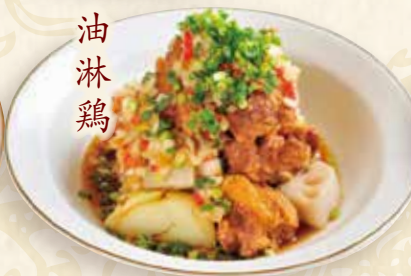
揚げ鶏の香味だれ