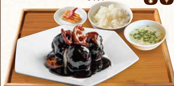
定食セットイメージ

当店ではアレルギー特定原材料7品目を含むすべての食材を同一の環境で調理しております。使用している麺類は全てそば粉を使用した製品と同一の環境で製造しております。ご注文の際には、お客様ご自身で慎重にご判断下さい。写真はイメージです。