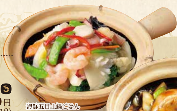
海鮮五目土鍋ごはん