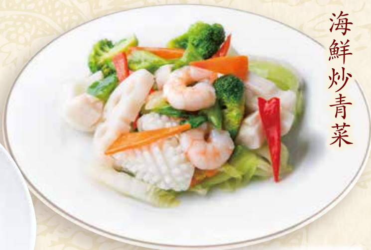
海鮮彩り野菜炒め