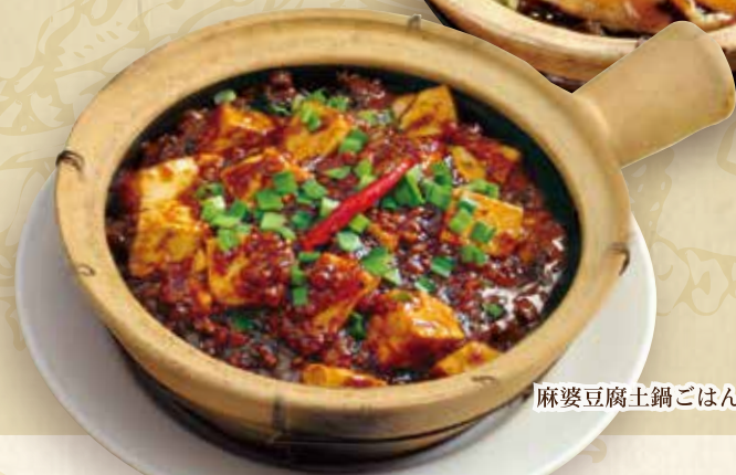
麻婆豆腐土鍋ごはん