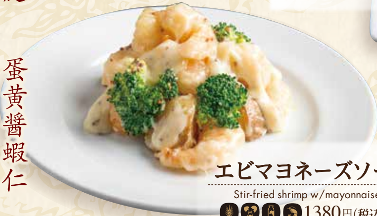
エビマヨネーズソース