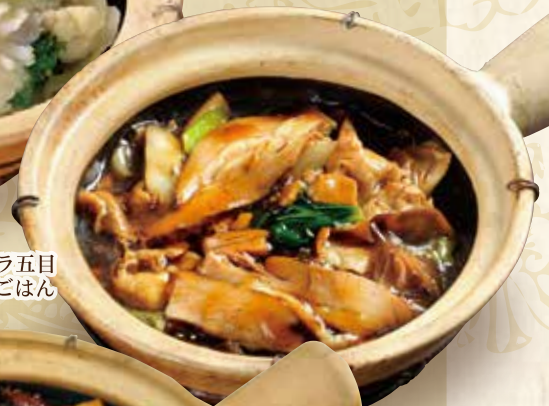
豚バラ五目土鍋ごはん