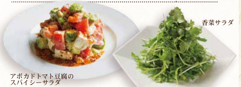
アボカドトマト豆腐のスパイシーサラダ