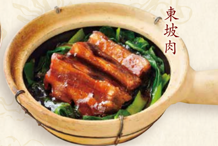
豚角煮トンポーロウ