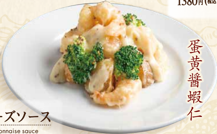
エビマヨネーズソース