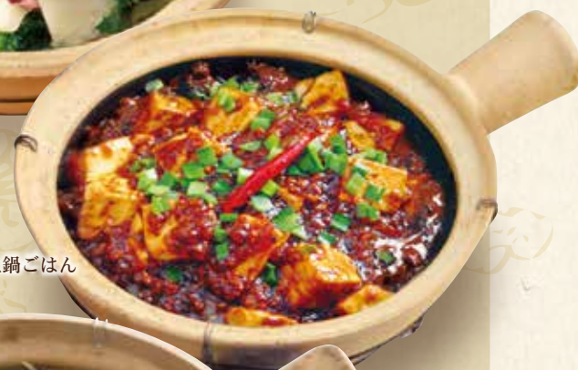
麻婆豆腐土鍋ごはん