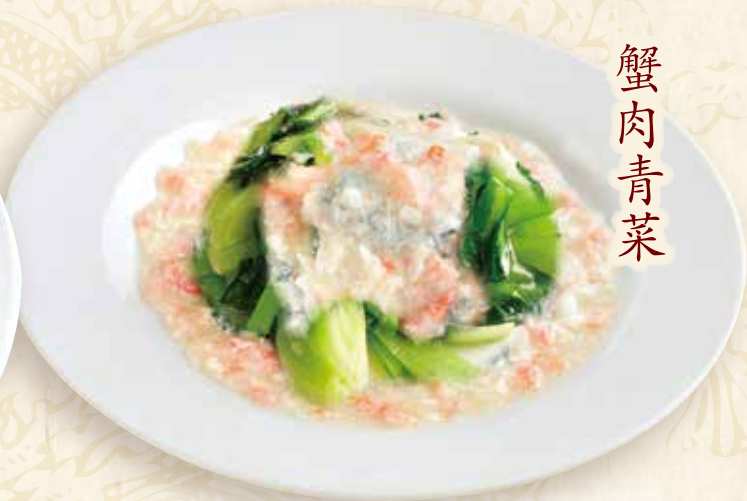
中国青菜、蟹肉あんかけ

Stir-fried Chinese green leaves over crab sauce