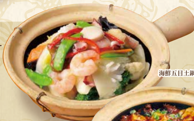
海鮮五目土鍋ごはん