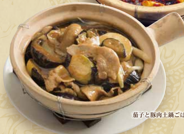
茄子と豚肉土鍋ごはん

当店ではアレルギー特定原材料7品目を含むすべての食材を同一の環境で調理しております。使用している麺類はそば粉を使用した製品と同一の環境で製造しております。ご注文の際には、お客様ご自身で慎重にご判断下さい。写真はイメージです。