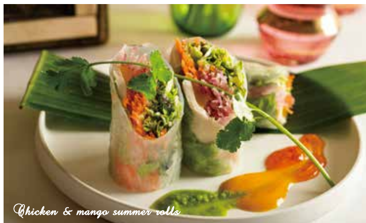
Chicken & mango summer rolls