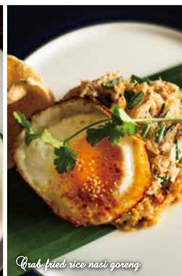
Crab fried rice nasi goreng