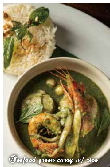
Seafood green curry w/ rice