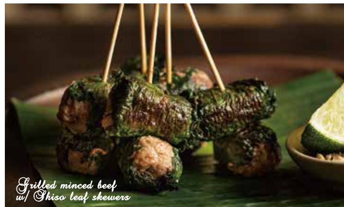
Grilled minced beef w/ Shiso leaf skewers