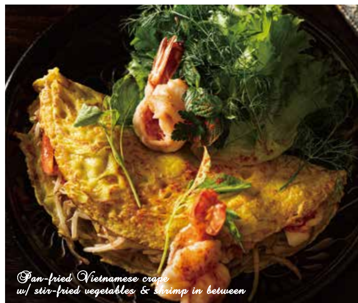
Pan-fried Vietnamese crape w/ stir-fried vegetables & shrimp in between