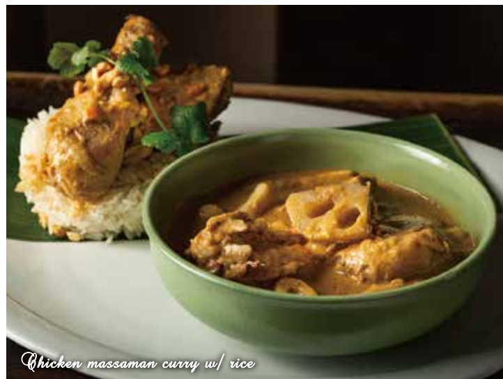
Chicken massaman curry w/ rice