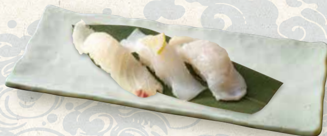
塩握り三種(鯛、いか、たこ)

3 kinds of sushi from Hokkaido 980 三种北海道出产寿司