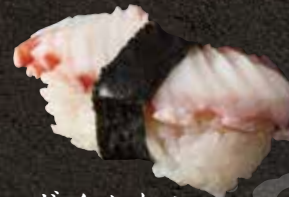
ボイルたこ 200 Boiled octopus 水煮章鱼