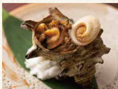
サザエ焼 980 Grilled turbo shellfish 荣螺烧