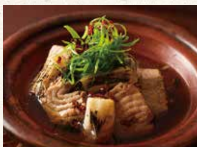
葱鮪小鍋 880 Simmered leek & tuna 葱金枪鱼火锅