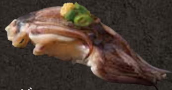
ゲン 100 Squid tentacles 墨鱼腿