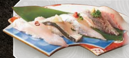
白身五種 1,480 (その日入荷の五種) 5 kinds of white fish 五种白色肉鱼