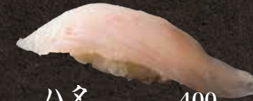
ハタ 400 Grouper 石斑鱼