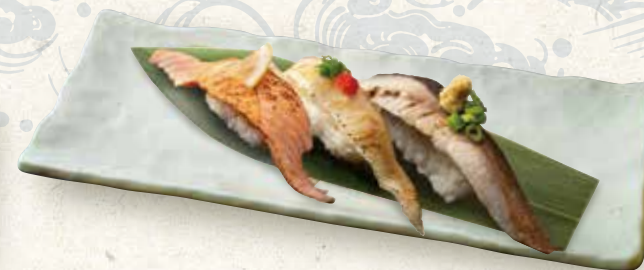
炙り三種(サーモン、えんがわ、鯖)