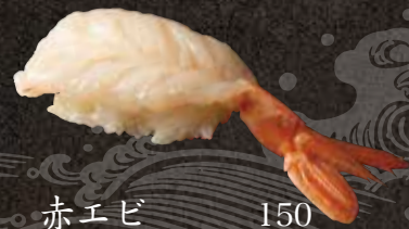
赤エビ 150 Whiskered velvet shrimp 红虾