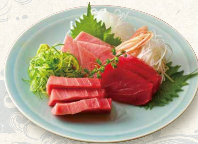
まぐろ三種刺し盛り Assorted 3 kinds of tuna Sashimi 2,500 三種金枪鱼生鱼片