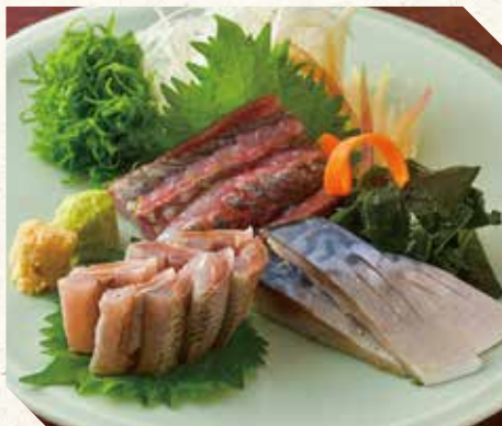
光り物三種刺し盛 1,500 3 kinds of silver-skin fish 三种发光鱼