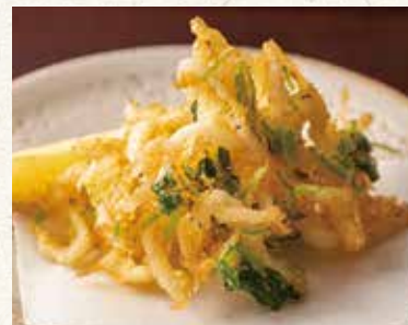
白魚かき揚げ 700 White fish tempura 银鱼天妇罗