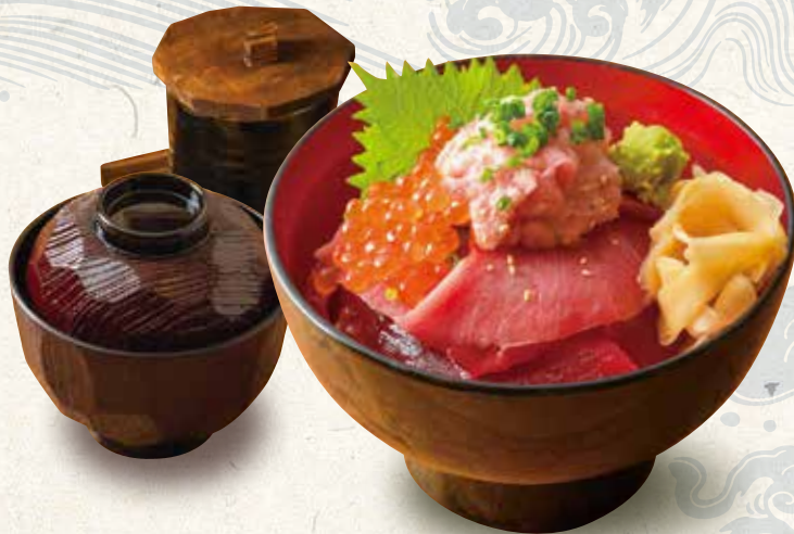
まぐろ丼 茶碗蒸し、味噌汁付き Donburi bowl of rice topped with tuna 1,800 金枪鱼盖饭