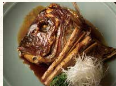
鯛かぶと煮 680 Simmered head of sea bream 煮鯛鱼头