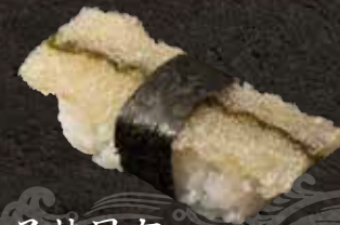
子持昆布 330 Kelp with herring roe attached 鱼籽昆布