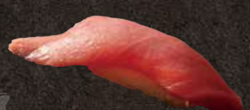
中トロ 600 Medium fatty tuna 中肥金枪鱼