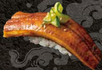
鰻 330 Eel 扇贝