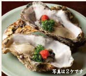
生カキ 1ヶ 680 Raw oysters 生牡蛎

Assorted sashimi (イ) 3,800 刺身什錦拼盘 (ロ) 2,200 写真はイメージです