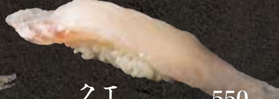
クエ 550 Kelp bass 褐带石斑鱼