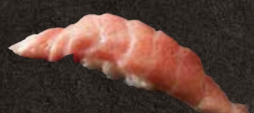
大トロ 900 Very fatty tuna 上肥金枪鱼