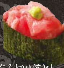
まぐろ切り落とし 500