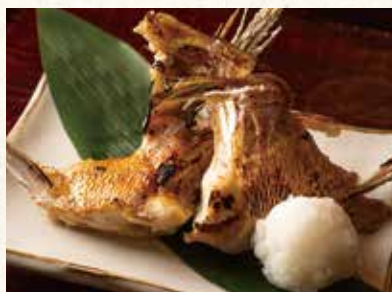
カマ焼西京漬け 780 Broiled collars of sea bream 烤鯛鱼下巴