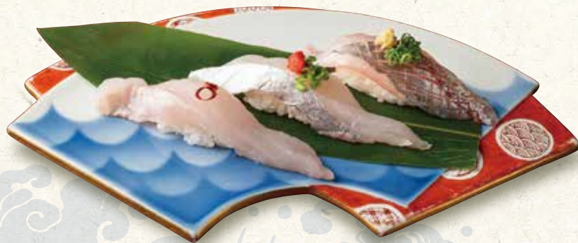
白身三種(その日入荷の三種)