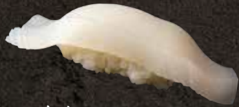
イカ 150 Squid 乌贼