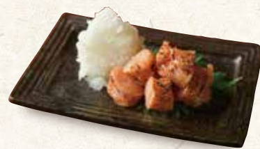
炙り明太子 580 Seared spicy pollack roe 炙烤明太子