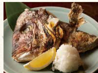
鯛かぶと焼 680 Roasted seabream head 烤鯛鱼头