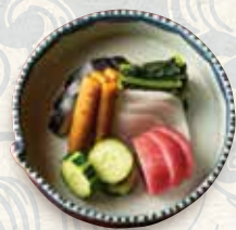
漬物盛り 600 Assorted pickles 腌菜什锦拼盘