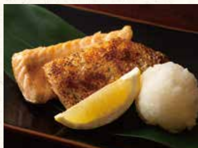
ハラス焼 600 Grilled salmon bell 片烤三文鱼