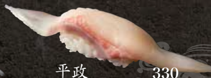
平政 330 Yellowtail amberjack 黄尾鰺鱼