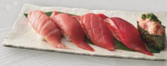
鮪五種 2,200 (大トロ、中トロ、赤身、 びん長またはづけ鮪、葱トロ軍艦) 5 kinds of tuna 五种金枪鱼

・一貫から承ります。 ・その日入荷のネタ、季節のネタ ございます。係の者にお尋ねください。