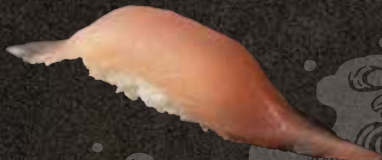
びん長 150 Albacore tuna 长鳍金枪鱼