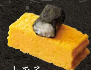
大玉子 200 Big egg 大的煎烤鸡蛋