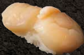
帆立 350 Scallop 扇贝