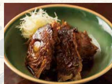
アラ煮 680 Boiled fish bones 煮鱼杂