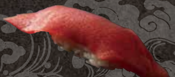
赤身 330 Tuna red meat 金枪鱼红肉