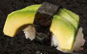
アボカド 150 Avocado 鳄梨