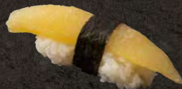
数の子 300 Herring roe 鲱鱼籽