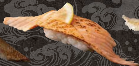
炙りサーモン 220 Seared salmon 炙烤三文鱼