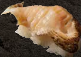
つぶ貝 500 Whelks 螺