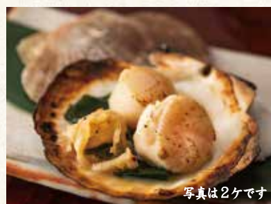
帆立焼 1ヶ 780 Grilled scallop 扇贝烧