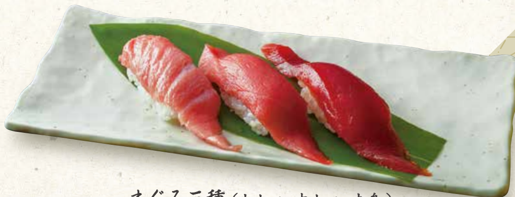
まぐろ三種(大トロ、中トロ、赤身)