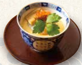
海鮮茶碗蒸し 800 Steamed egg custard 茶碗蒸