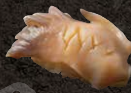
ホッキ 400 Sakhalin clam 北极贝