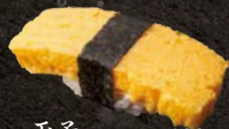
玉子 100 Egg 煎烤鸡蛋