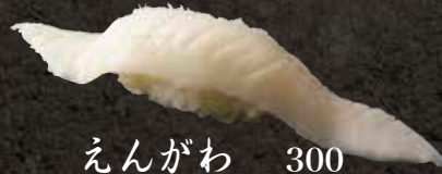
えんがわ 300 Meat at the base of a fin 鱼鳍肉