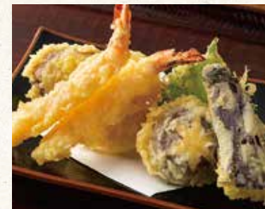
天ぷら盛り 1,280 Assorted tempura 天妇罗拼盘