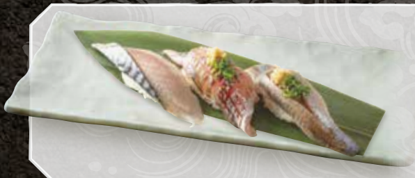
光り三種 550 (鯖、鰯、鰯) 3 kinds of silver-skin fish 三种发光鱼