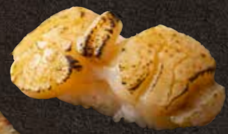
炙り帆立 350 Seared scallop 炙烤扇贝