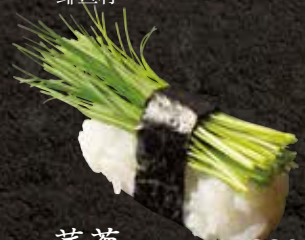
芽葱 220 Menegi young green onions 芽葱