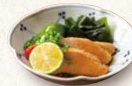
アン肝ポン酢 680 Monkfish liver 安康鱼肝