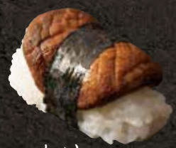
しいたけ 200 Shiitake mushrooms 香菇