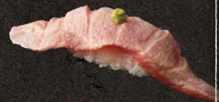
炙りトロ 600 Seared medium fatty tuna 炙烤中肥金枪鱼