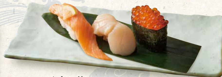
北海三種(サーモン、帆立、いくら)

3 kinds of sushi from Hokkaido 980 三种北海道出产寿司