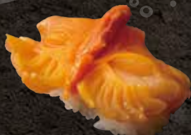
赤貝 500 Ark shell 北极贝