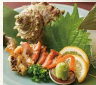
サザエ刺し 980 Turbo shellfish sashimi 荣螺