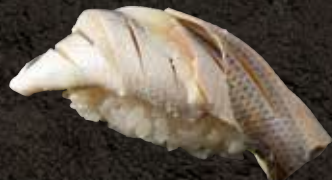
こはだ 100 Medium gizzard shad 窝斑鲮幼鱼