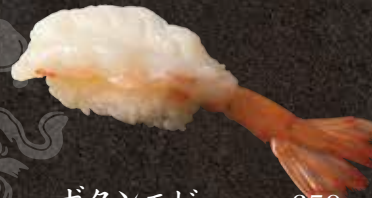
ボタンエビ 650 Sweet shrimp 牡丹虾