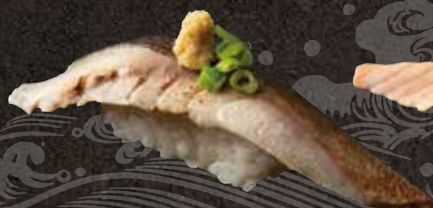
炙り鯖 150 Seared mackerel 炙烤青花鱼