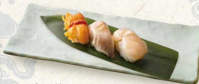
貝三種(赤貝、ホッキ貝、帆立)