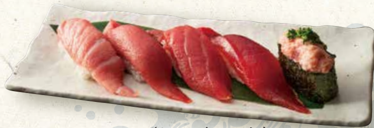
まぐろ五種 (大トロ、中トロ、赤身、びん長またはづけ鮪、葱トロ軍艦) 5 kinds of tuna 五种金枪鱼 2,200

稚魚から大切に育てられた、こだわりの本まぐろ、どこを切っても適度な脂が乗って美味しいことから「金太郎まぐろ」と名づけられました。当店では、天然にも負けずとも劣らない「金太郎まぐろ」を直接仕入れております。鮮度抜群の金太郎まぐろの旨みを味わってください。