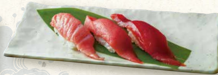
まぐろ三種 (大トロ、中トロ、赤身) 3 kinds of tuna 三種金枪鱼 1,700