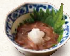
いか塩辛 480 Salted squid viscera 咸乌贼鱼