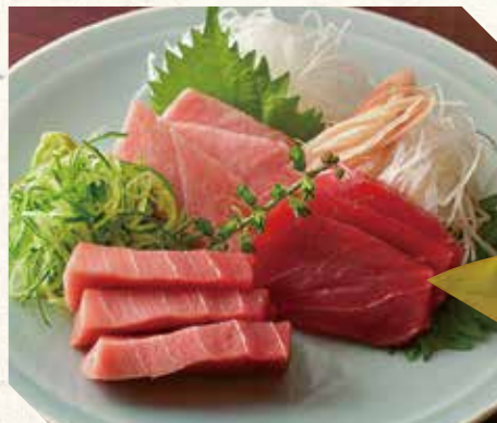
鮪三種刺し盛り 2,500 3 kinds of tuna sashimi 三种金枪鱼