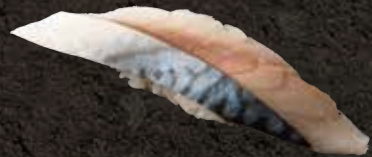
メサバ 150 Vinegared mackerel 醋腌青花鱼