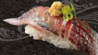
アジ 250 Horse mackerel 竹荚鱼