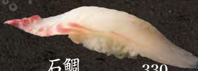
石鯛 330 Striped beakfish 条石鯛