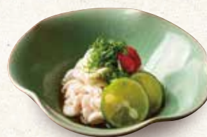
白子ポン酢 680 Milt with ponzu 鱼白橘子酱汁