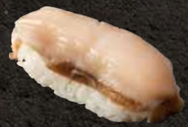
鮑 770 Abalone 鲍鱼