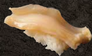
白みる貝 400 Geoduck clam 象拔蚌