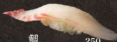
鯛 250 Sea bream 鯛鱼