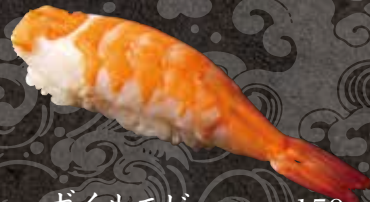
ボイルエビ 150 Boiled shrimp 水煮虾