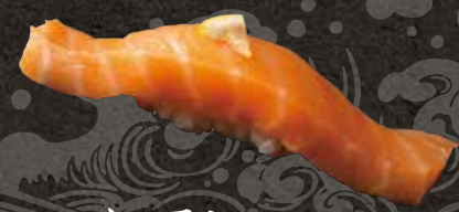
サーモン 220 Salmon 鲑鱼