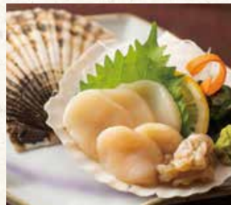
帆立刺し 780 Scallop sashimi 扇贝