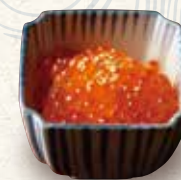
イクラおろし 680 Salmon roe & grated radish 萝卜泥拌鲑鱼籽