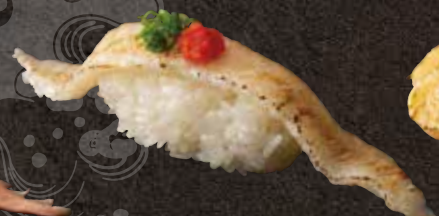
炙りエンガワ 300 Seared fluke fin 炙烤鱼鳍肉