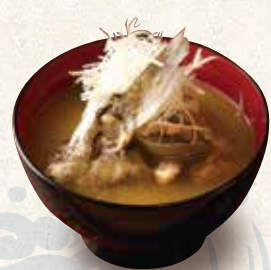
アラ汁 450 Fish-bone stock soup 鱼杂汤