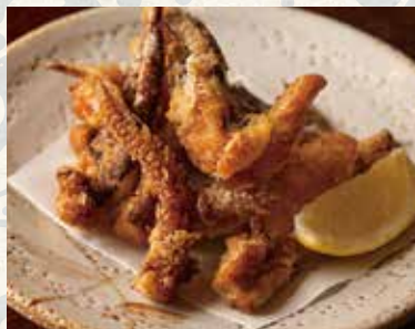
ゲン唐揚 580 Deep-fried squid tentacles 墨鱼腿唐扬炸