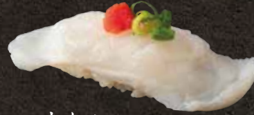
生たこ 300 Raw octopus 生章鱼