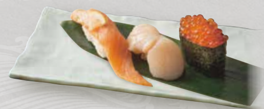
北海三種 980 (サーモン、帆立、いくら) 3 kinds of sushi from Hokkaido 三种北海道出产寿司