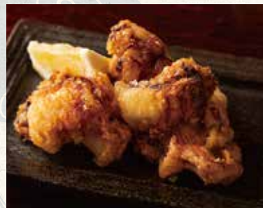
タコ唐揚 780 deep-fried octopus 章鱼唐扬炸