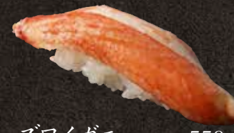
ズワイガニ 550 Snow crabs 雪蟹