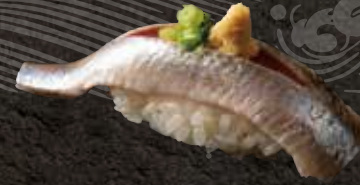
イワシ 200 Sardine 沙丁鱼