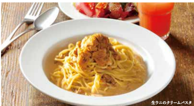
生ウニのクリームパスタ