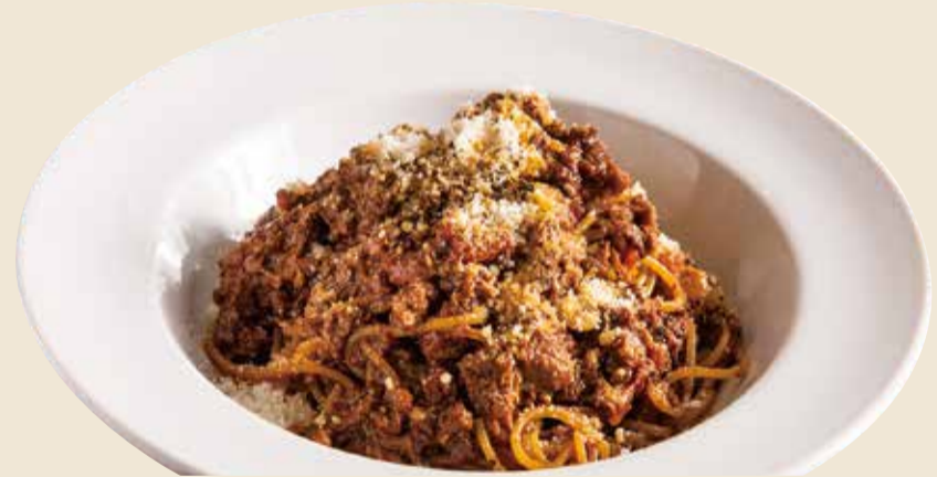
黒毛和牛のボロネーゼ