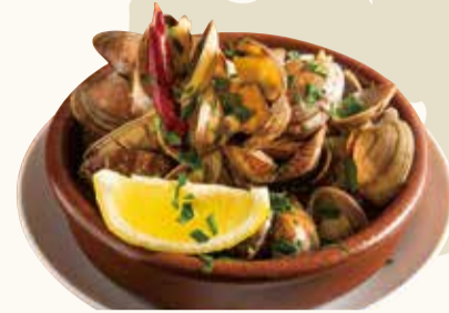
アサリ白ワイン蒸し Steamed asari clam in white wine