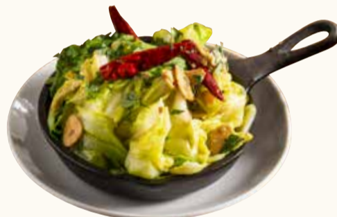
アンチョビーキャベツ Anchovy & cabbage