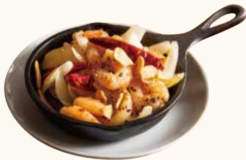
海老アヒージョ Shrimp ajillo