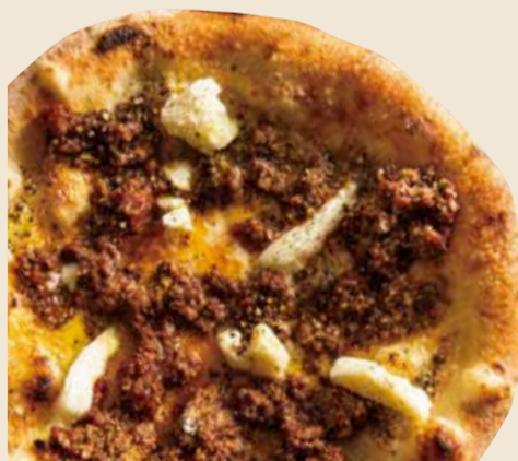
黒毛和牛ボロネーゼ 1100 Kuroge Wagyu beef bolognese (税込 1210) (挽き肉 × モッツアレラ)