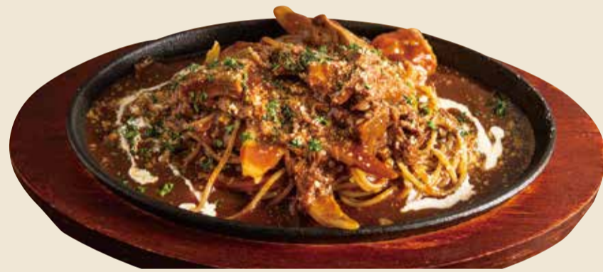
鉄板ビーフ煮込みパスタ