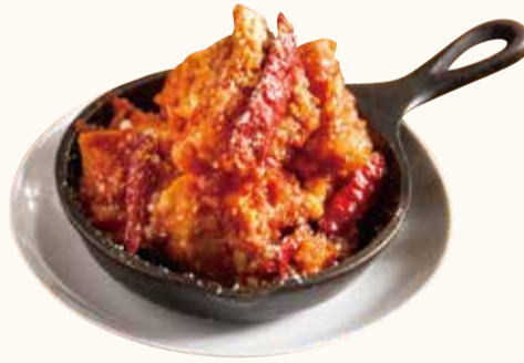
鶏から揚げディアボロソース Deep-fried chicken with diablo sauce