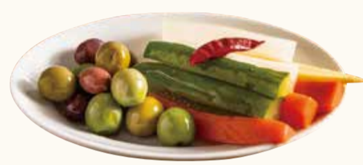
ピクルスとオリーブ Pickles & olive