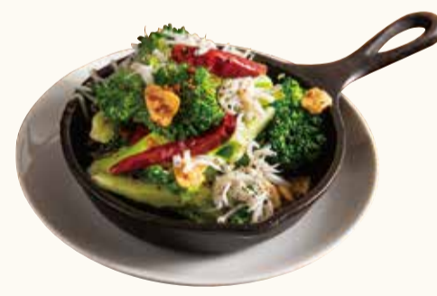
しらすとブロッコリーの アヒージョ Whitebait & broccoli ajillo