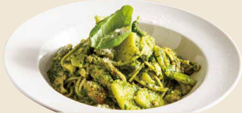
鶏とじゃが芋のジェノベーゼソース