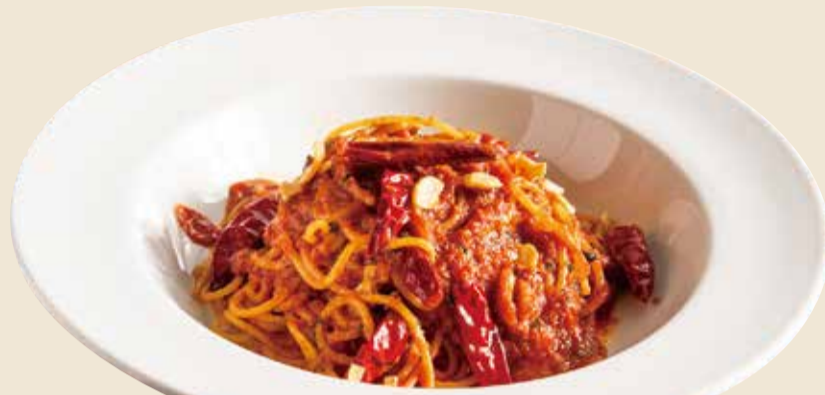
焦がしにんにく辛いトマトソース