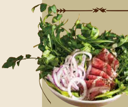
パリアッチョ サラダ Pagliaccio salad S 350 M 700 (税込 385) (税込 770)