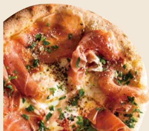
ビスマルク 1200 Bismarck (税込 1320) (玉子 × 生ハム × トマトソース × モッツアレラ)