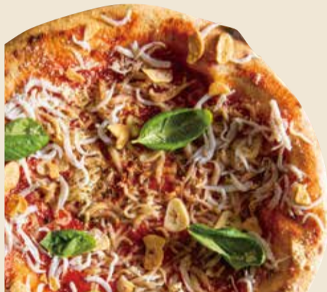
マリナーラ 900 Marinara (税込 990) (トマト × にんにく × しらす × バジル)