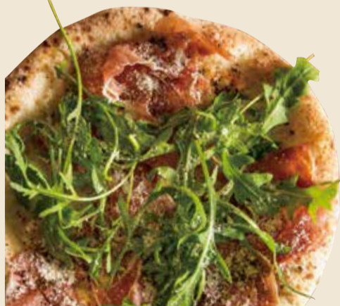
プロシュート 1300 Prosciutto (税込 1430) (生ハム × モッツアレラ × ルッコラ)