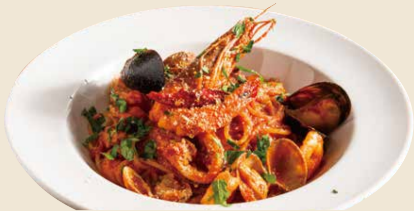
魚介のペスカトーレ (トマトソース)