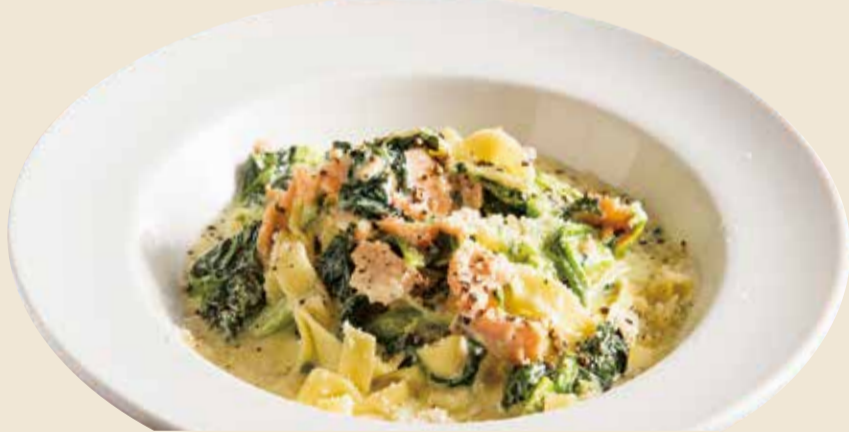
サーモンとほうれん草クリーム