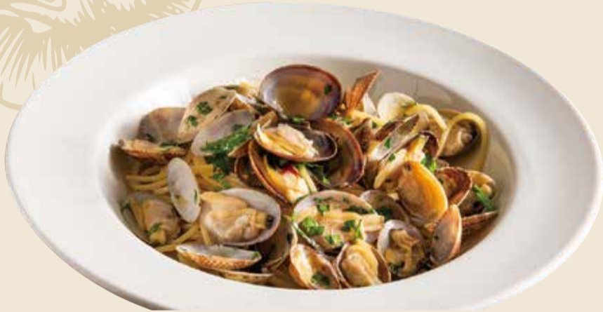
アサリのボンゴレビアンコ