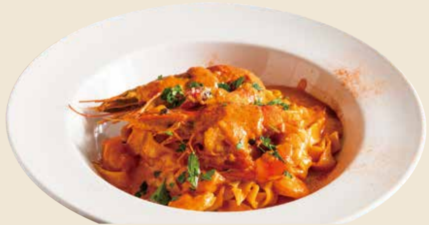
海老アメリケーヌ