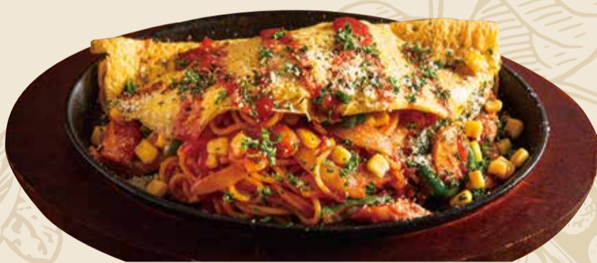
鉄板オムナポリタン