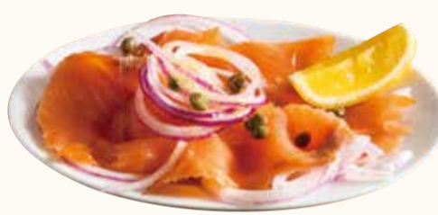
スモークサーモンのマリネ Smoked salmon marine