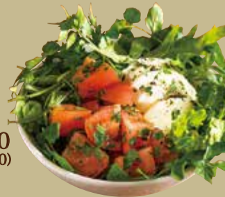
カプレーゼ サラダ Caprese salad S 350 M 700 (税込 385) (税込 770)