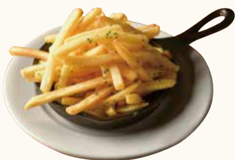
フライドポテト French fries