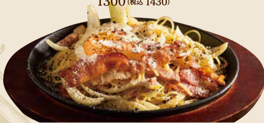
鉄板焼きカルボナーラ