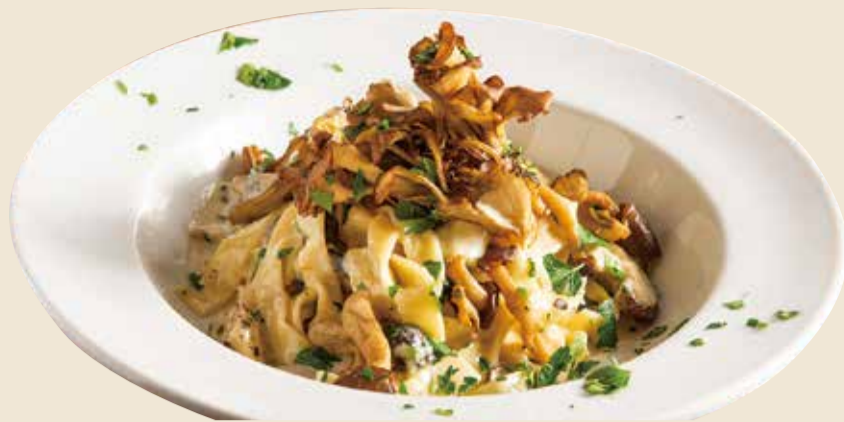
きのこクリームチーズパスタ