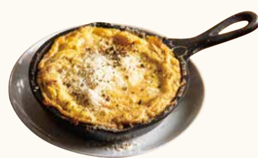
3種チーズオムレット 3 kinds of cheese omelet