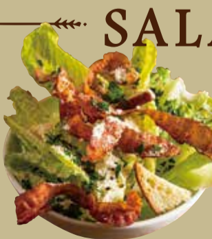
シーザー サラダ Caesar salad S 350 M 700 (税込 385) (税込 770)