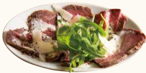
ローストビーフカルパッチョ Roast beef carpaccio