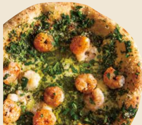
海老ジェノベーゼ 1200 Shrimp genovese (税込 1320) (海老 × モッツアレラ × ジェノベーゼソース)