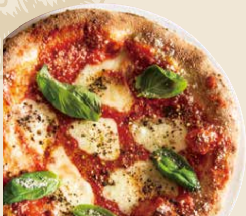
マルゲリータ 1000 Margherita (税込 1100) (モッツアレラ × バジル × トマトソース)