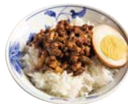
半魯肉飯 ルーローはん +480円 (税込+528) 🍲🌿