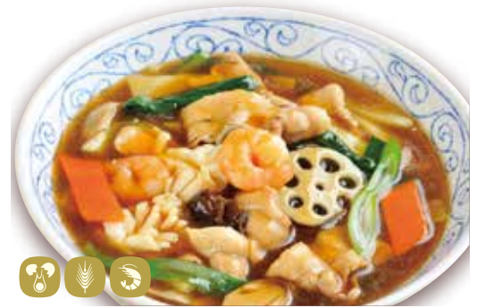
広東麵 五目とろみ麵 Kanton style soup noodles 1100円 (税込 1210) 🍲🌿🥚