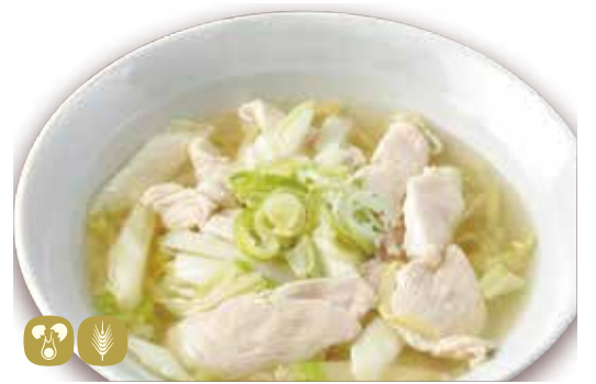
鶏柚子麵 鶏ゆず麵 Chicken & Yuzu soup noodles 920円 (税込 1012) 🍲🌿