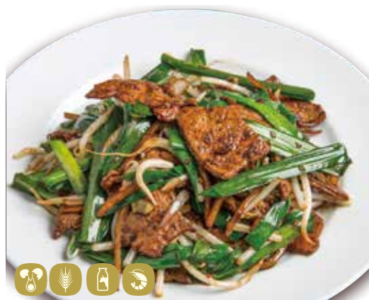
韭菜猪肝 レバにら炒め Stir-fried pork liver & green leek