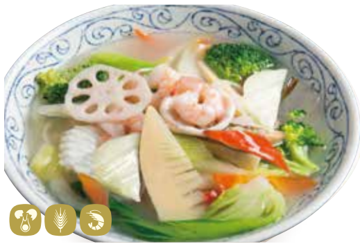
海鮮湯麵 海鮮五目そば Seafood thick sauce on soup noodles 1380円 (税込 1518) 🍲🌿🥚