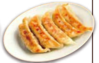
やみつき焼き餃子 Pan-fried pork dumplings 5個 +360円 (税込+396) 🍲🌿🥚