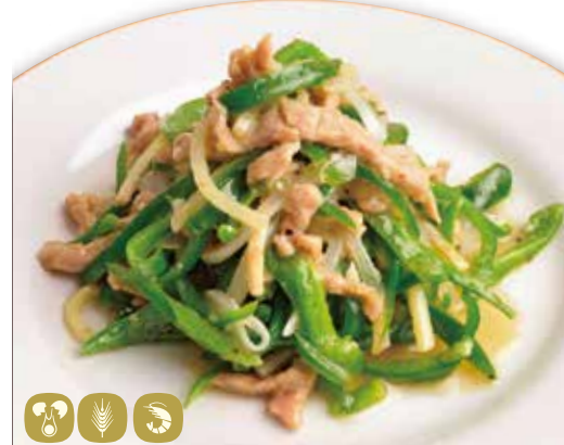
青椒肉絲 チンジャオロース ピーマンと細切り肉の炒め Stir-fried thin sliced green pepper & meat