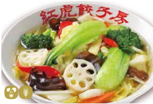
蔬菜湯麵 野菜タンメン Vegetable soup noodles 980円 (税込 1078) 🍲🌿