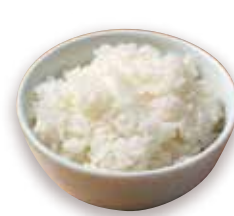
単品ライス Rice +200円 (税込+220)