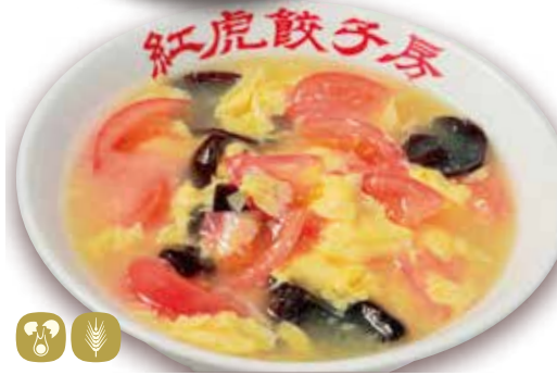
西紅柿蛋麵 トマト玉子麵 Tomato & egg soup noodles 880円 (税込 968) 🍲🌿