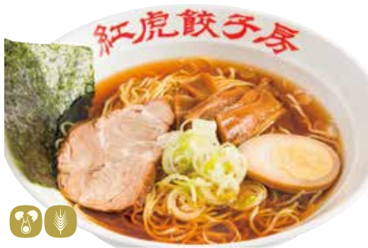
拉麵 らーめん (醤油/塩) Ramen (soy sauce/salt) 780円 (税込 858) 🍲🌿