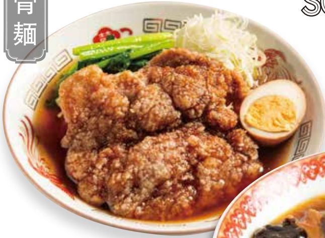
排骨麵 豚ロース揚げパイコー麵 Fried pork loin on soup noodles 1200円 (税込 1320) 🍲🌿🥚