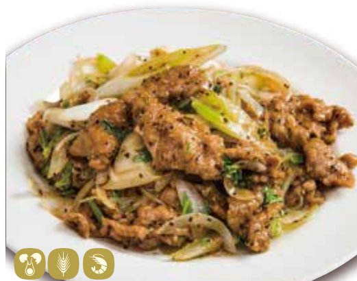
黒椒牛肉 牛肉セロリ黒胡椒炒め Stir-fried beef & celery w/ black pepper