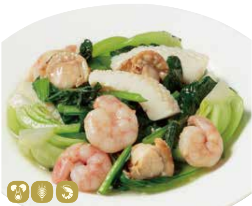
清炒海鮮 海鮮青菜炒め Stir-fried mix seafood & vegetables