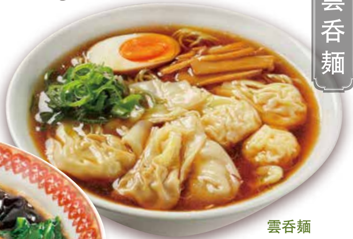
雲呑麵 えびワンタン麵 Shrimp wonton soup noodles 1100円 (税込 1210) 🍲🌿🥚