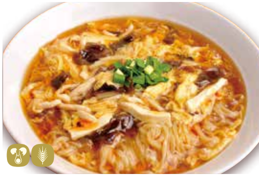
酸辣湯麵 酸っぱい辛い サンラータン麵 Hot & sour soup noodles 980円 (税込 1078) 🍲🌿🌶️