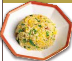
半チャーハン 1/2 fried rice +450円 (税込+495) 🍲🌿