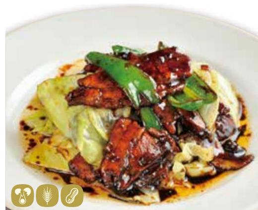
回鍋肉 ホイコーロウ 豚キャベツ味噌炒め Stir-fried pork & cabbage w/ miso