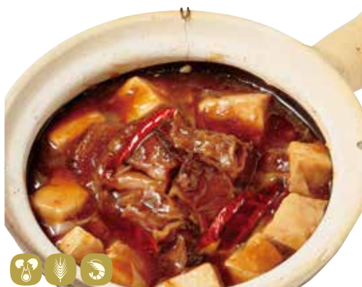
牛腩豆腐 牛バラ豆腐土鍋煮 Stewed beef rib & tofu cooked in clay pot