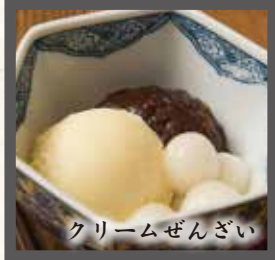
クリームぜんざい