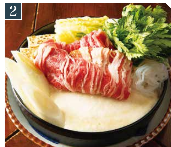
2 牛とろろちび鍋 1,380 Beef small hot pot w/ grated yam (税込 1,518) 牛肉山药锅