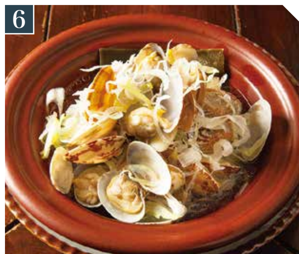
6 あさり酒蒸しちび鍋 1,180 Sake-steamed Asari clams small hot pot (税込 1,298) 酒蒸蛤蜊锅