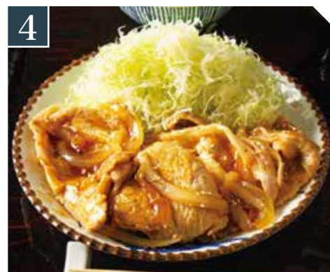
4 豚ロース生姜焼き定食 Ginger pork loin set meal 猪里脊生姜套餐 1,080 (税込 1,188)