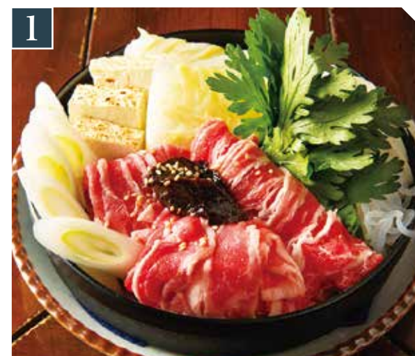
1 牛味噌ちび鍋 1,380 Beef small hot pot w/ miso (税込 1,518) 牛肉味噌锅