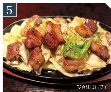
5 鉄板焼肉定食 Grilled on an iron-plate set meal 铁板烧套餐 牛 1,660~ (税込 1,826) 豚 1,280~ (税込 1,408) 相盛り mixed/牛猪 1,560~ (税込 1,716)