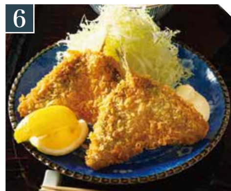
6 アジフライ定食 Deep-fried horse mackerel set meal 竹荚鱼唐扬炸套餐 980 (税込 1,078)