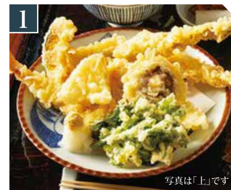
1 天麩羅定食 Tempura set meal 上(L) 1,780 (税込 1,958) 天妇罗套餐 並(M) 1,180 (税込 1,298) 写真は「上」です