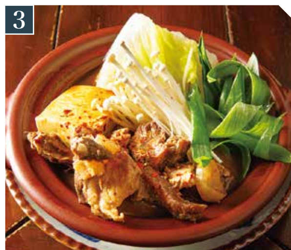
3 牛スジ豆腐煮込ちび鍋 980 Beef tendon & Tofu small hot pot (税込 1,078) 炖煮牛筋豆腐锅