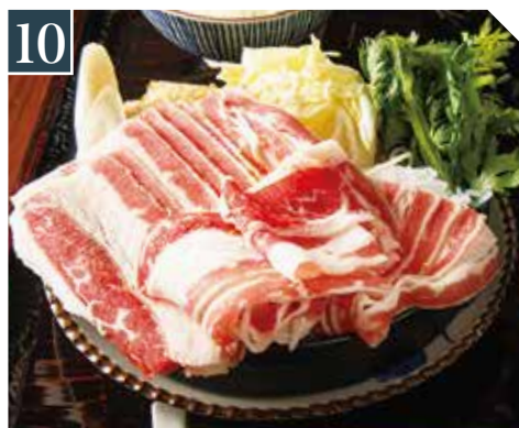
10 肉盛り牛バラすき焼き定食 Beef rib Sukiyaki set meal 牛肋骨寿喜烧套餐 1,180 (税込 1,298)

Dinner set meal 晚饭套餐 ご飯、味噌汁、漬物付き with rice, Miso soup & pickles / 带米饭・酱油・咸菜