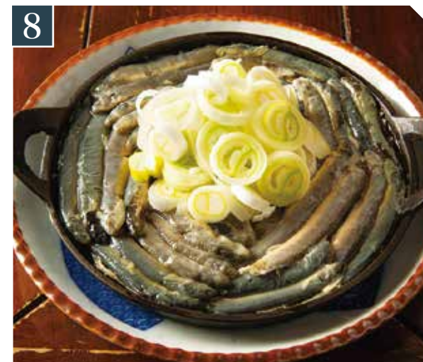
8 どぜうちび鍋 1,580 Loach small hot pot (税込 1,738) 泥鳅锅