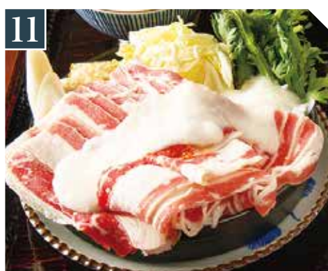
11 肉盛り牛バラとろろすき焼き定食 Beef rib Sukiyaki with grated yam set meal 牛肋骨山药泥寿喜烧套餐 1,280 (税込 1,408)