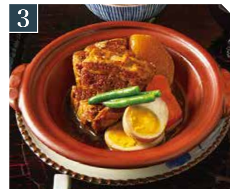
3 国産豚角煮定食 Simmered Japanese pork belly set meal 东坡肉套餐 (日本国产猪) 1,280 (税込 1,408)