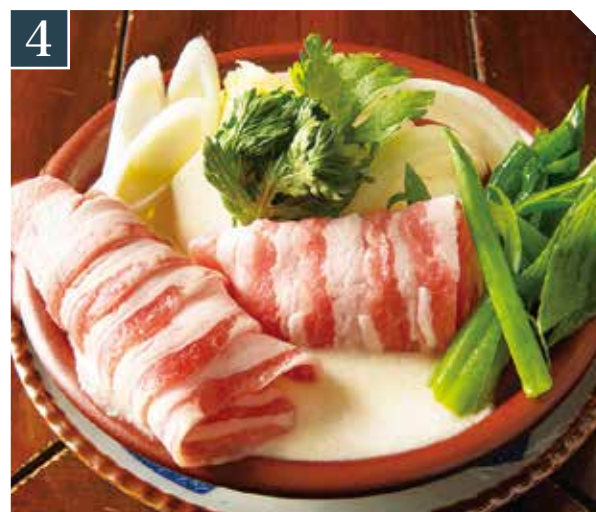
4 国産豚とろろちび鍋 1,080 Japanese pork & grated yam hot pot (税込 1,188) 猪肉山药泥锅套餐(日本国产猪)