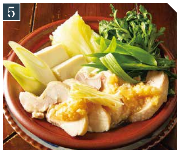
5 鶏生姜ちび鍋 980 Chicken & ginger small hot pot (税込 1,078) 鸡生姜锅

Small hot pot 小土鍋 一人前ずつご用意します One serving / 一份儿