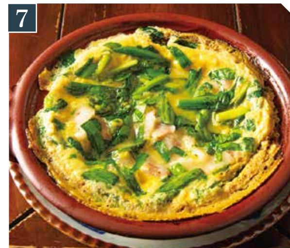
7 海老ニラ玉ちび鍋 880 Shrimp, Chinese chives & egg small hot pot (税込 968) 虾子韭菜鸡蛋锅