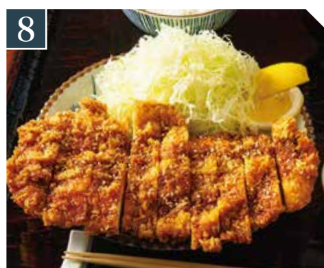
8 チキンカツ定食 Chicken cutlet set meal 炸鸡肉排套餐 980 (税込 1,078)