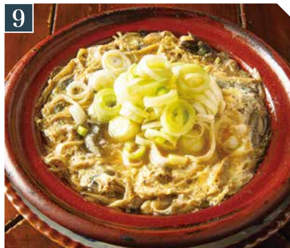
9 どぜう柳川ちび鍋 1,680 Loach & egg small hot pot (税込 1,848) 柳川鍋