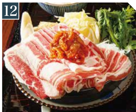
12 肉盛り牛バラキムチすき焼き定食 Beef rib Sukiyaki with kimchi set meal 牛肋骨山泡菜寿喜烧套餐 1,280 (税込 1,408)