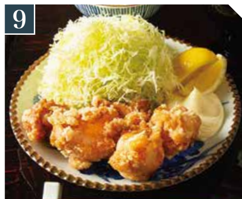
9 鶏唐揚げ定食 Deep-fried chicken set meal 炸鸡块套餐 980 (税込 1,078)