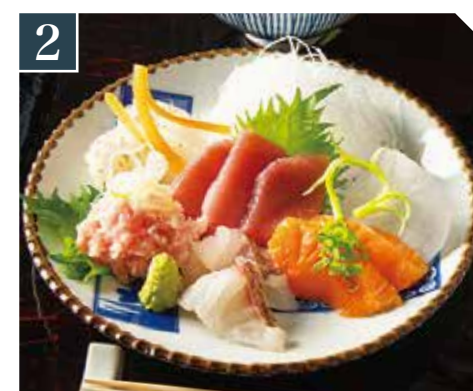
2 刺身定食 Sashimi set meal 生鱼片套餐 1,680 (税込 1,848)