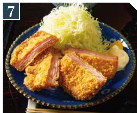
7 ハムカツ定食 Ham cutlet set meal 烤火腿排套餐 980 (税込 1,078)