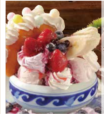
盆栽莓果力聖代 盆栽ベリーベリーパフェ Bonsai berry & berry parfait