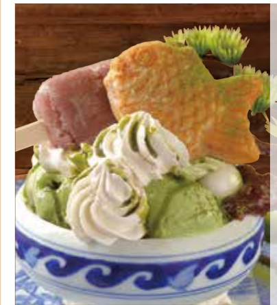
盆栽抹茶パフェ 盆栽抹茶力聖代 Bonsai matcha parfait