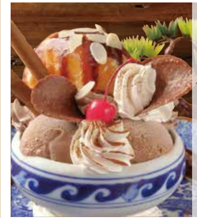
盆栽巧克力聖代 盆栽チョコパフェ Bonsai chocolate parfait