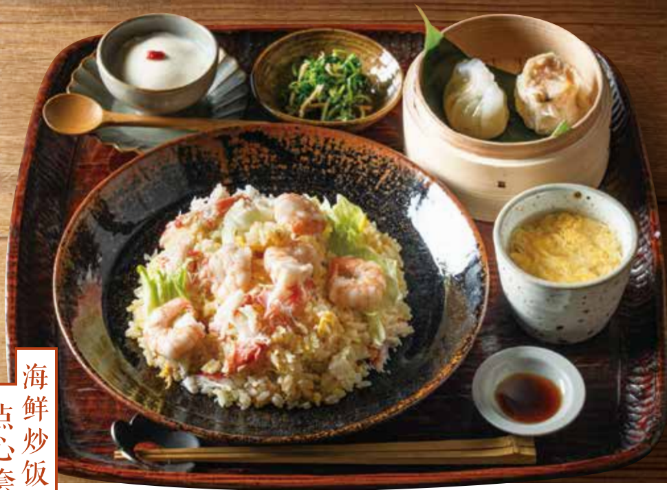
エビ蟹チャーハンと点心膳 Shrimp & crab fried rice w/ dim sum set