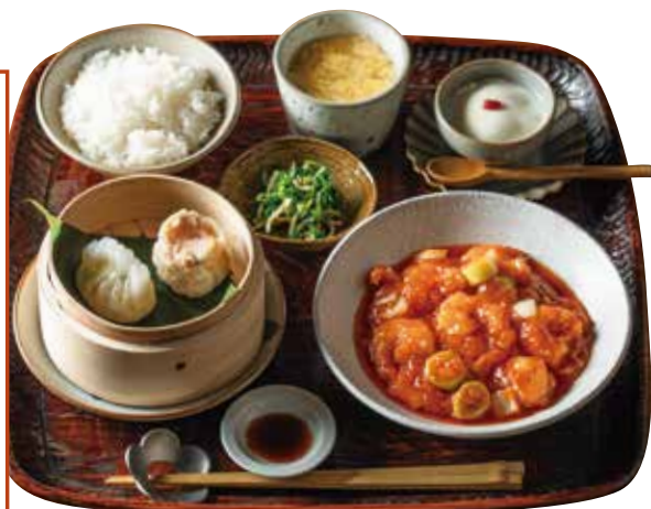
エビチリソースと点心膳

Stir-fried shrimp w/chili sauce & dim sum set