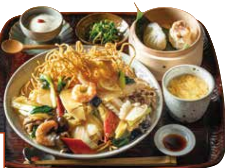
五目あんかけかた焼そばと 点心膳

Mixed ingredients w/ thickened sauce on fried noodles & dim sum set