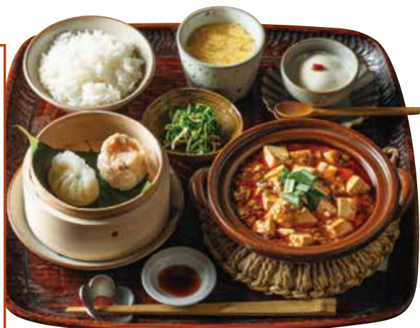
麻婆豆腐と点心膳