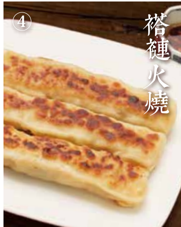
① 生煎包子 焼きパオズ Sizzling buns 3個 660(税込726) 追加1個 220(税込242)