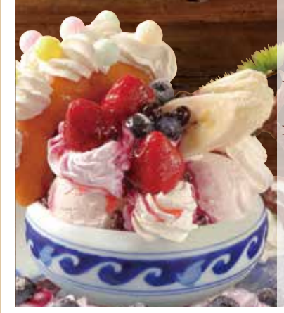
盆栽莓果力聖代 盆栽ベリーベリーパフェ Bonsai berry & berry parfait