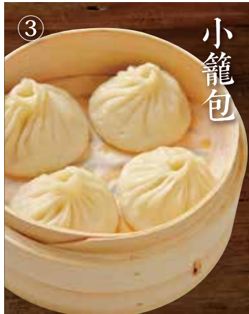
③ 小籠包 上海ショウロンポウ Shanghai steamed Xiaolongbao 4個 640(税込704)