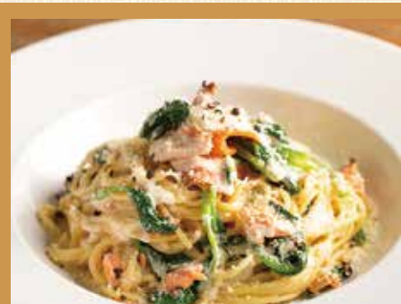
サーモンとほうれん草のクリームソーススパゲッティ