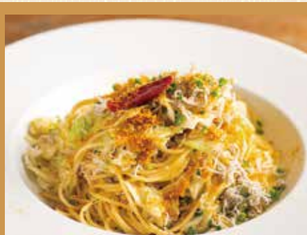
しらす、キャベツ、カラスミのペペロンチーノ