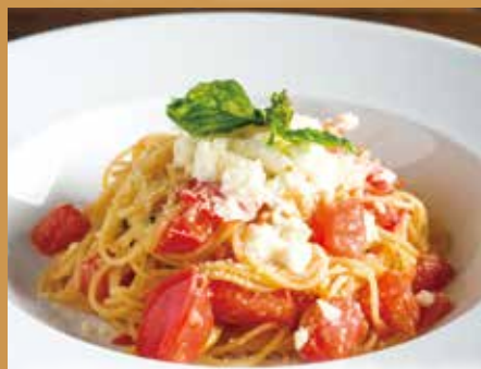
スパゲッティ フレッシュトマトとモッツァレラ