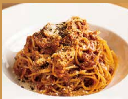
スパゲッティ 粗挽き肉のボロネーゼ