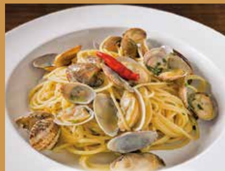
スパゲッティ ボンゴレビアンコ