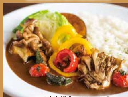
いろどり野菜のカレーライス