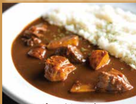
ビーフカレーライス