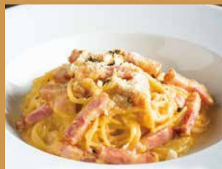
スパゲッティ 濃厚カルボナーラ