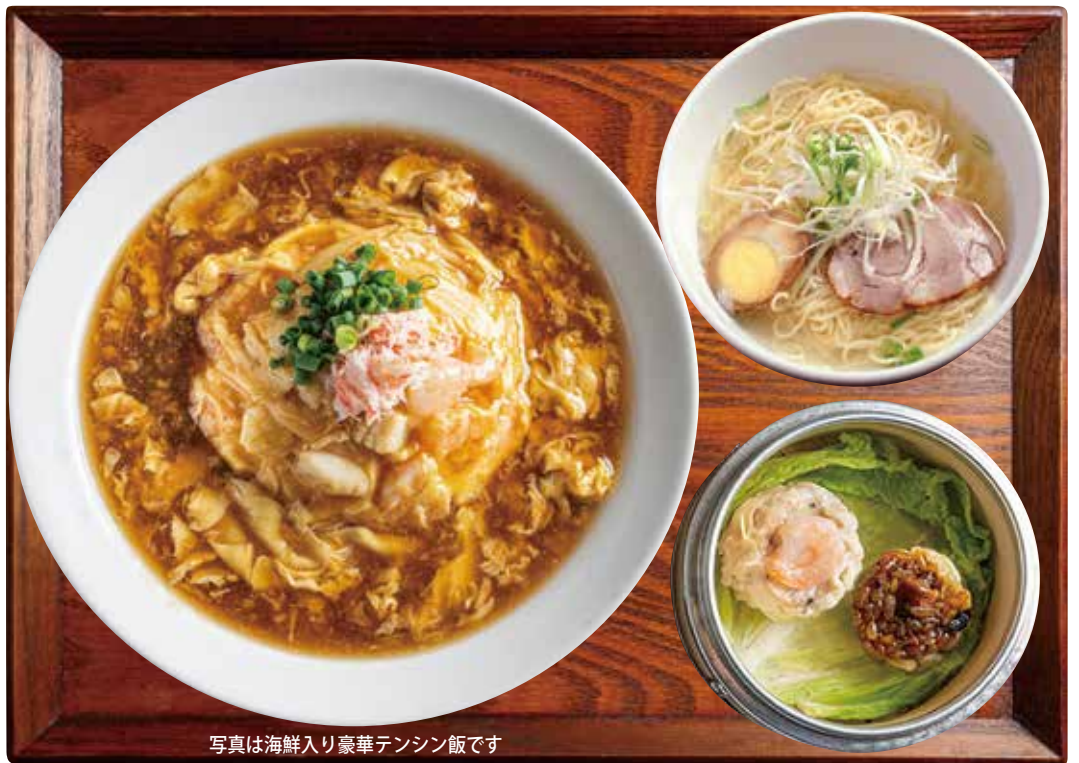
写真は海鮮入り豪華テンシン飯です