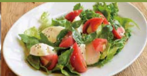
カプレーゼサラダ Caprese Salad