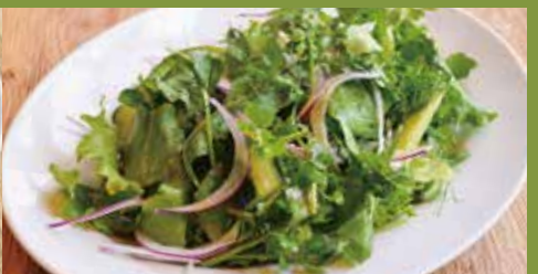
ガーデンサラダ Garden Salad