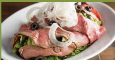
ローストビーフサラダ Roast beef Salad