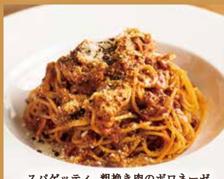
スパゲッティ 粗挽き肉のボロネーゼ