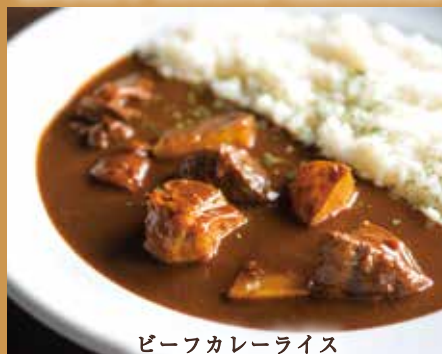
ビーフカレーライス