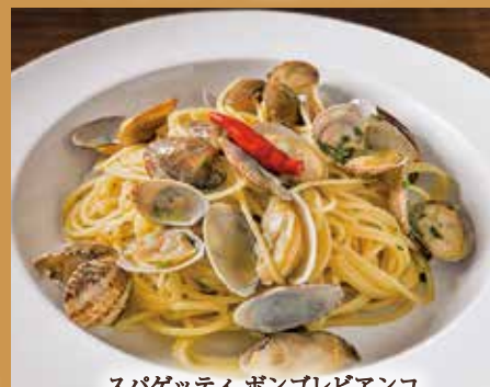
スパゲッティ ボンゴレビアンコ