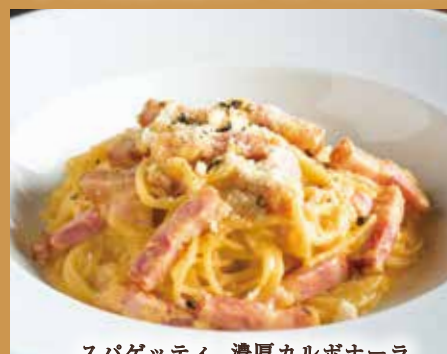
スパゲッティ 濃厚カルボナーラ