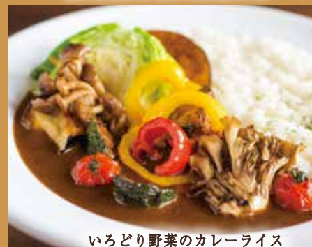
いろどり野菜のカレーライス