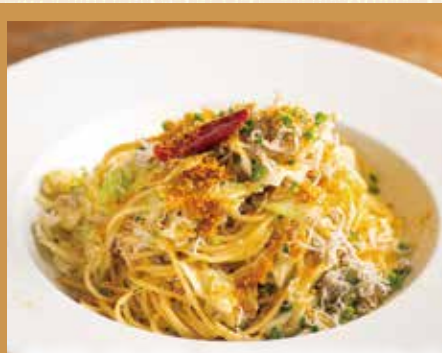
しらす、キャベツ、カラスミのペペロンチーノ