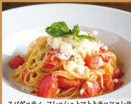
スパゲッティ フレッシュトマトとモッツァレラ