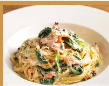
サーモンとほうれん草のクリームソーススパゲッティ