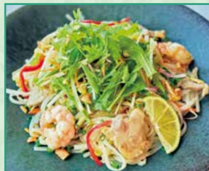
海老と豚肉 野菜のパッタイ