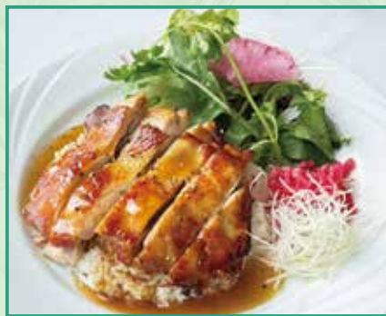
越南風チキンライス コムガー