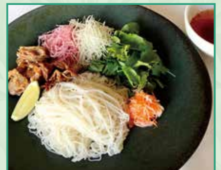
ベトナムつけ麺 ブンチャー

Vietnamese dipping noodles "Bun Cha" 1,200