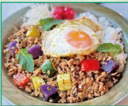
鶏肉とタイバジル炒め ガパオライス