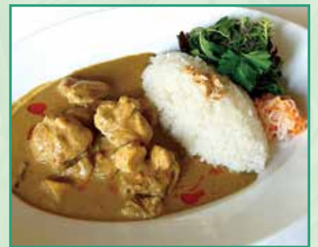
鶏肉じゃが芋 きのこのマッサマンカレー