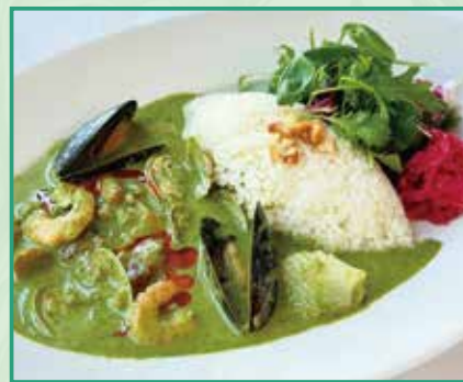
たっぷり海鮮の グリーンカレー