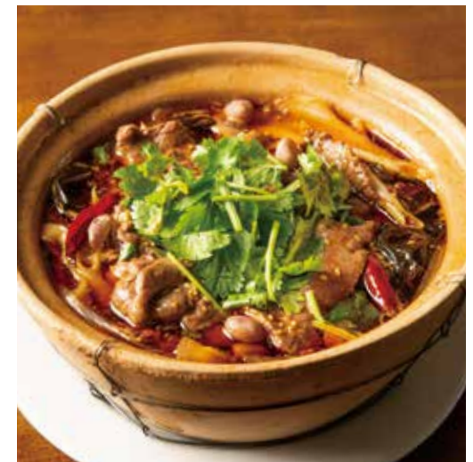
四川辛味スープ牛肉煮