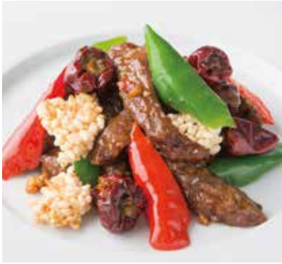
牛肉とおこげのカラカラ炒め