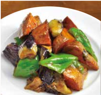
じゃが芋、茄子ピーマン炒め