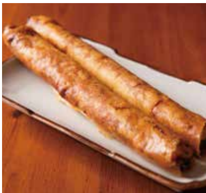
えびイカふりふり春巻き