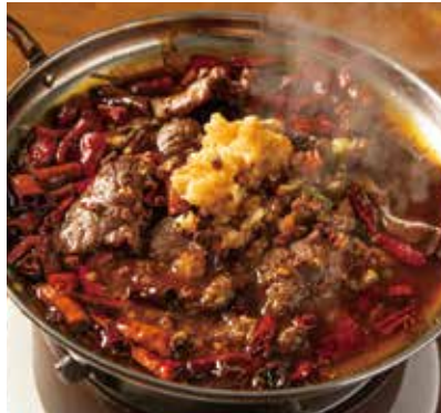
四川辛味スープ羊肉煮