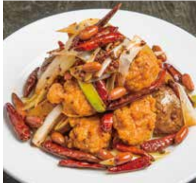
鶏とナッツの唐辛子炒め