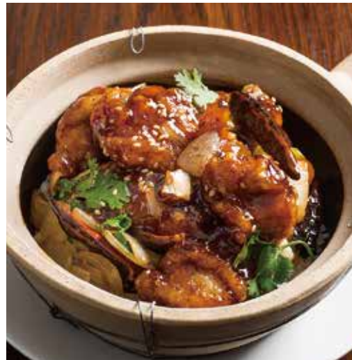
鶏の甘辛土鍋ごはん