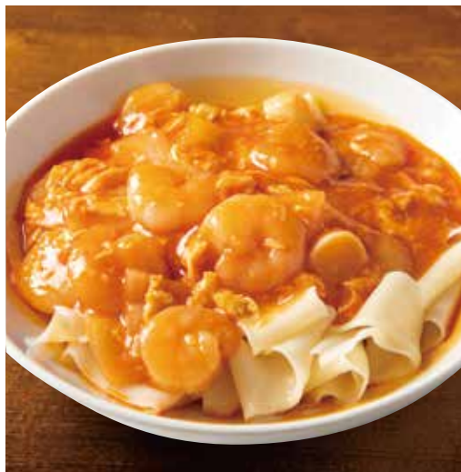
エビと玉子チリソースあえ麺