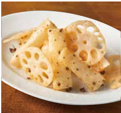
山芋とレンコンサクサク揚げ