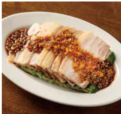
茹で豚肉のにんにく醤油ダレ