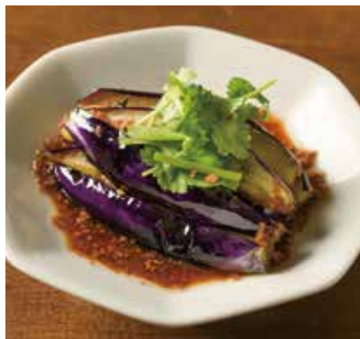
揚げ茄子のニンニクダレ