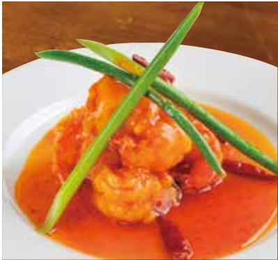
大エビの甘酢チリガーリック