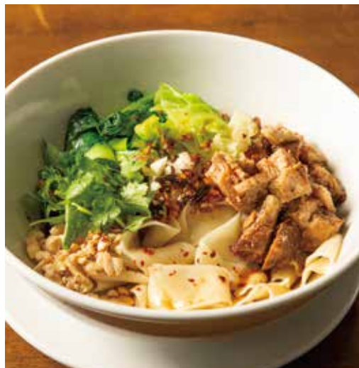
ピリ辛油かけ幅広あえ麺（ユーパー麺）