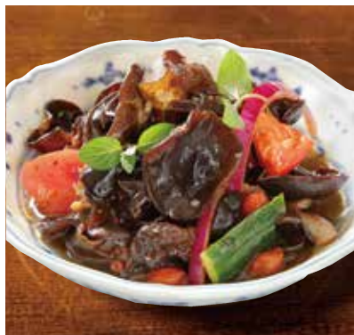
きくらげトマト胡瓜ミントサラダ