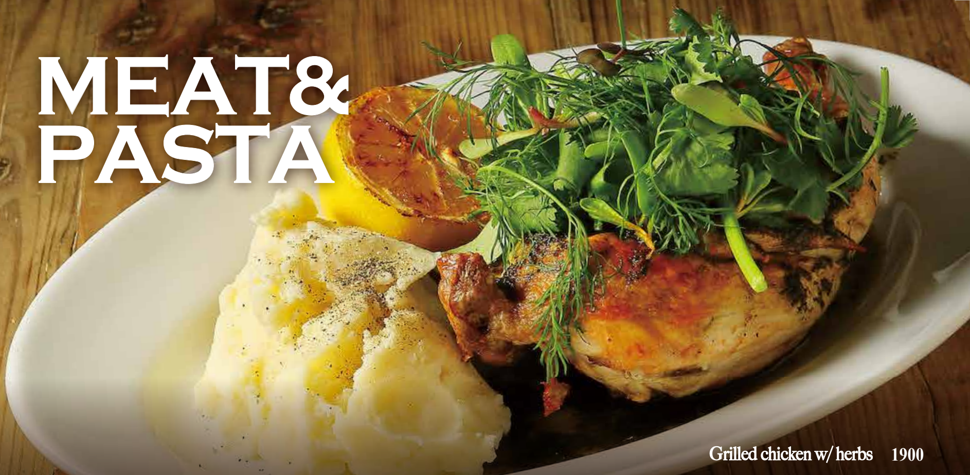
Grilled chicken w/ herbs 1900