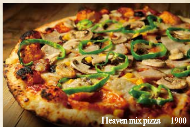
Heaven mix pizza 1900