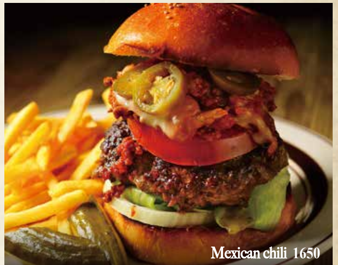
Mexican chili 1650