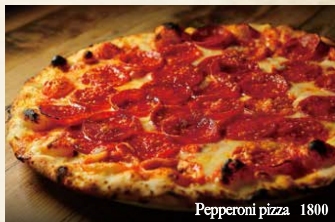
Pepperoni pizza 1800