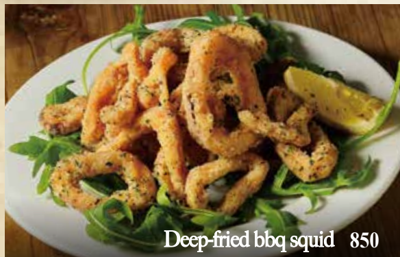
Deep-fried bbq squid 850