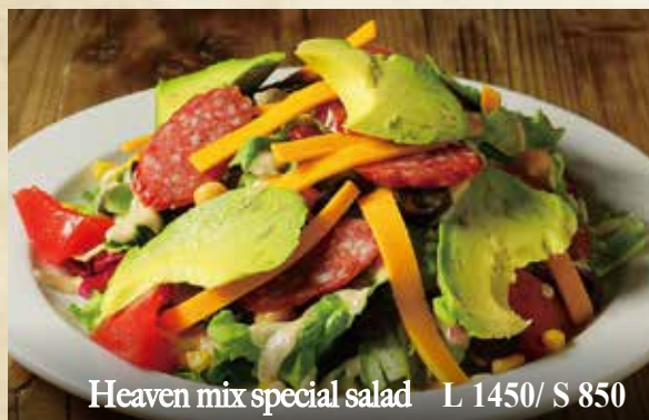
Heaven mix special salad L 1450/ S 850