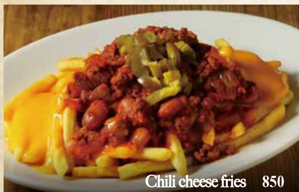
Chili cheese fries 850