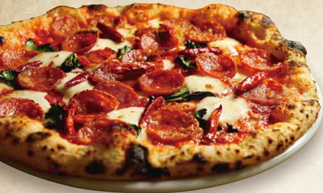
Diavola pizza 1900