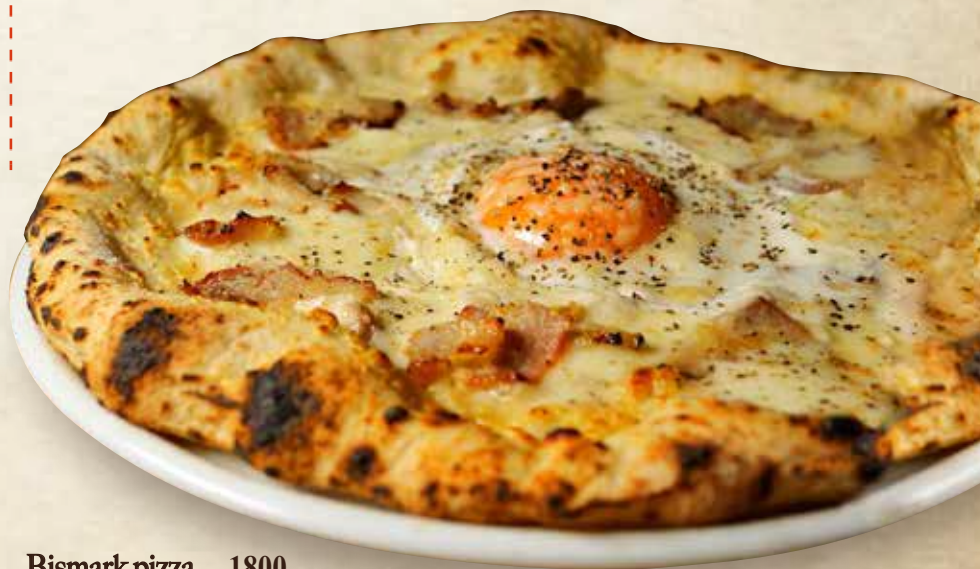
Bismark pizza 1800

Salsiccia, herb, cheese, fresh cream サルシッチャ、ハーブ、チーズ、生クリーム