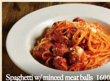
Spaghetti w/ minced meat balls 1600