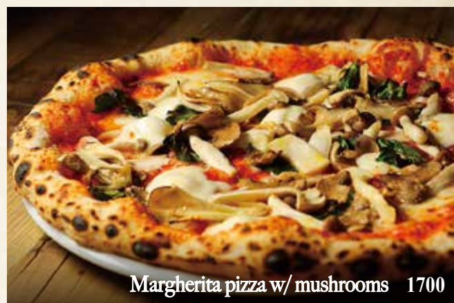
Margherita pizza w/ mushrooms 1700

Whitebait, anchovy, mozzarella, basil しらす、アンチョビ、モッツァレラ、バジル