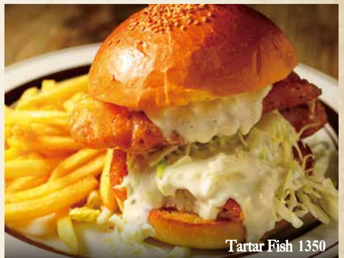
Tartar Fish 1350