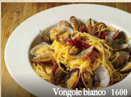
Vongole bianco 1600