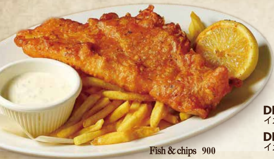
Fish & chips 900