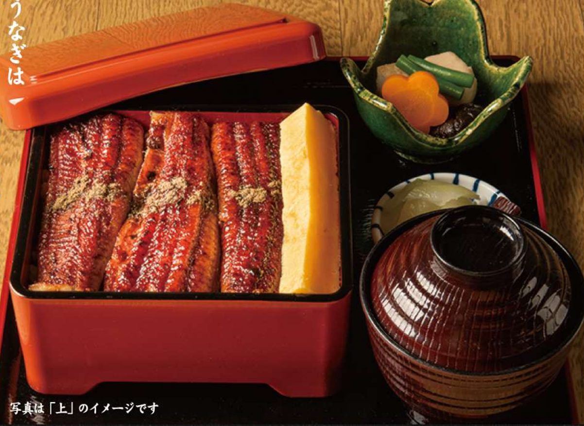
写真は「上」のイメージです