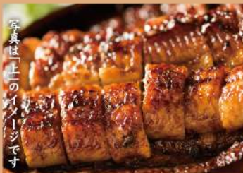
写真は「上」のイメージです