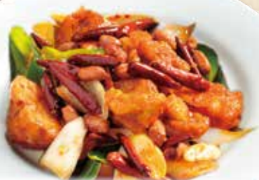
揚げ鶏の唐辛子炒め🌶️