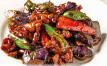
牛肉と茄子の中国味噌炒め

Stir-fried beef & eggplant w/Chinese miso