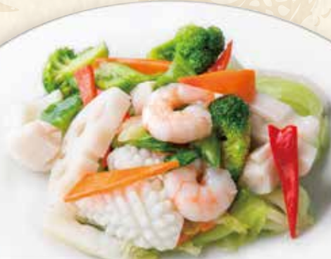
海鮮と季節野菜の塩炒め