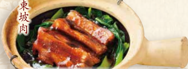
豚角煮トンポーロウ