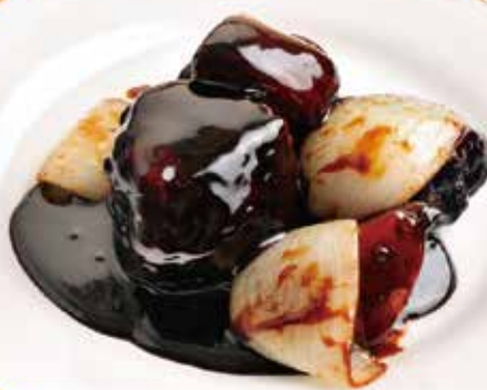
黒酢の真っ黒すぶた