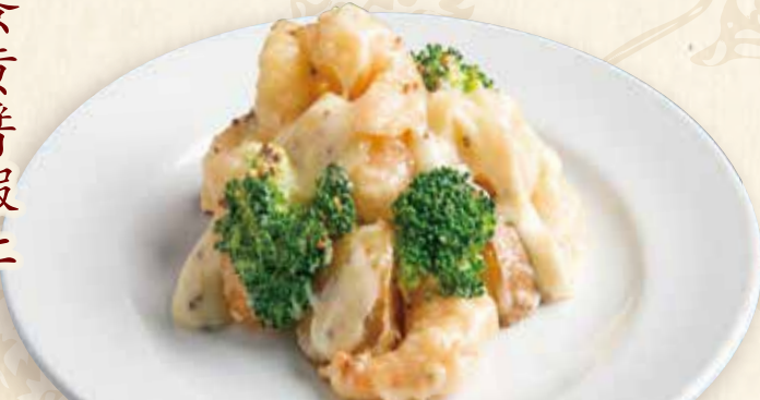
エビマヨネーズソース