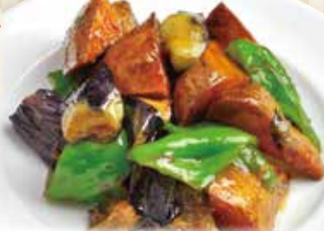
茄子ジャガ芋ピーマン炒め

Stir-fried eggplant, potato & bell pepper