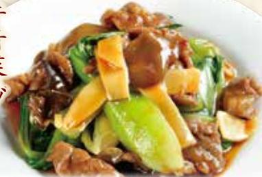
牛肉と青菜のオイスターソース炒め

Stir-fried beef & greens w/worcester sauce