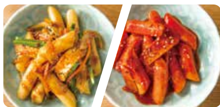
トッポッキ (甘/辛) Toppokki (sweet / spicy)