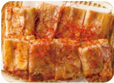
キムチ豚チヂミ Kimchi Korean pancake