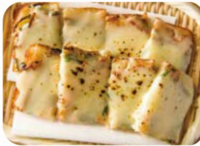
チーズチヂミ Cheese Korean pancake