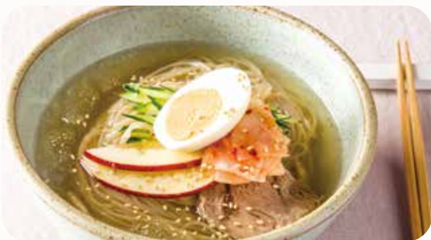
水冷麺 Chilled Korean noodles