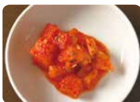
カクテキ Japanese white radish kimchi