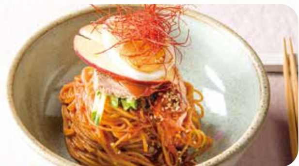
ビビン麺 Korean spicy mixed noodles