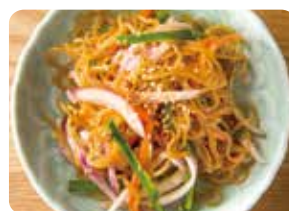
チャプチェ Stir-Fried Sweet Potato Noodles