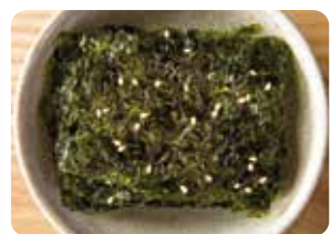
韓国のり Korean seaweed