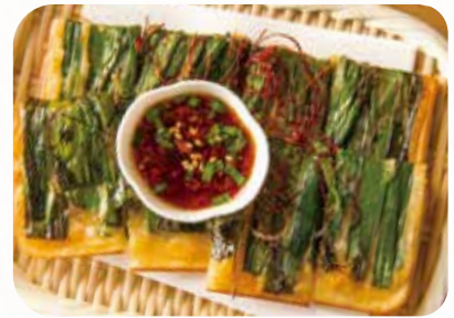
ネギチヂミ Leek Korean pancake