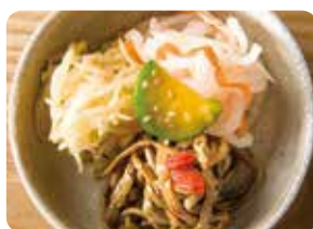
ナムル盛合せ Assorted Namul