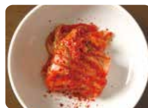
白菜キムチ Chinese cabbage kimchi