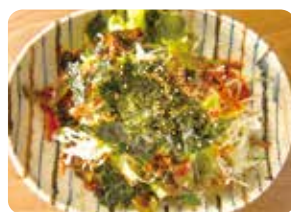
チョレギサラダ Korean Style Choregi Salad