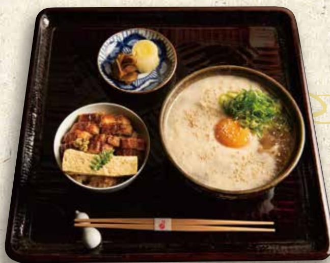
とろろうどん定食【温】 1,980円 (税込 2,178)