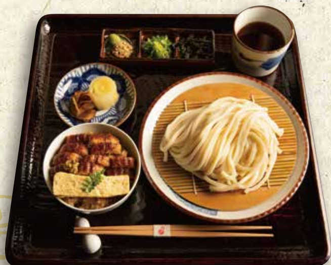
薬味うどん定食 1,480円 (税込 1,628)

笹簾乌冬面 Chilled udon noodles w/ condiment set