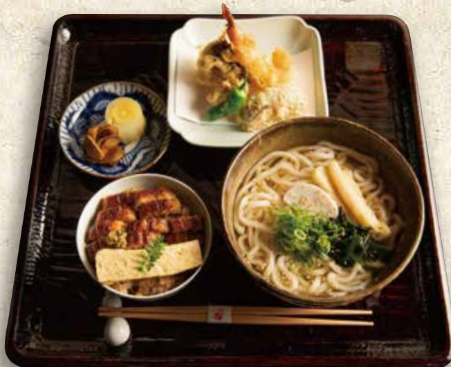
天ぷらうどん定食【温】 2,180円 (税込 2,398)