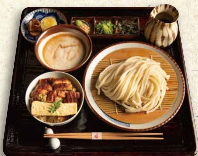
とろろうどん定食【冷】 1,980円 (税込 2,178)

山药泥冷乌冬面 Chilled udon noodles w/ grated yam set