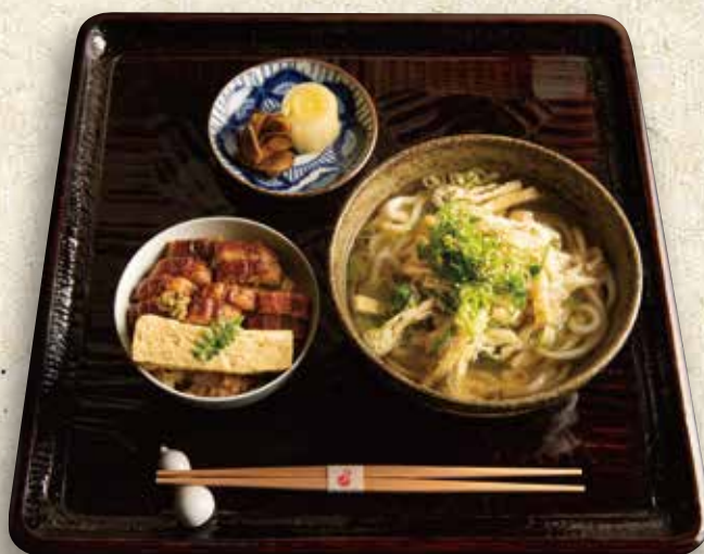
きつねうどん定食 1,480円 (税込 1,628)

油豆腐乌冬面 Deep-fried sliced tofu on udon noodles set