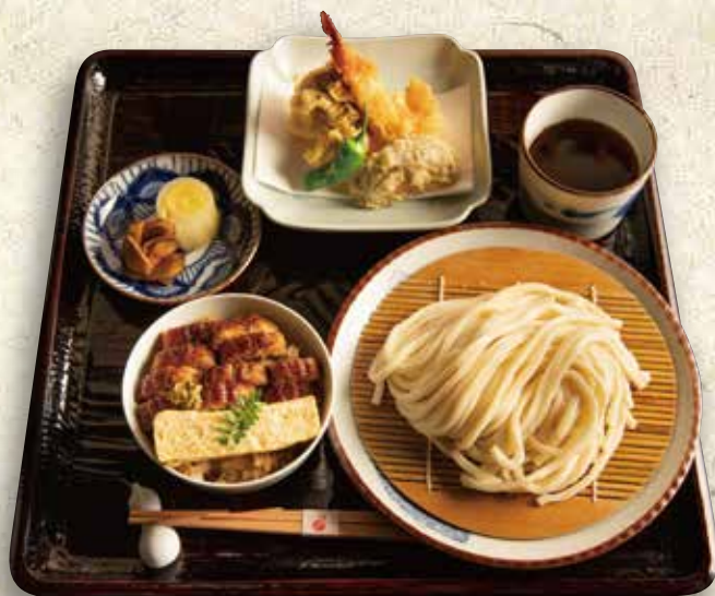
天ぷらうどん定食【冷】 2,180円 (税込 2,398)

烏冬面套餐 Udon & eel rice bowl set 喉ごしの良いうどんに 鰻の一膳めしがついた定食です