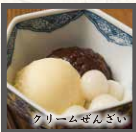
クリームぜんざい