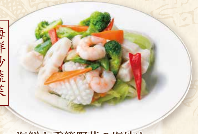
海鮮と季節野菜の塩炒め

Stir-fried seafood & vegetables 1580円(税込1738円) 🌿🍴🍴🍴