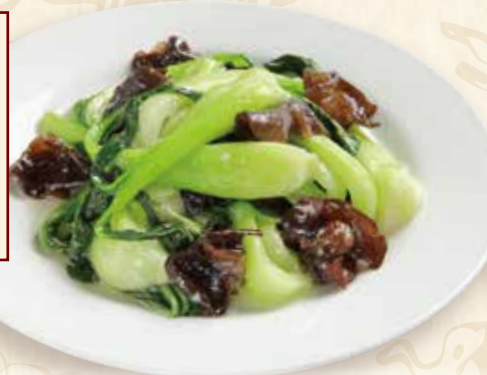
青菜とキクラゲ塩炒め

Stir-fried Chinese greens & wood ear mushrooms 930円(税込1023円) 🌿