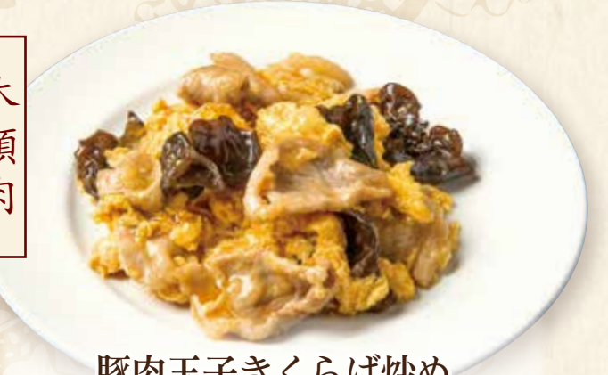
豚肉玉子きくらげ炒め

Stir-fried pork, egg & wood ear mushrooms 1030円(税込1133円) 🌿🍴🍴🍴