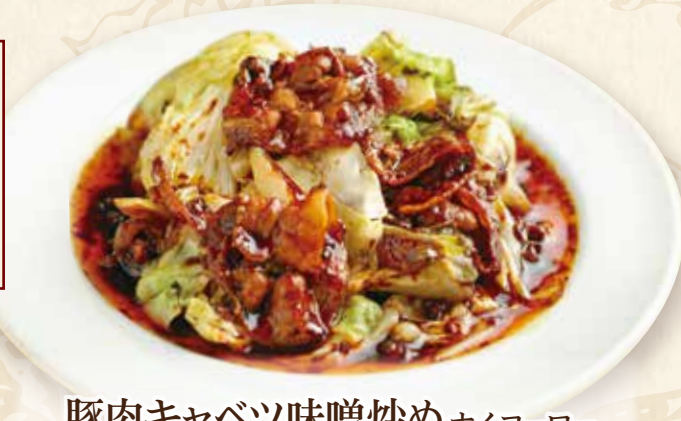
豚肉キャベツ味噌炒め ホイコーロー

Stir-fried pork & cabbage w/miso 1080円(税込1188円) 🌿🍴🍴🌶️