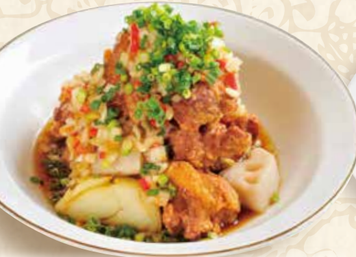
揚げ鶏の香味だれ ユーリンチー

Deep-fried chicken w/condiment sauce 1080円(税込1188円) 🌿🍴🍴